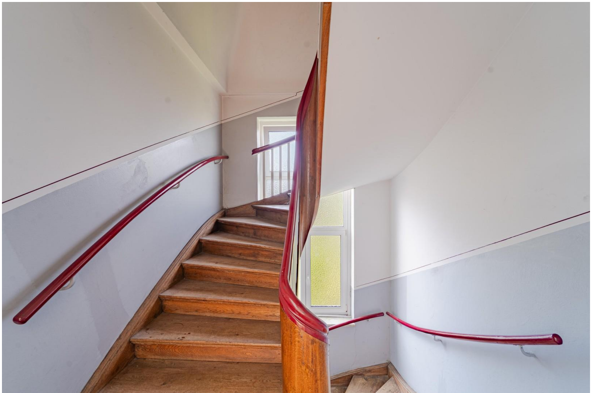
Treppe - Hausflur