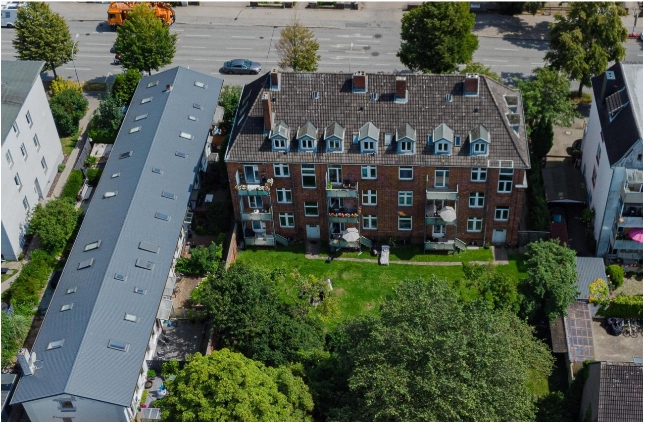
Hausansicht - Gartenseite