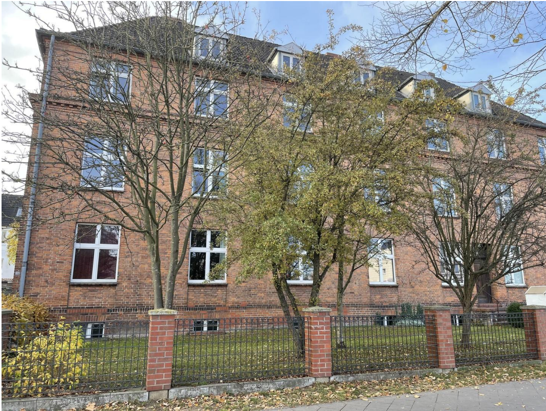
Hausansicht - Strassenseite 2