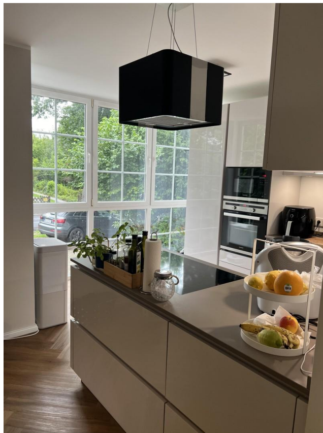
Küche mit Ausblick