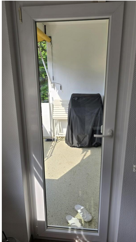
Balkon vom Wohnzimmer