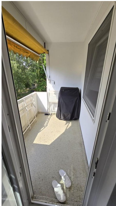
Balkon - Bild 2