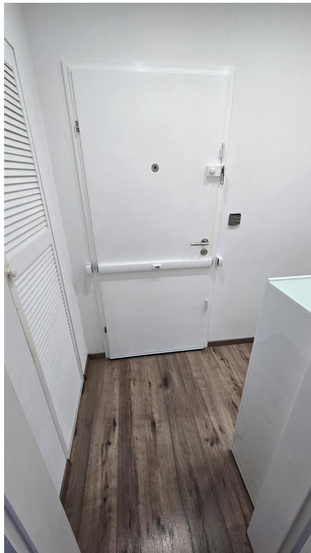
Flur Eingangstür / Abstellraum