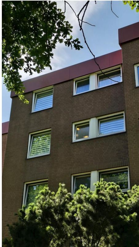
Oberste Etage Aussenansicht