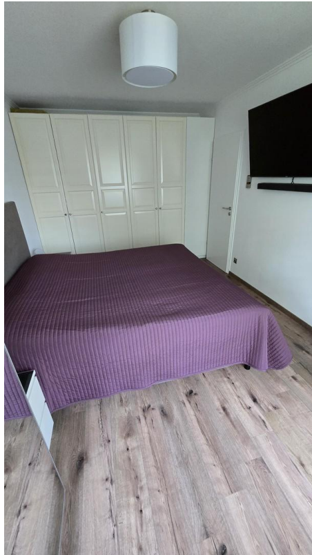
Schlafzimmer - Bild 3