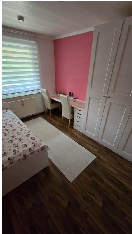
Kinderzimmer 2 - Bild 2