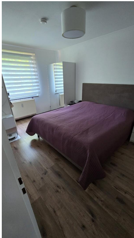
Schlafzimmer - Bild 2