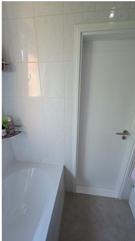
Bad - Durchgang zum SZ