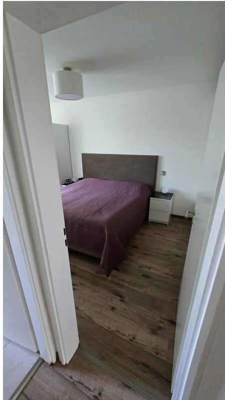
Schlafzimmer - Bild 1