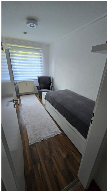
Kinderzimmer 1 - Bild 1