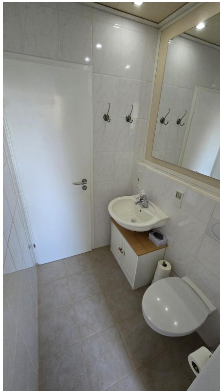
WC - Bild 2