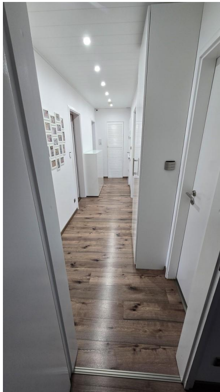
Flur vom Schlafzimmer