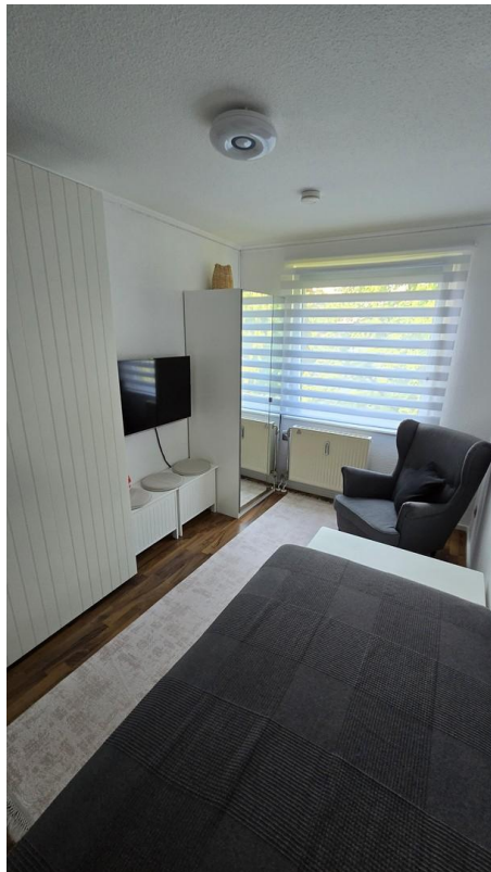
Kinderzimmer 1 - Bild 3