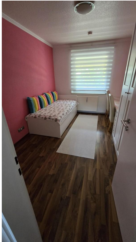
Kinderzimmer 2 - Bild 1