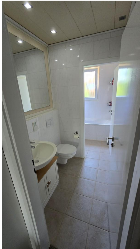
WC - Bild 1