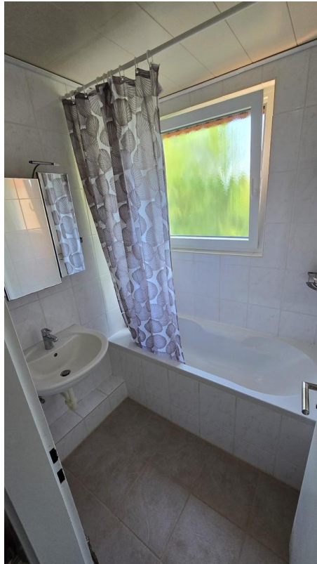
Bad - Bild 1