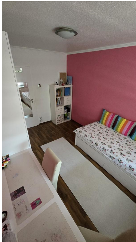
Kinderzimmer 2 - Bild 4