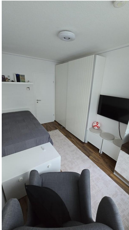
Kinderzimmer 1 - Bild 2