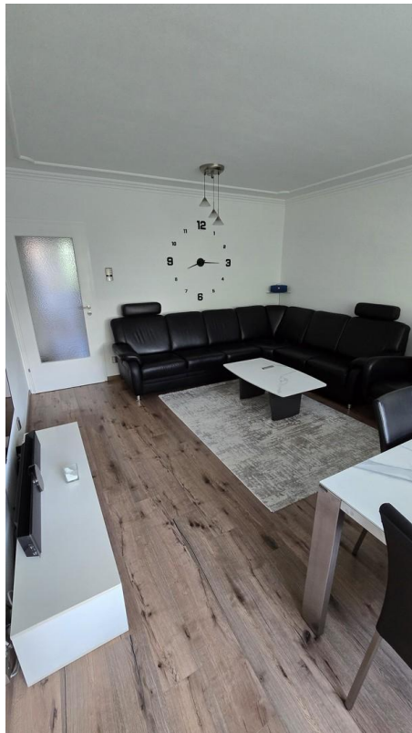
Wohnzimmer - Bild 2