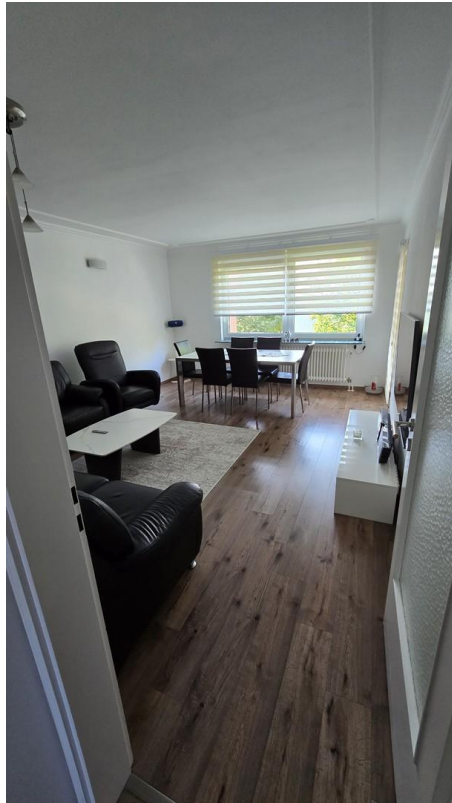
Wohnzimmer - Bild 1