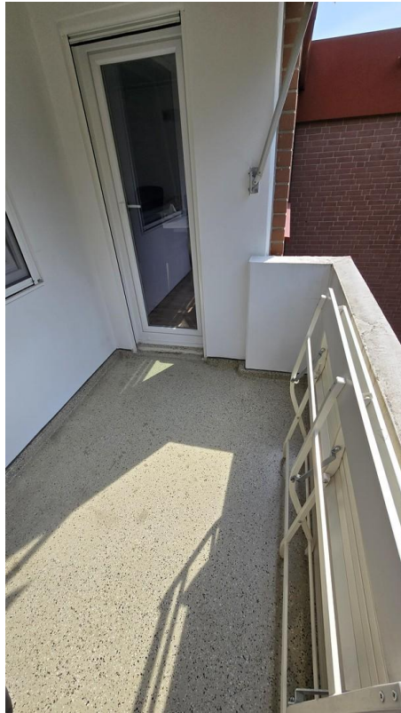
Balkon - Bild 3