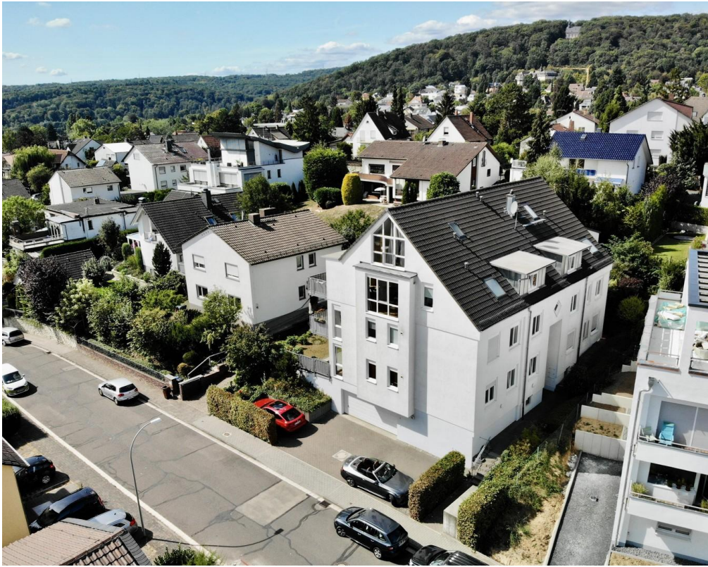
in Hofheim direkt am Steinberg