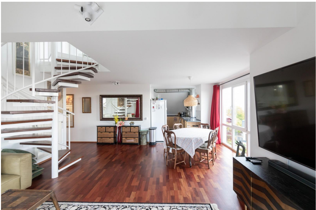
Wohn- & Esszimmer