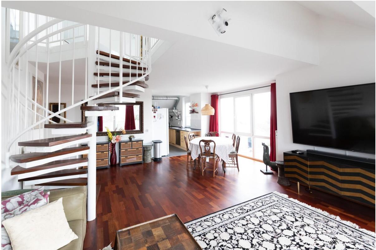
Zwei Stöckige Penthouse Whg