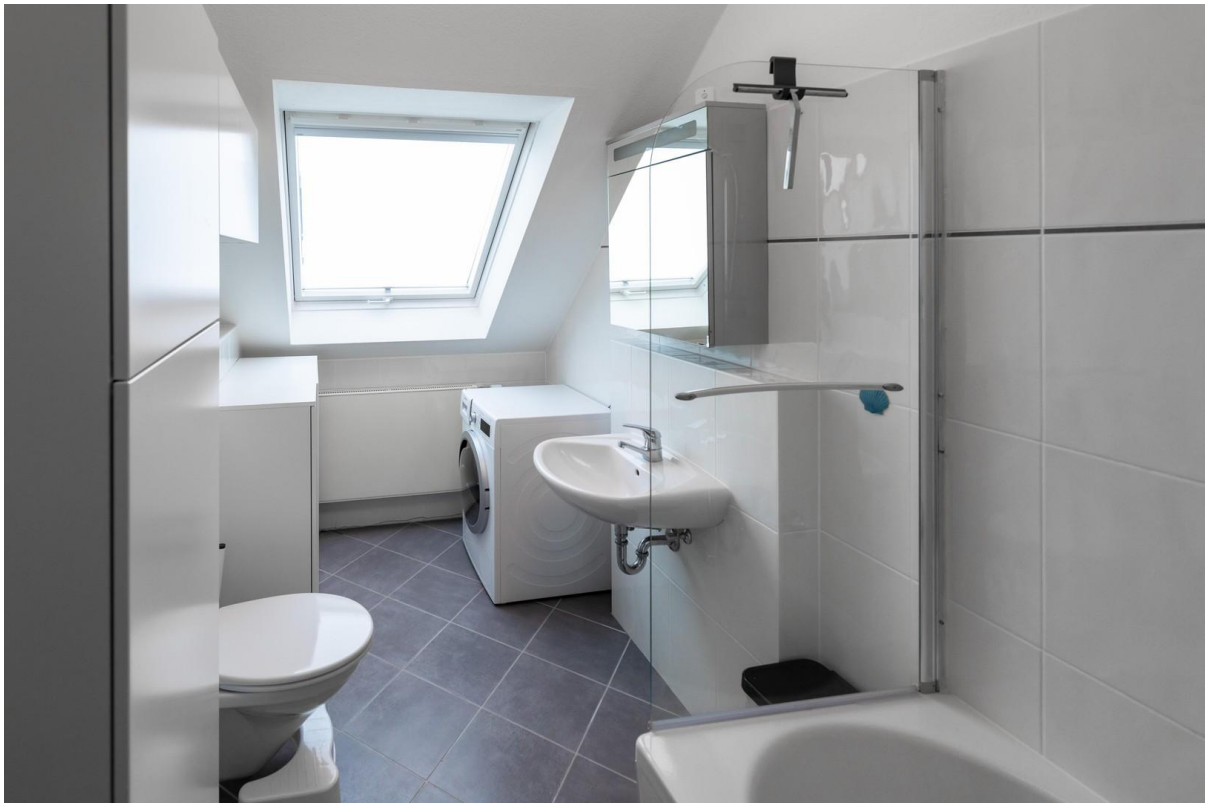
Badezimmer #1 mit Wanne