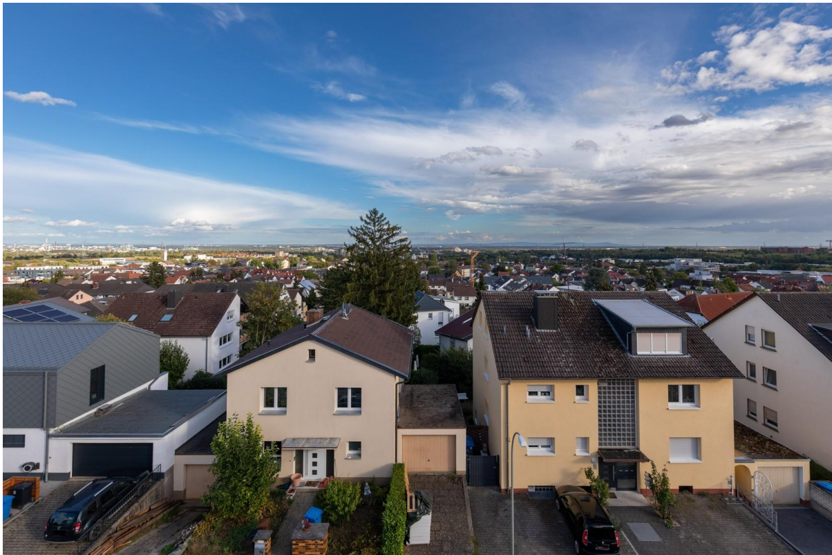
Ausblick aus dem Wohnzimmer