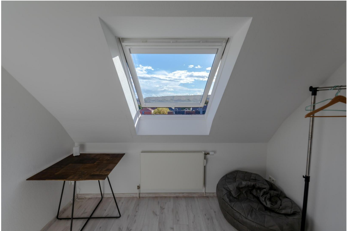
Ein besonderer Moment