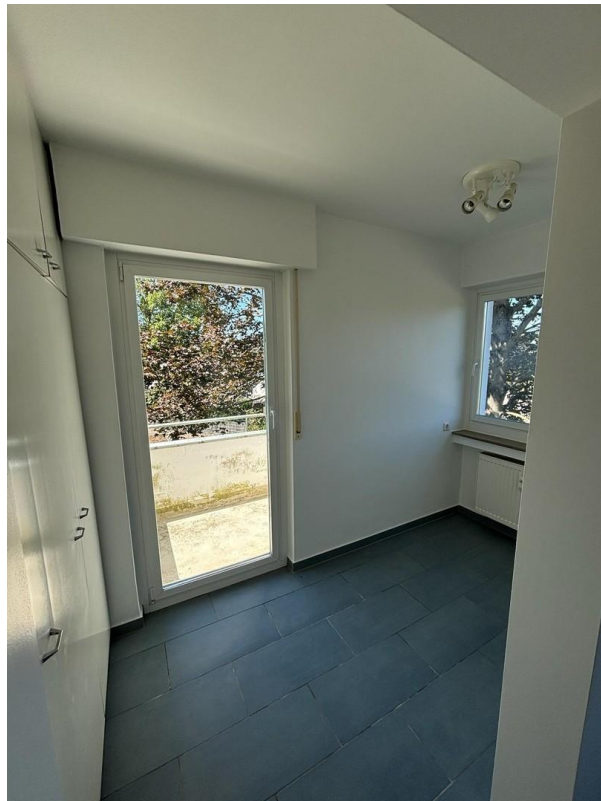
Hauswirtschaftsraum mit Balkon