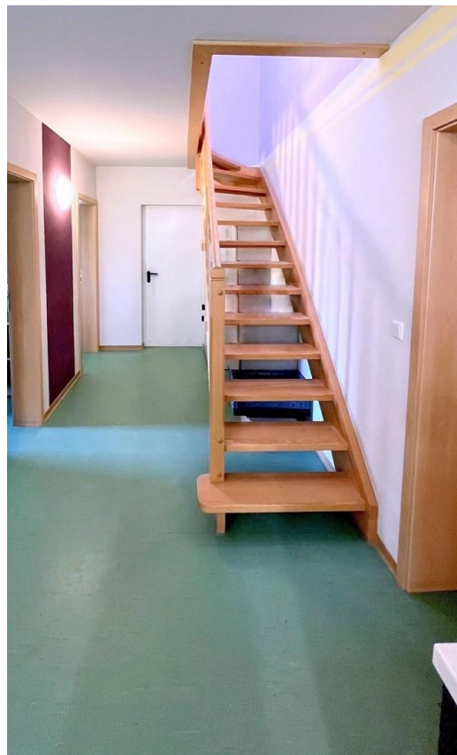
Treppe zur Galerie