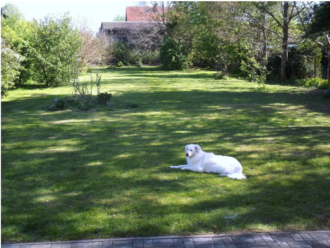
Blick in den Garten