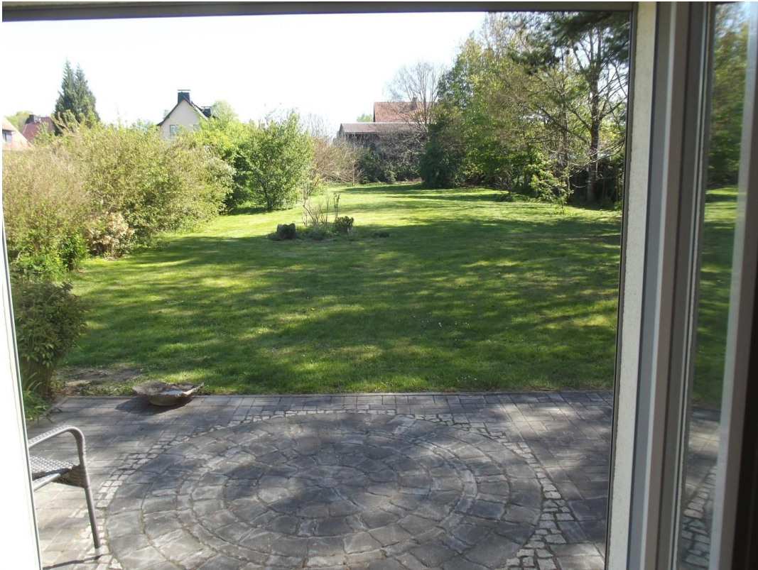
Terrasse, dekorativ gestaltet