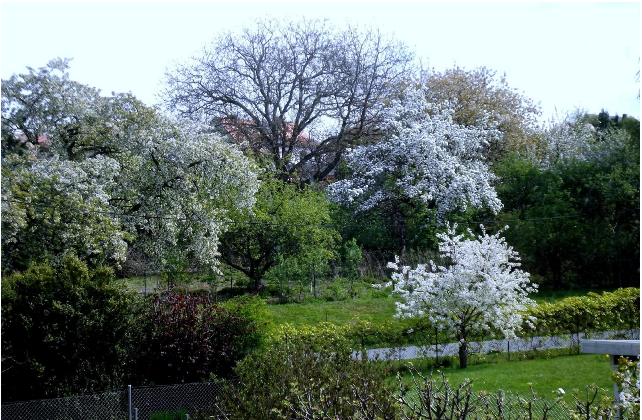
Frühling im Garten