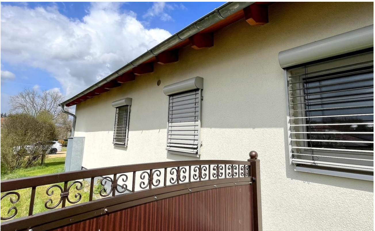
Gartentor / Seitenansicht