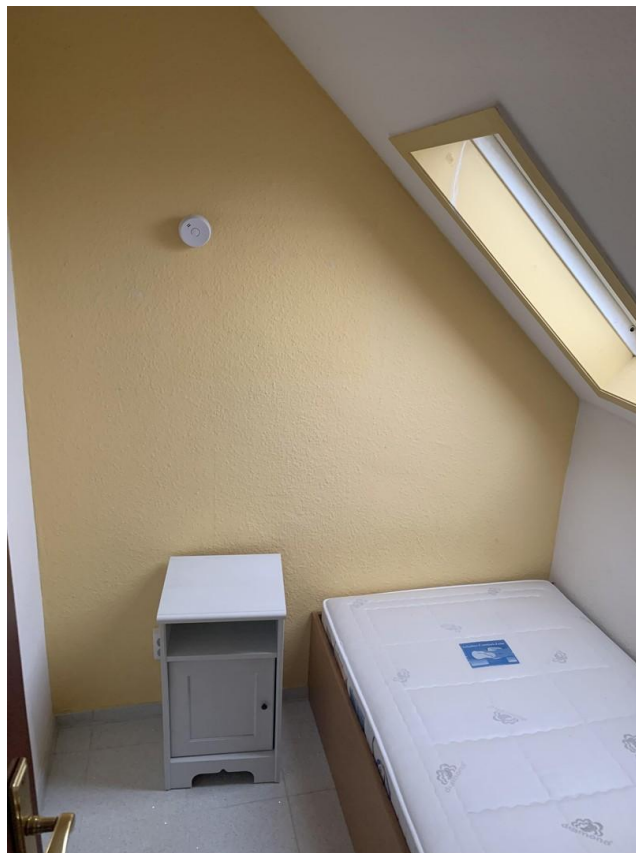
Schlafkammer mit Einzelbett