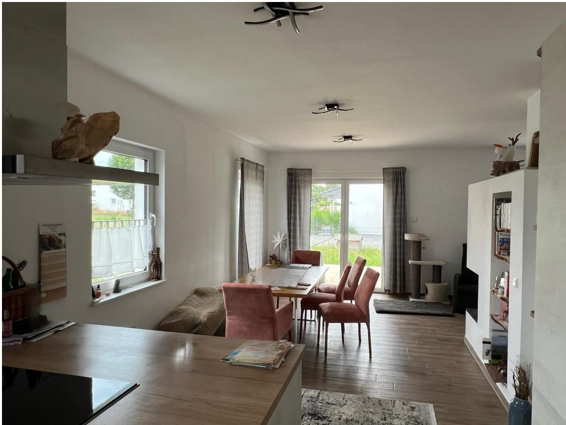
Wohn und Essbereich