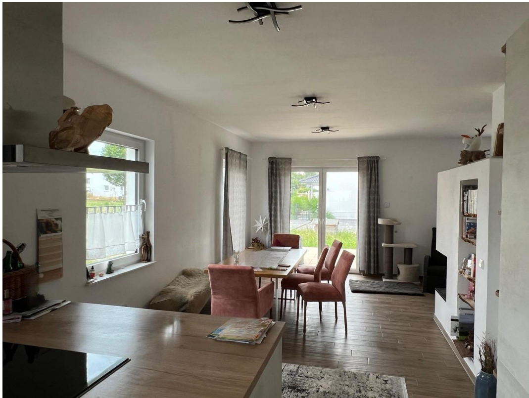
Wohn und Essbereich