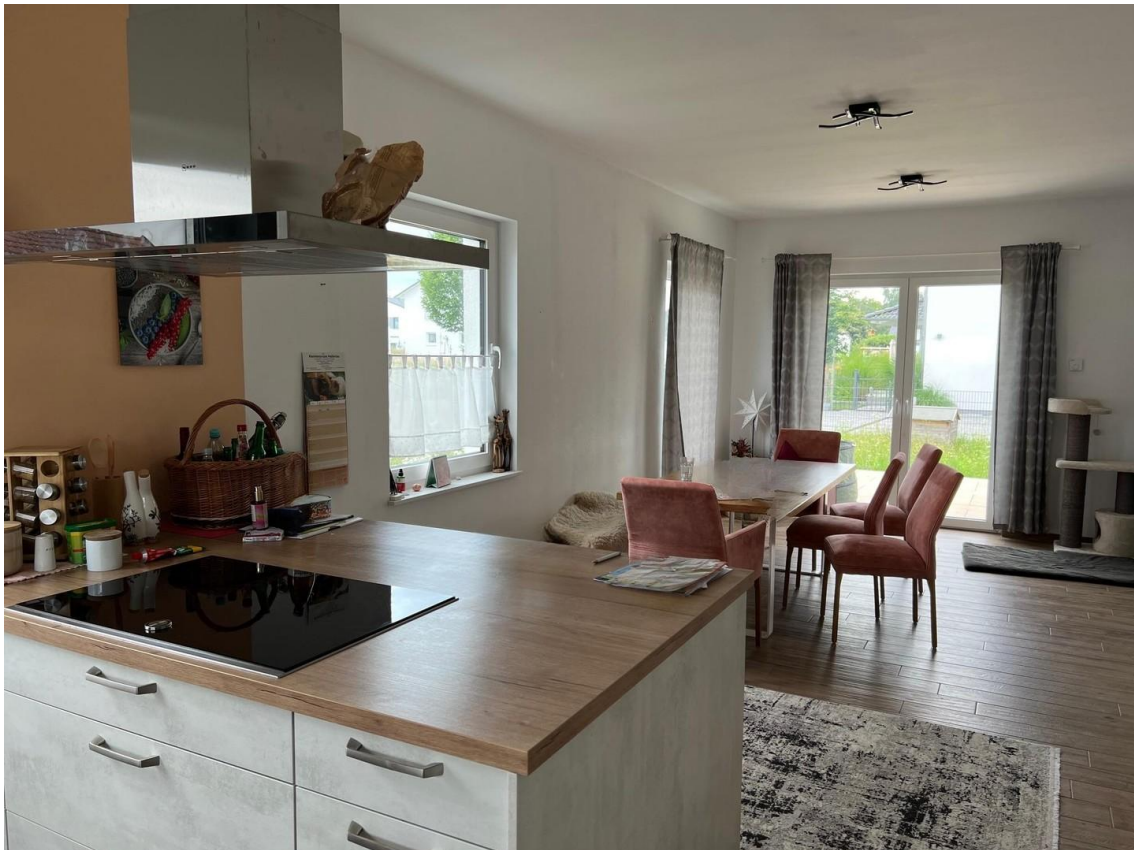
Wohn und Essbereich