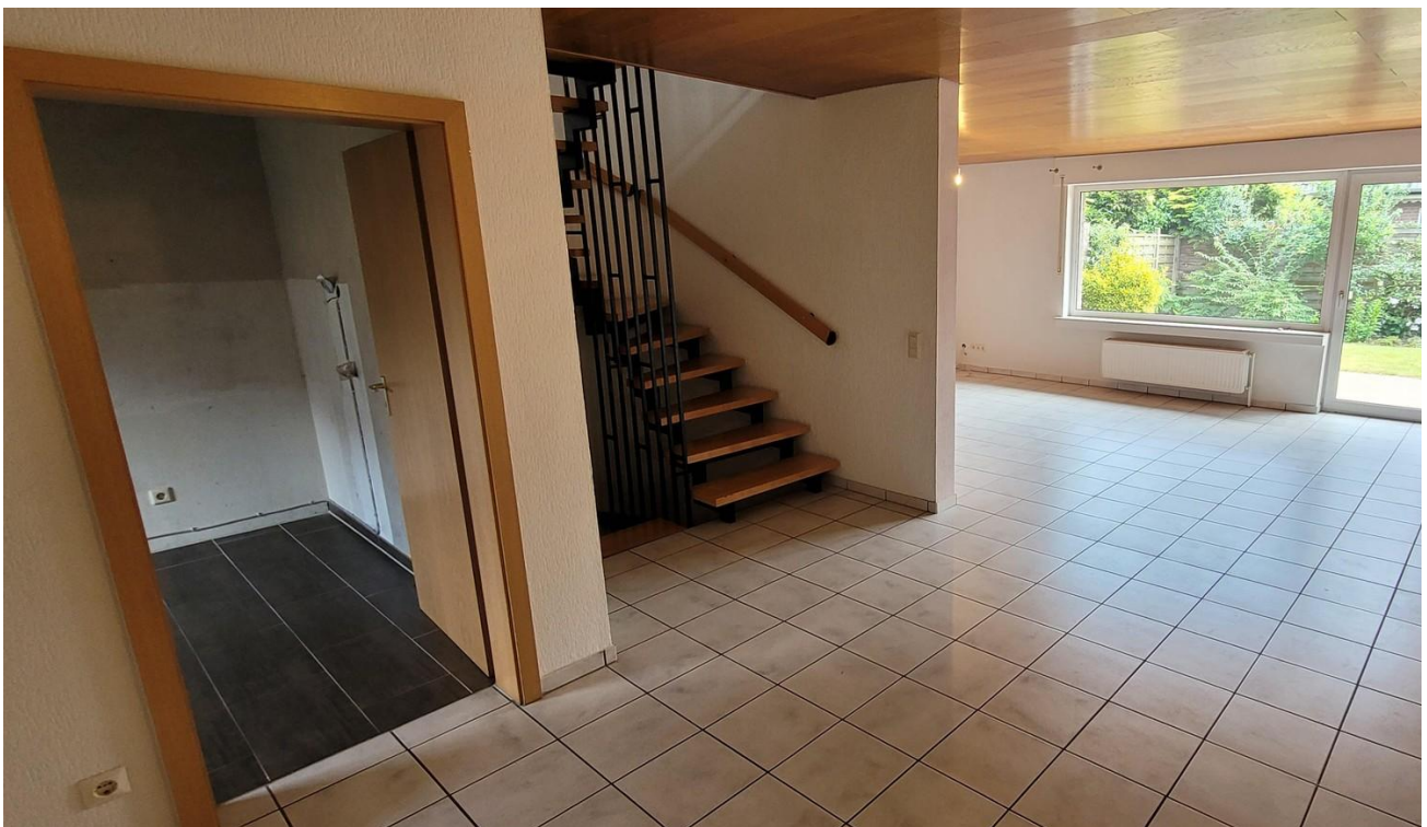
Erdgeschoss mit Treppenhaus