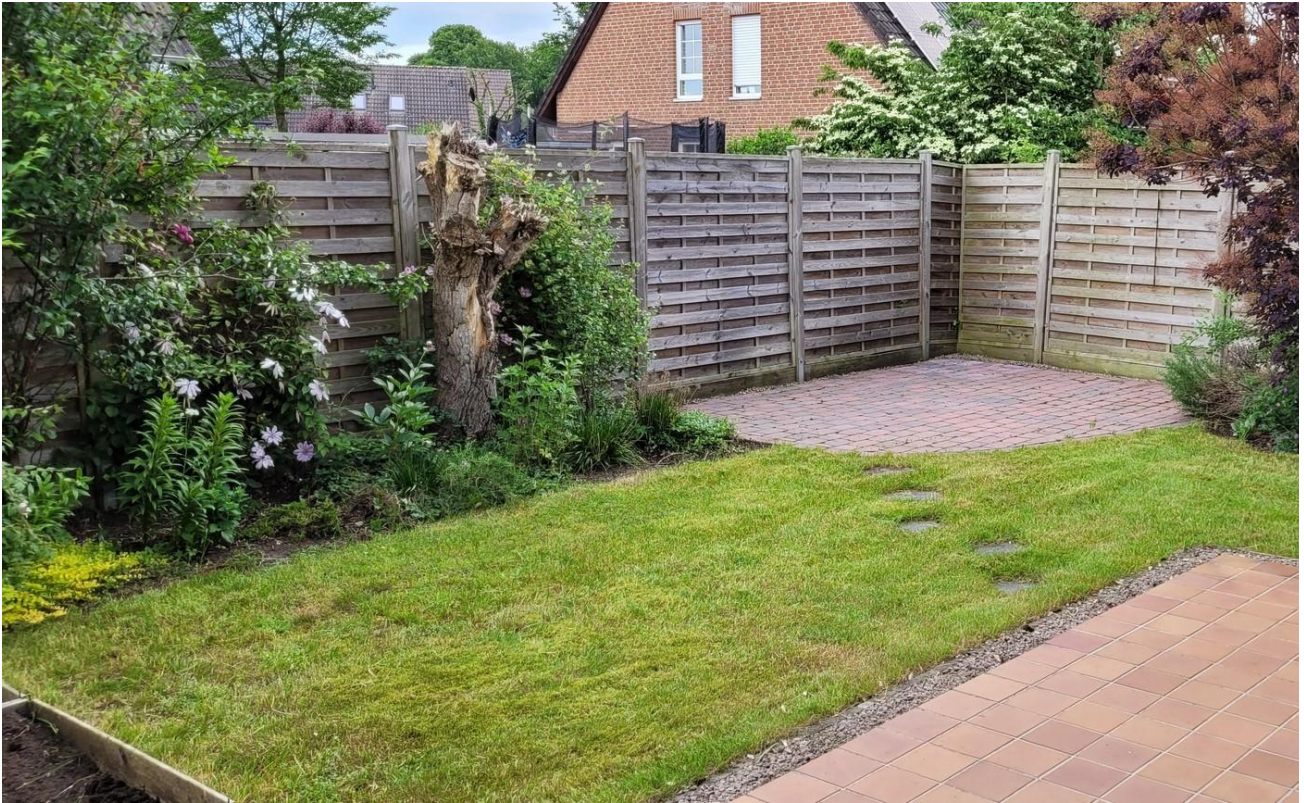
Garten mit Terrassen