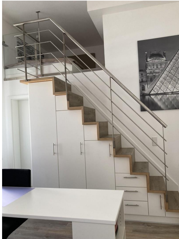
Treppe zum Schlafbereich