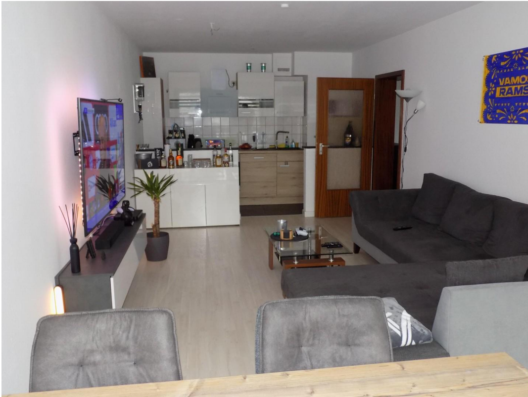
Wohnraum mit Küche