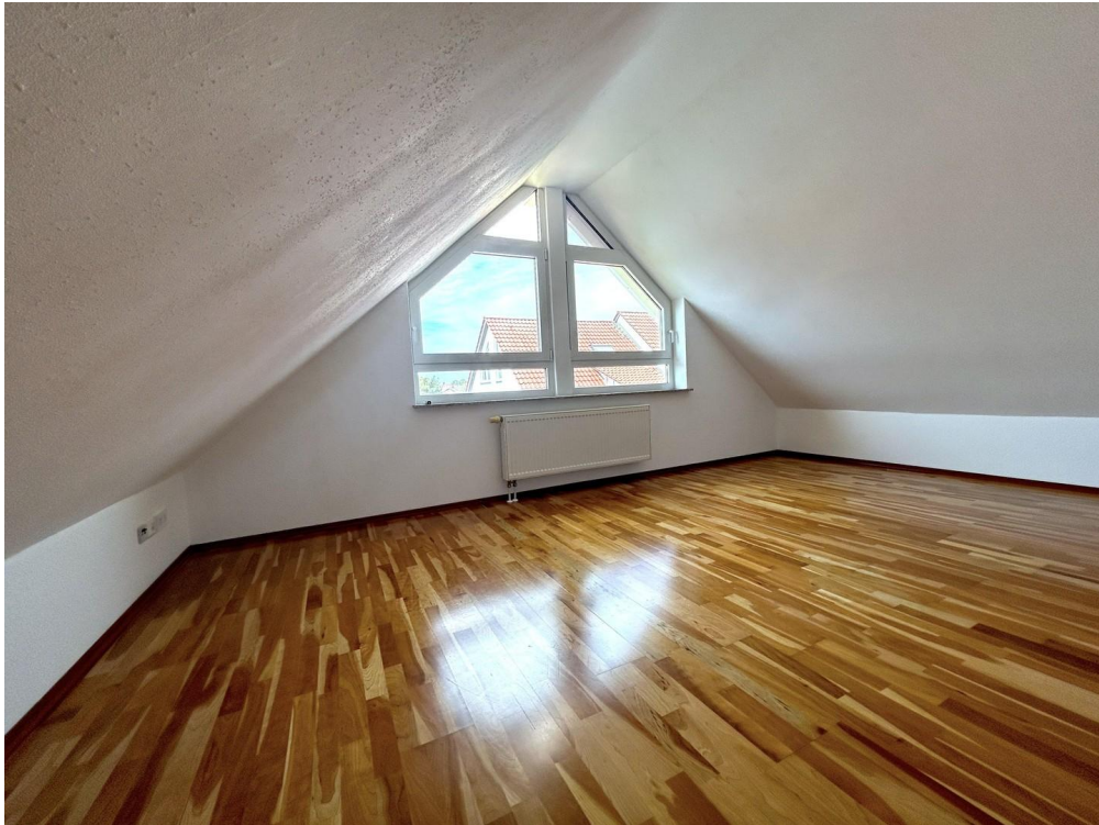
DG-Zimmer mit Einbauschränk