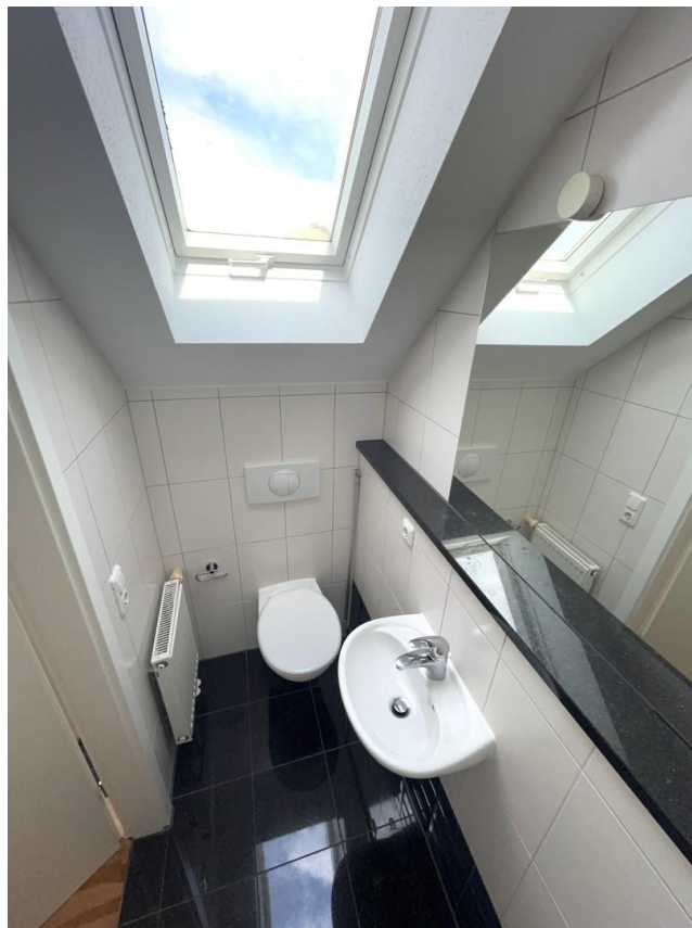
Duschbad im 2. DG