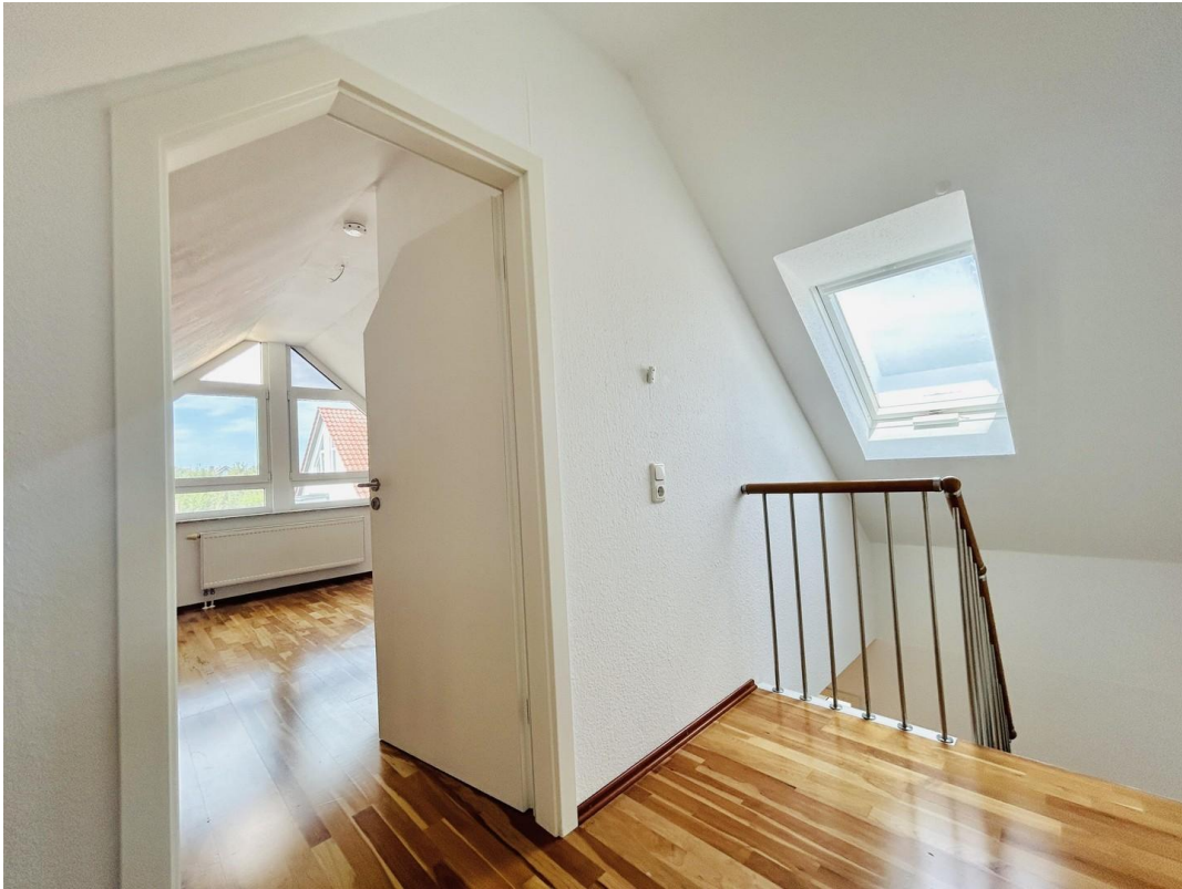
Zugang ins DG Zimmer