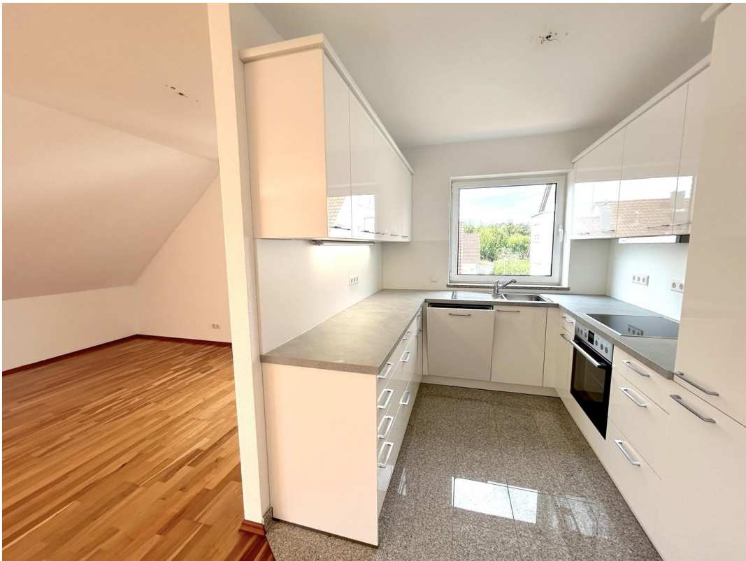
Kochen und Essen