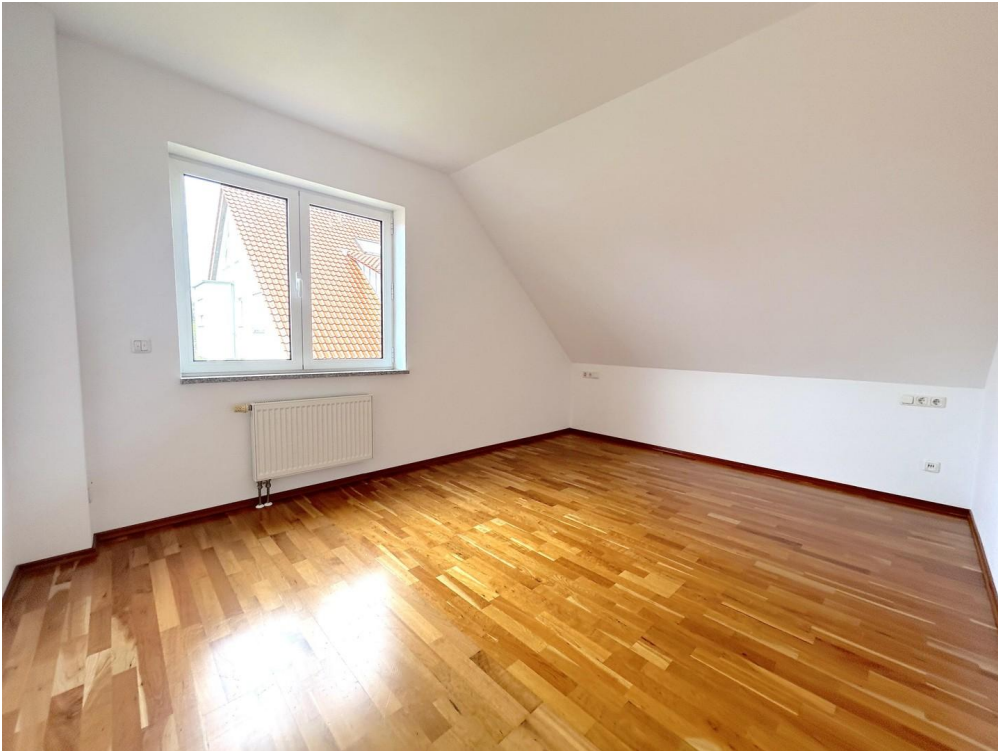
Schlafzimmer mit Parkett