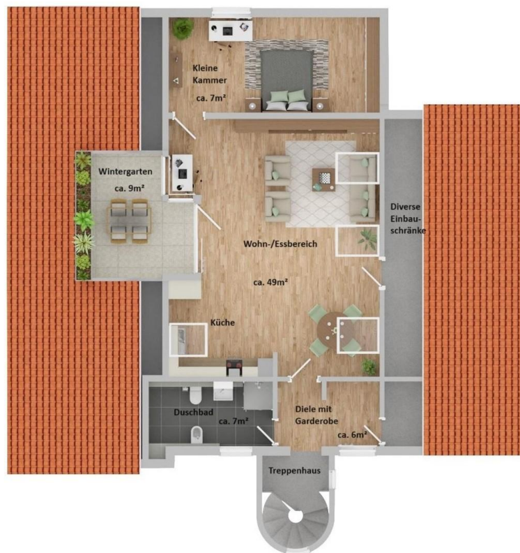
Grundriss DG - ca. 78qm Wfl.