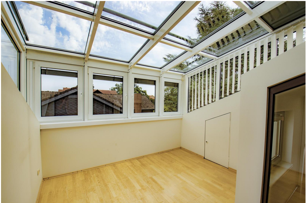
Wintergarten im DG