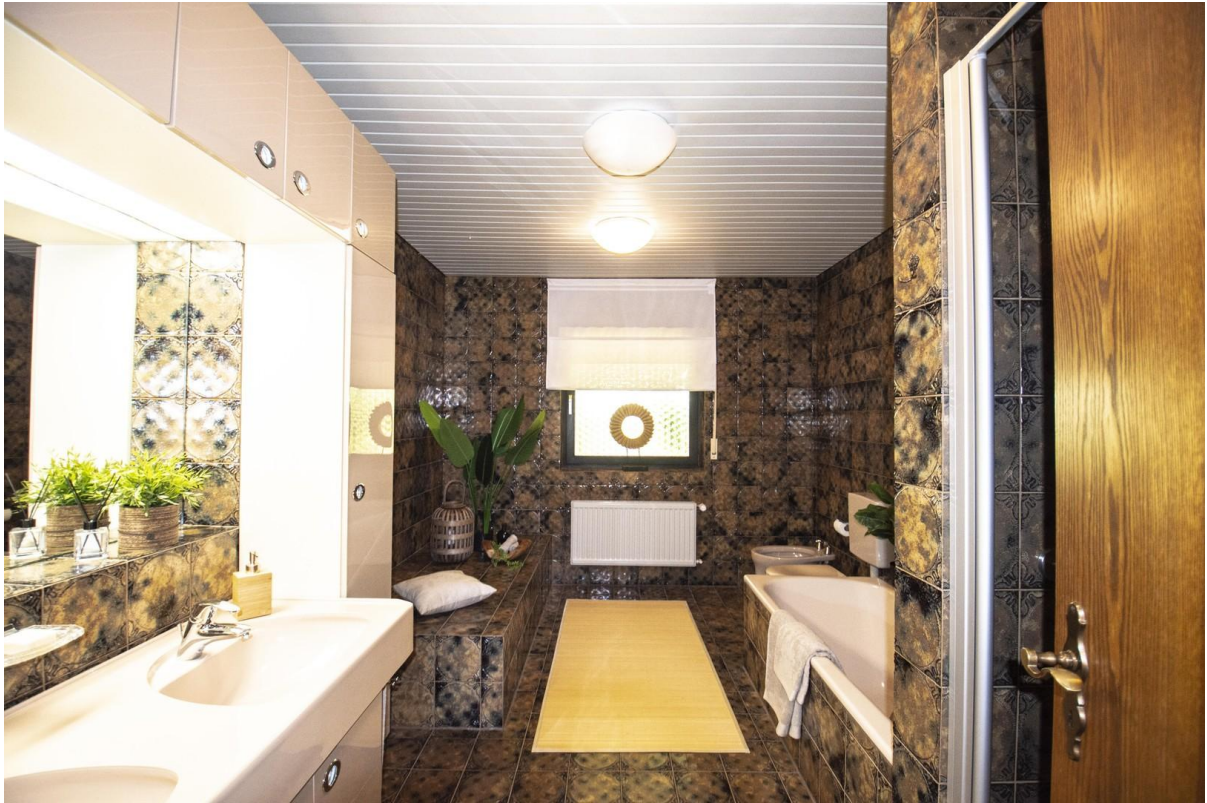
Vollbad im EG