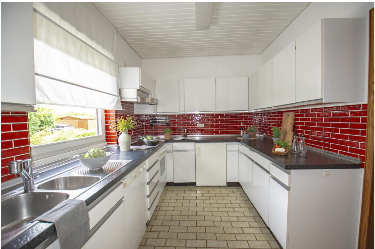
Küche im EG