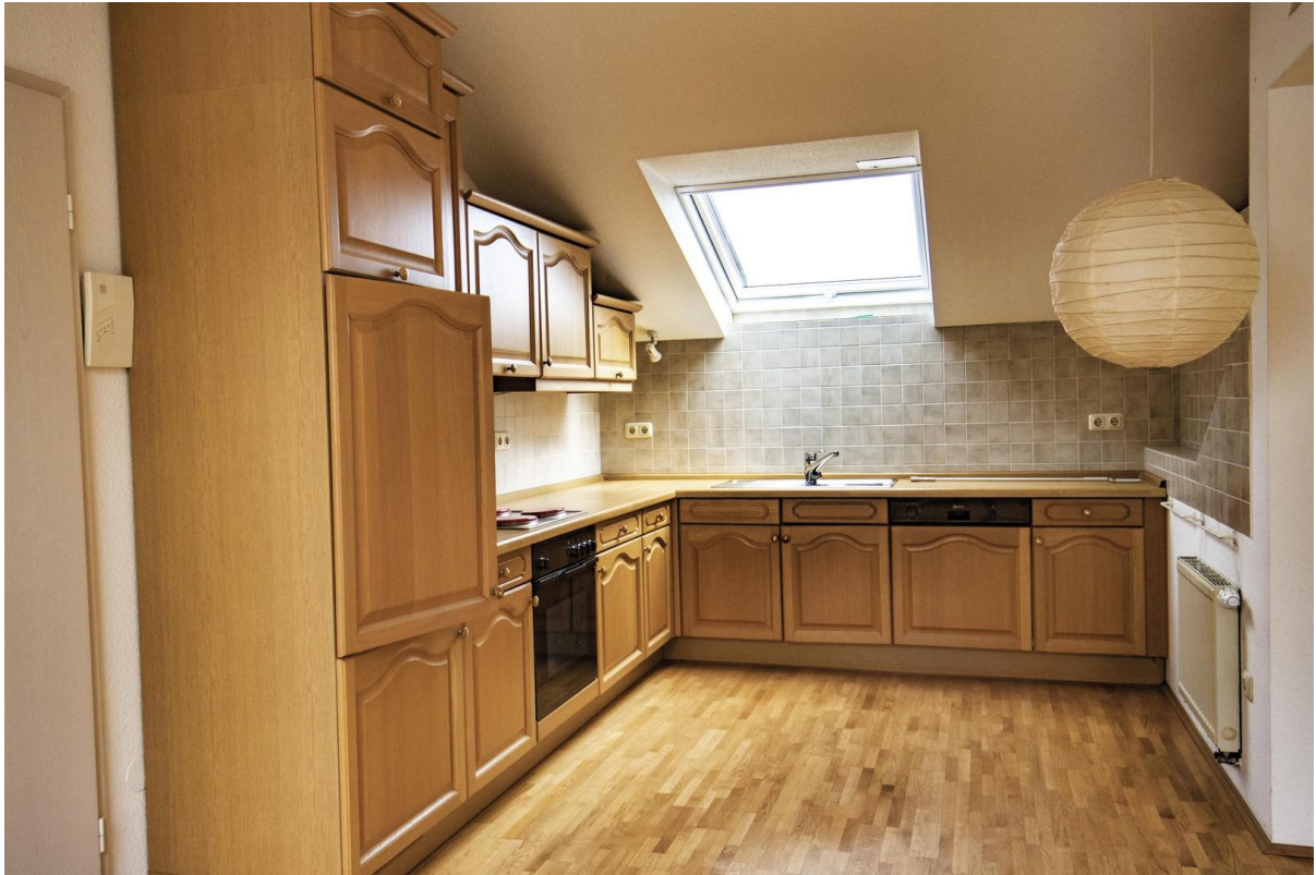
Küche im DG