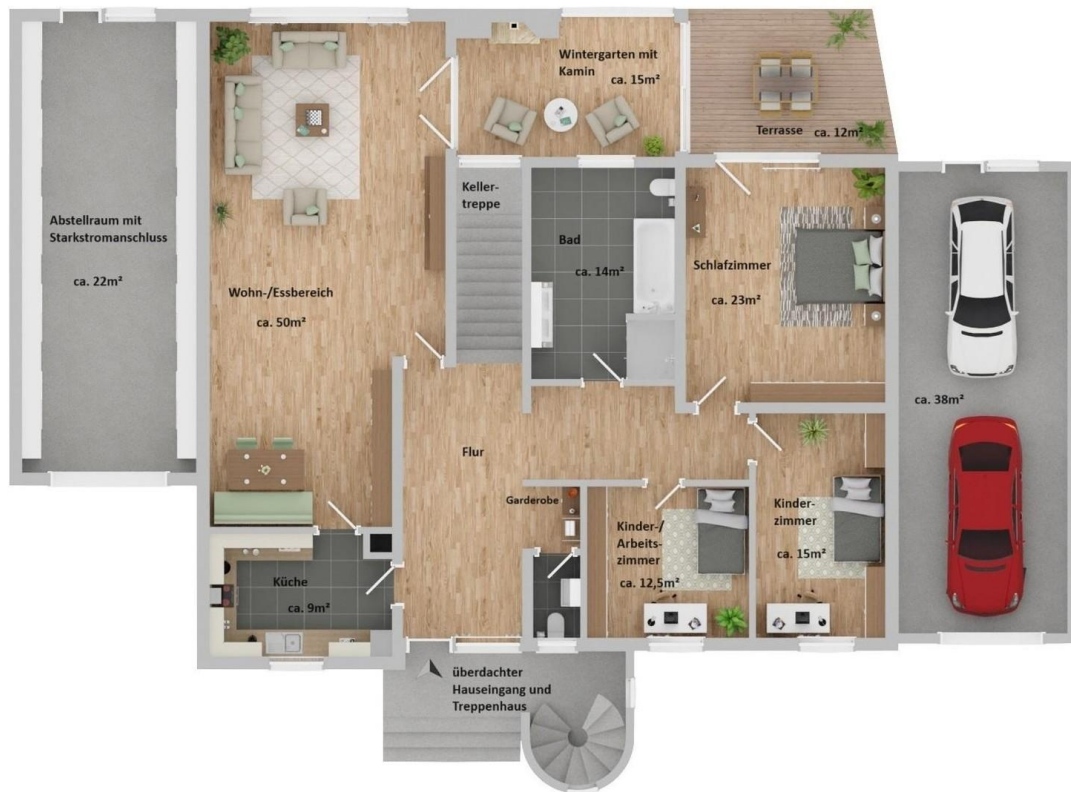
Grundriss EG - ca. 167qm Wfl.