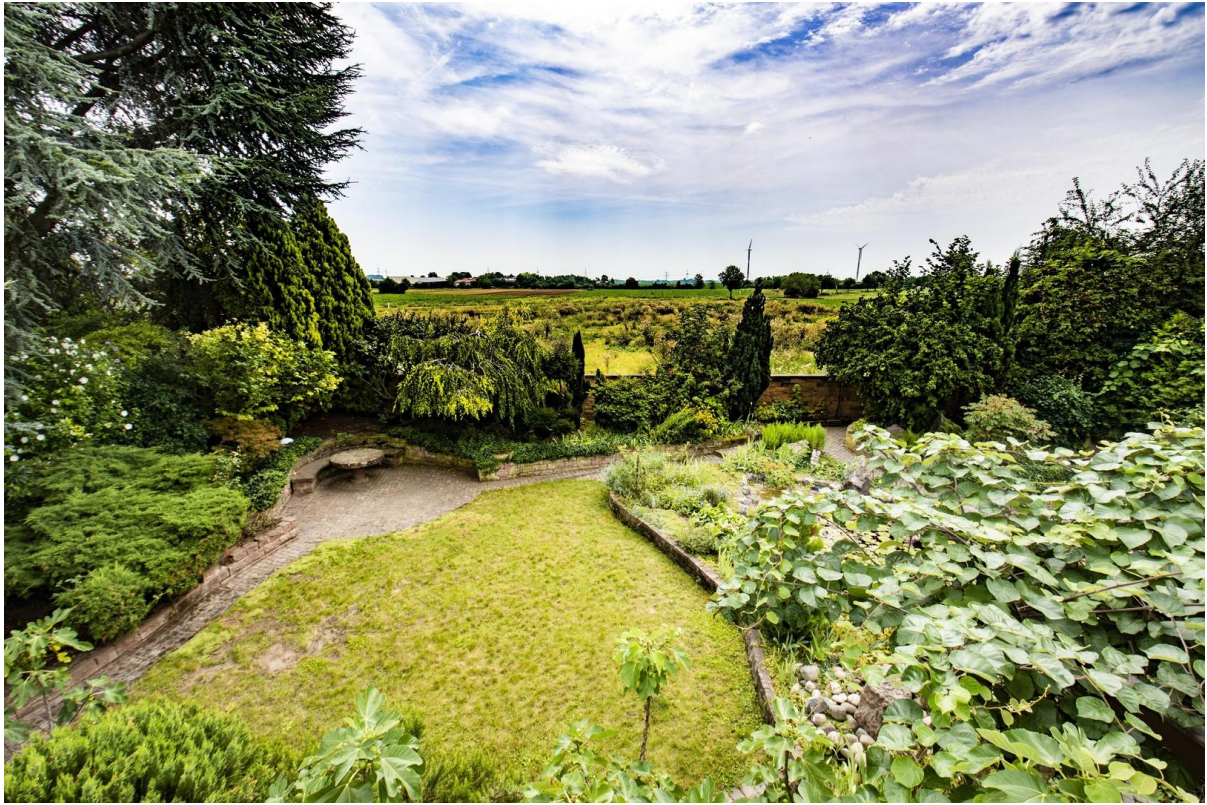
Weitblick aus dem DG