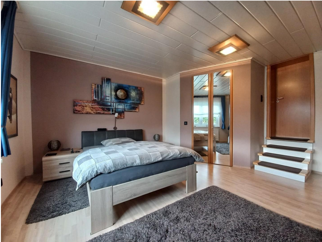
Schlafzimmer EG Motiv 2