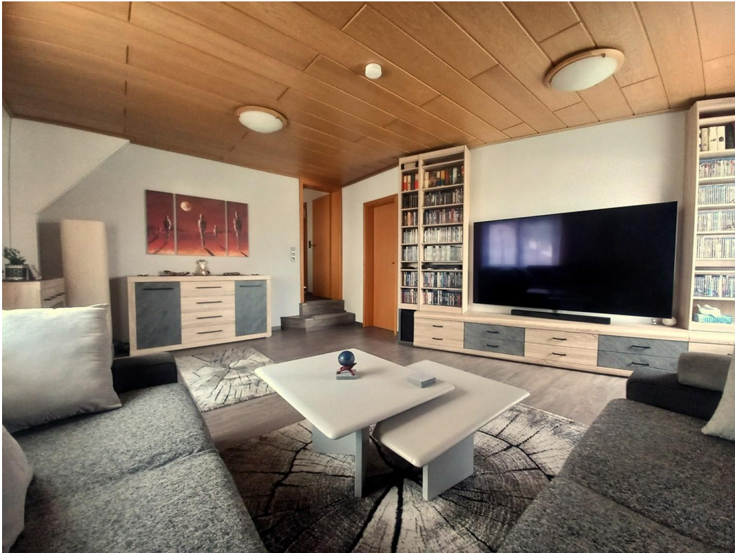
Wohnzimmer OG Motiv 1