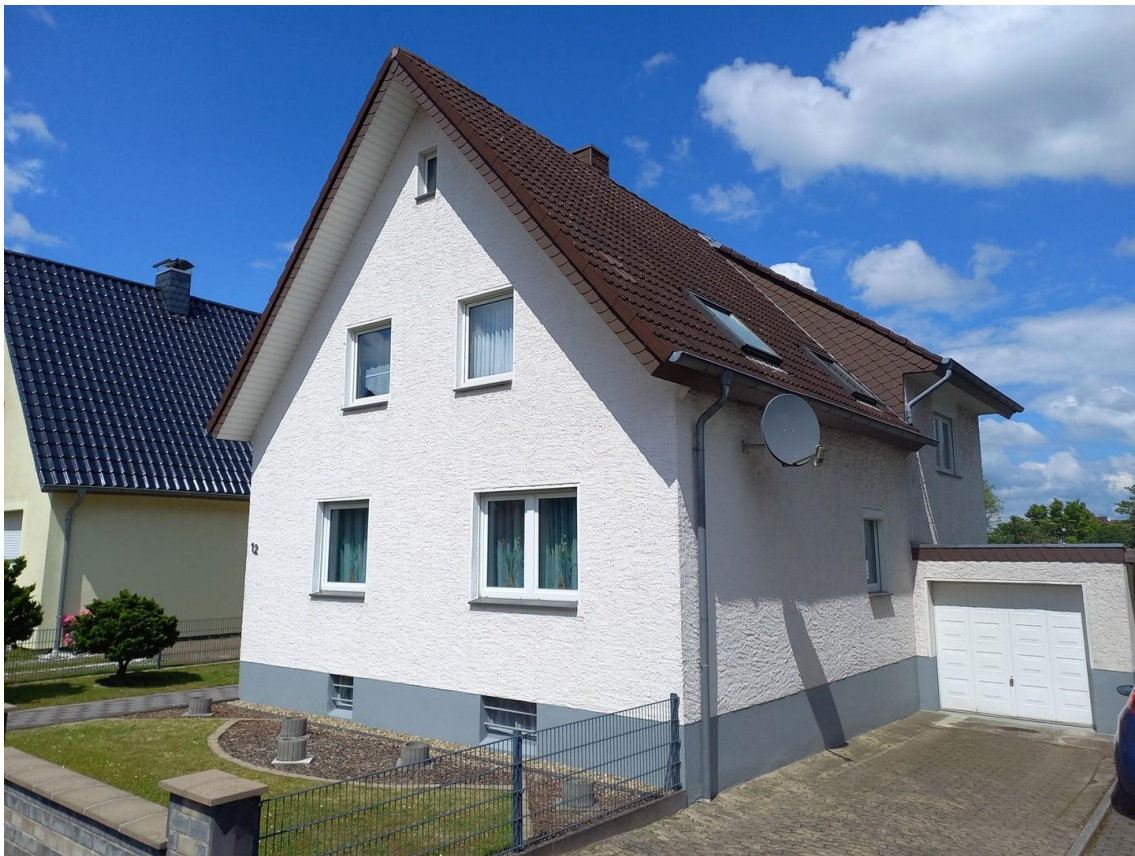
Hausansicht von rechts