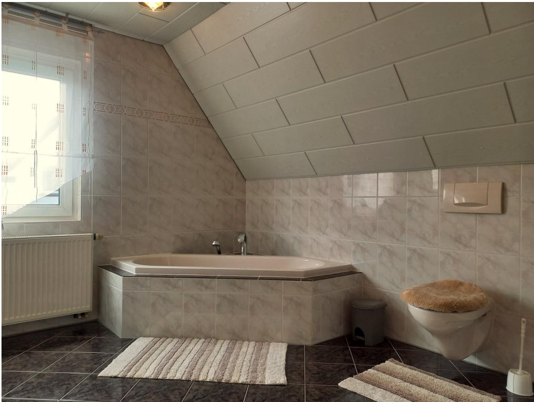
Bad OG Motiv 2