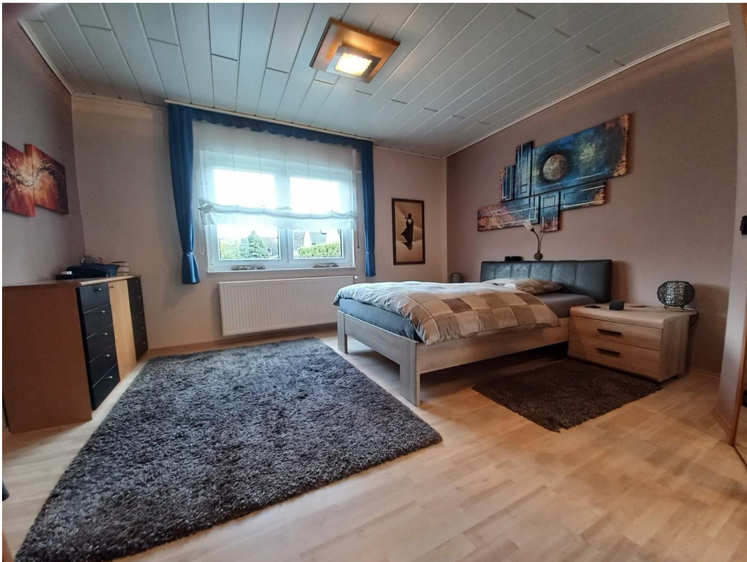
Schlafzimmer EG Motiv 1