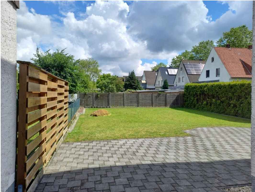
Blick zum Garten