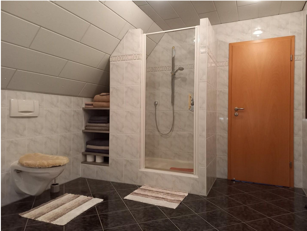
Bad OG Motiv 1