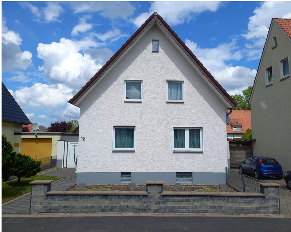
Hausansicht zur Straße