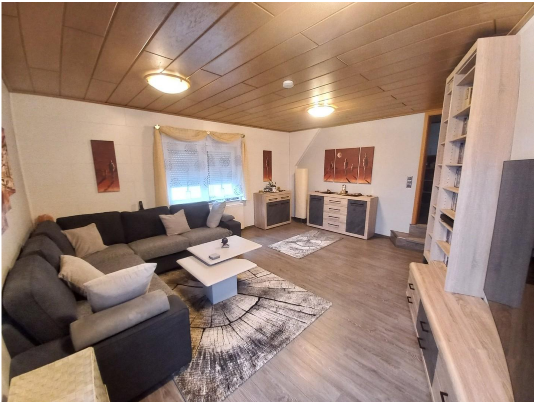
Wohnzimmer OG Motiv 2