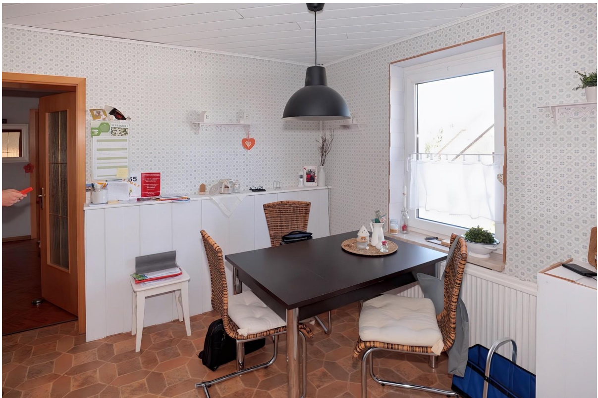
Küche - OG