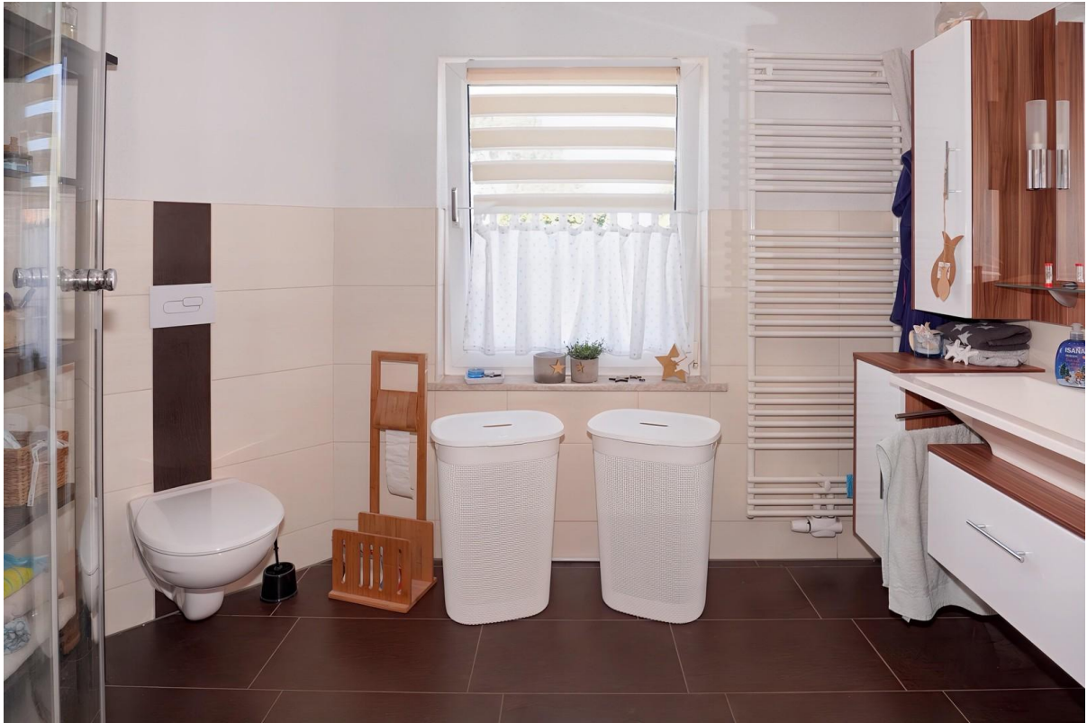
Bad mit Dusche - OG