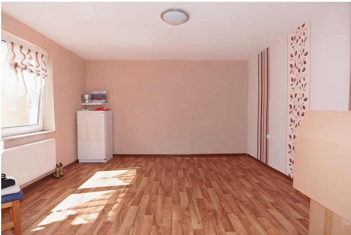
Zimmer - EG