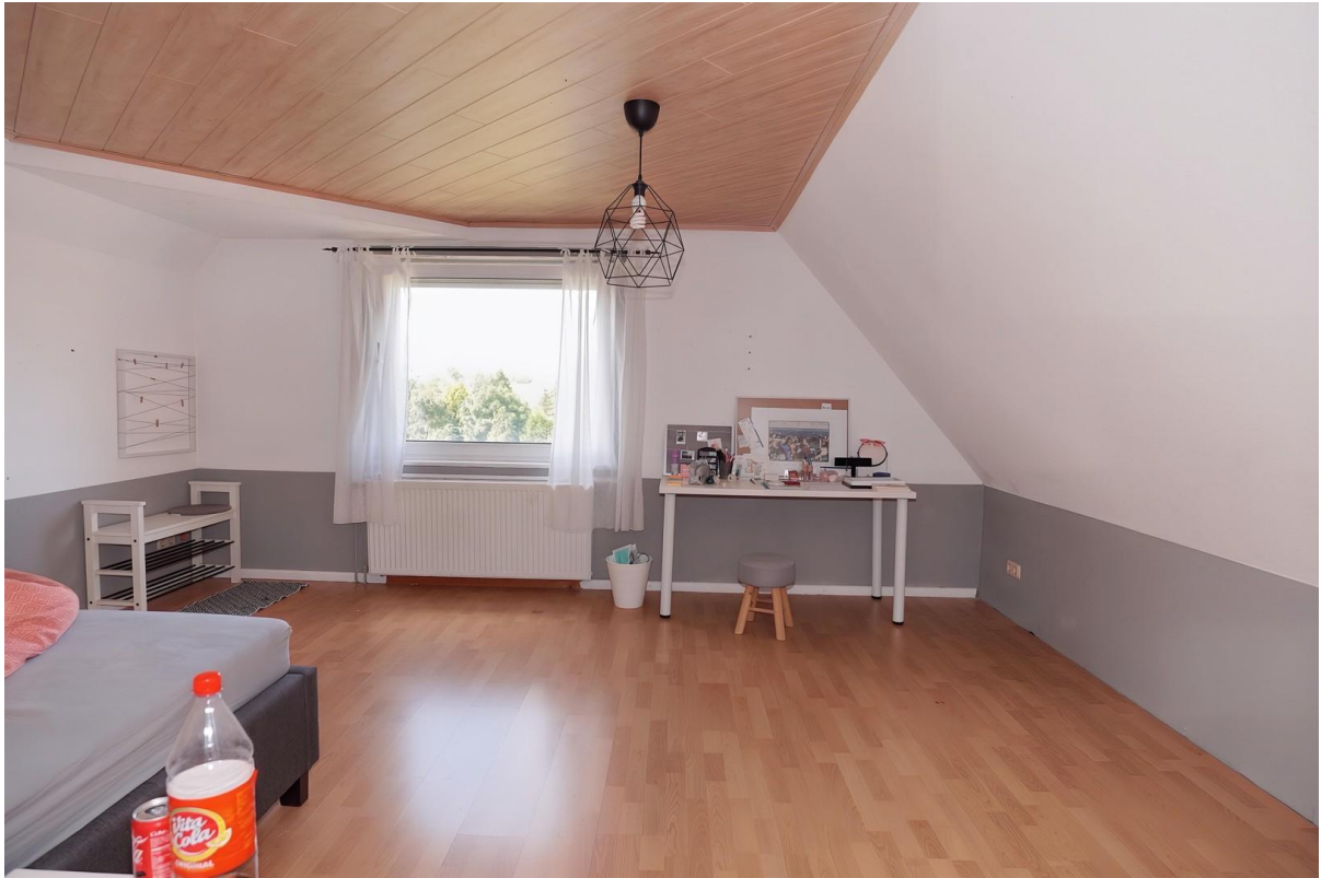
Wohnzimmer - DG