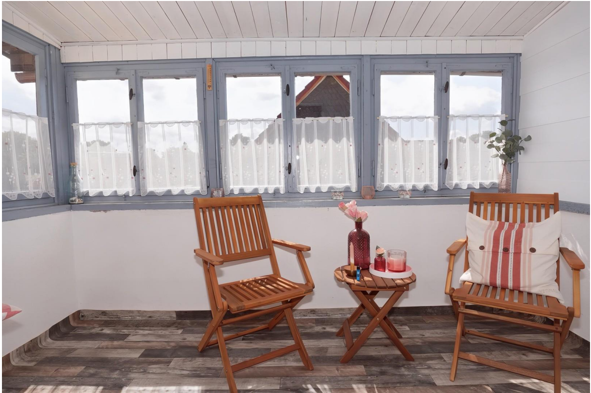
Wintergarten - OG