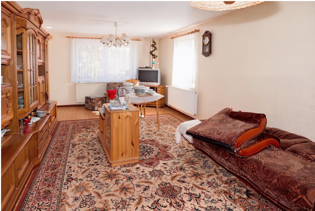
Wohnzimmer - EG