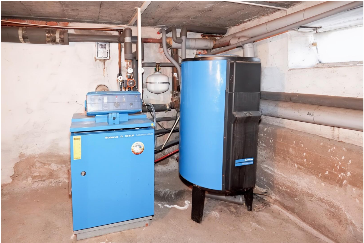
Heizungsanlage - KG