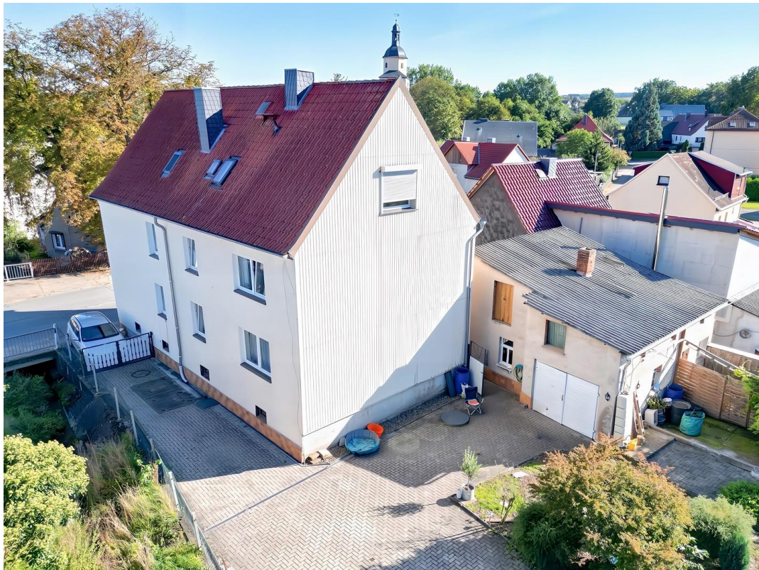
Hausansicht - Rückseite