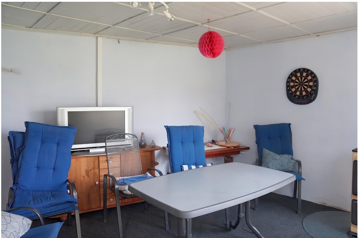
Gartenhaus - Innen