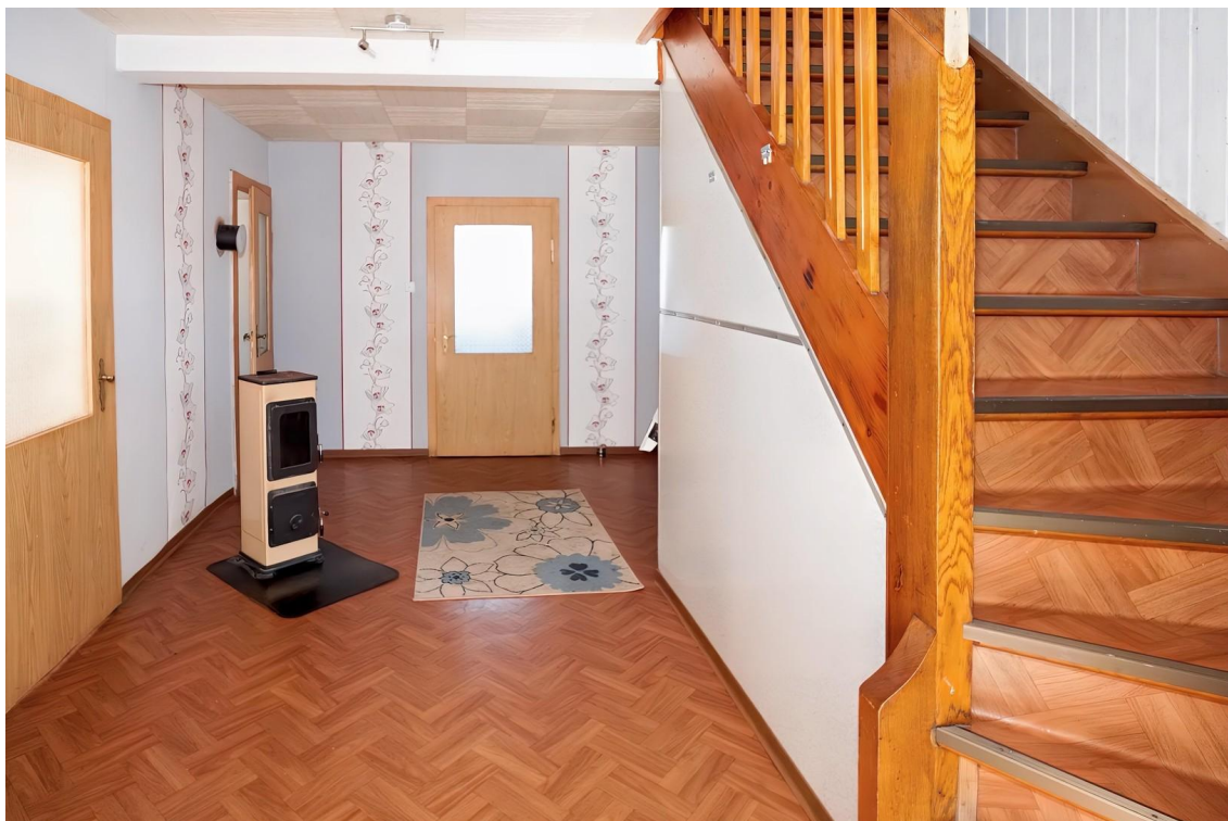
Hausflur - EG