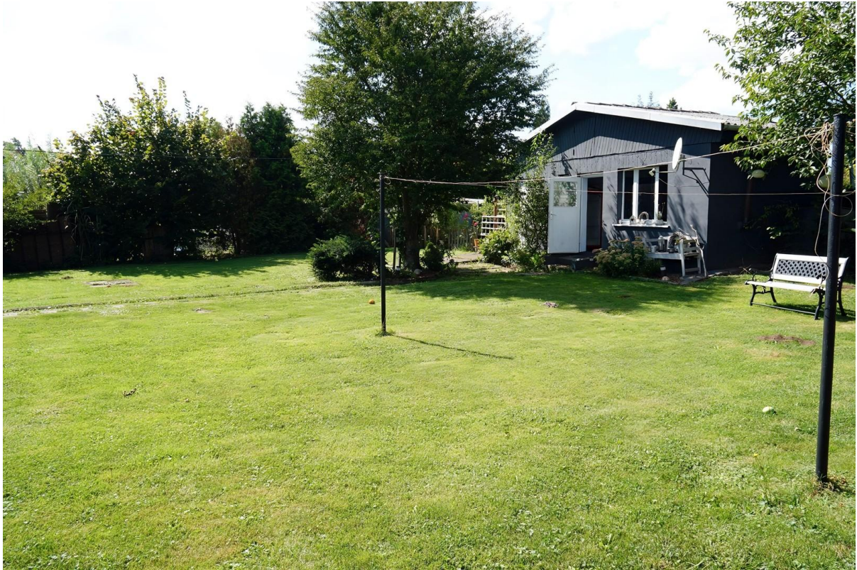
Blick zum Gartenhaus