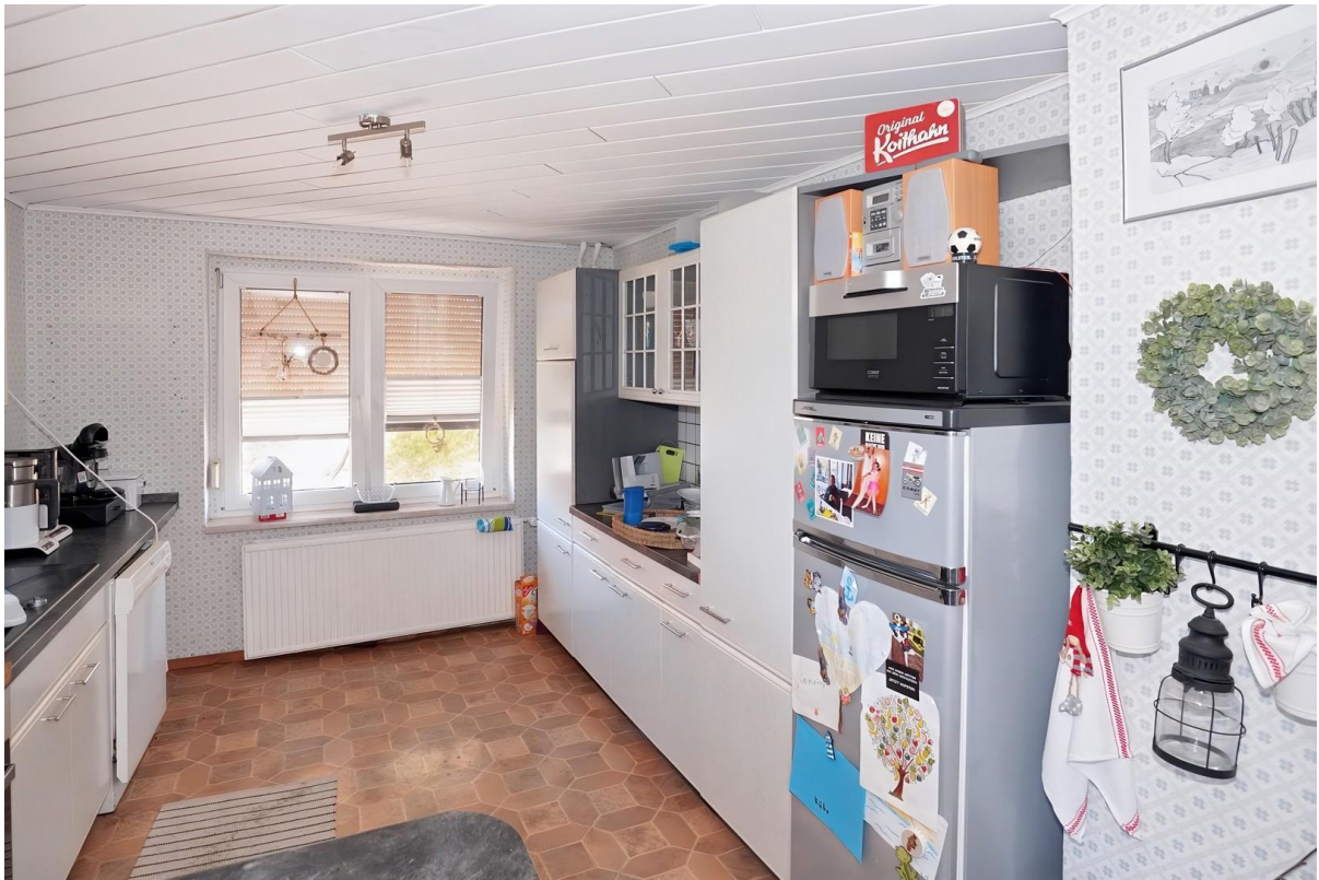
Küche - OG