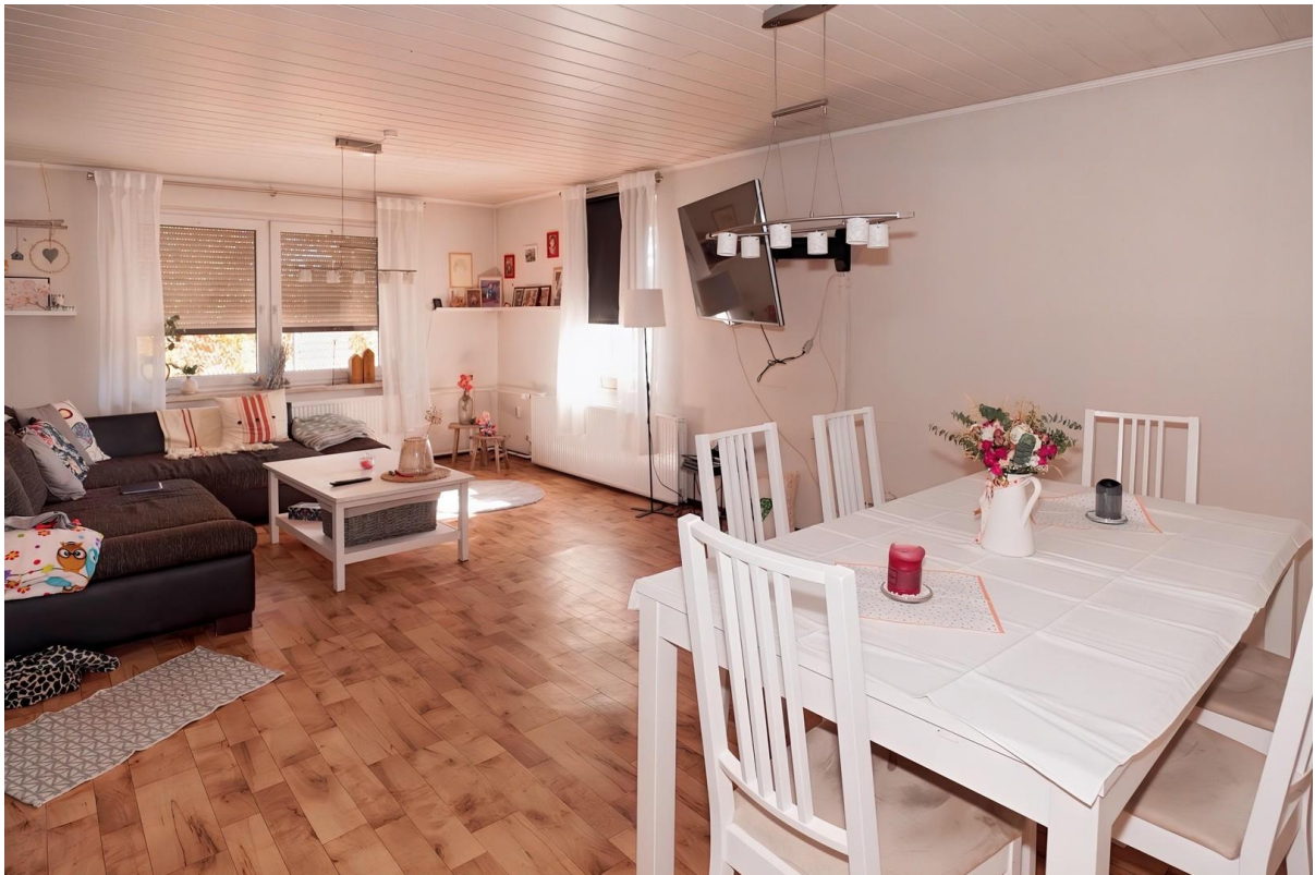
Wohnzimmer - OG