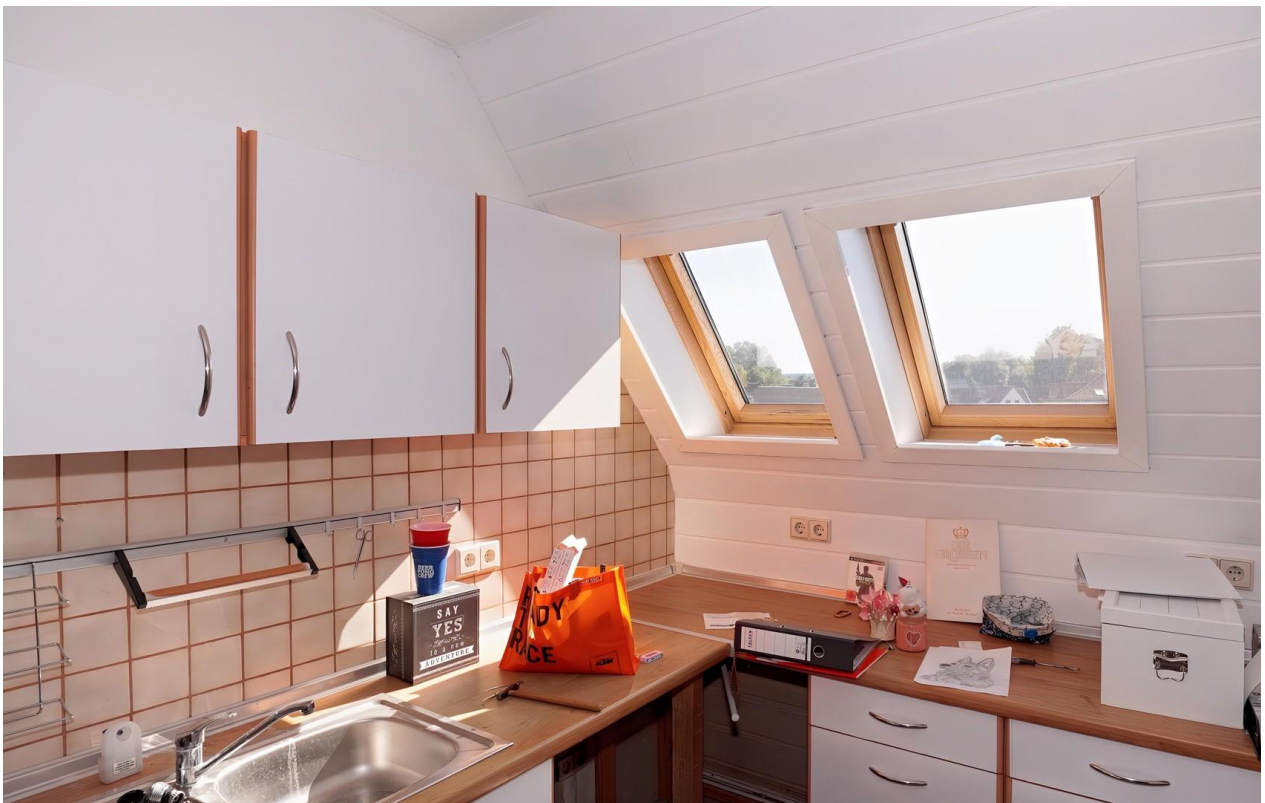
Küche - DG