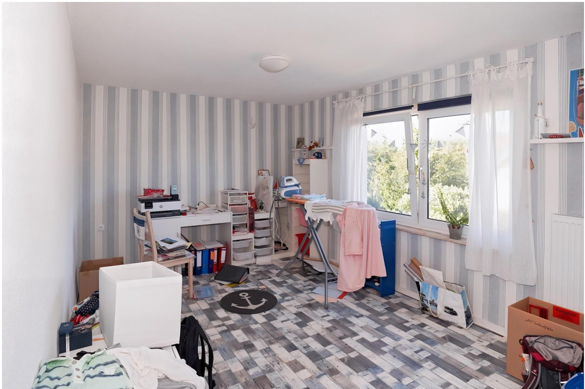
Zimmer - OG