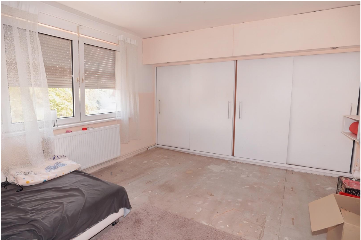
Schlafzimmer - DG