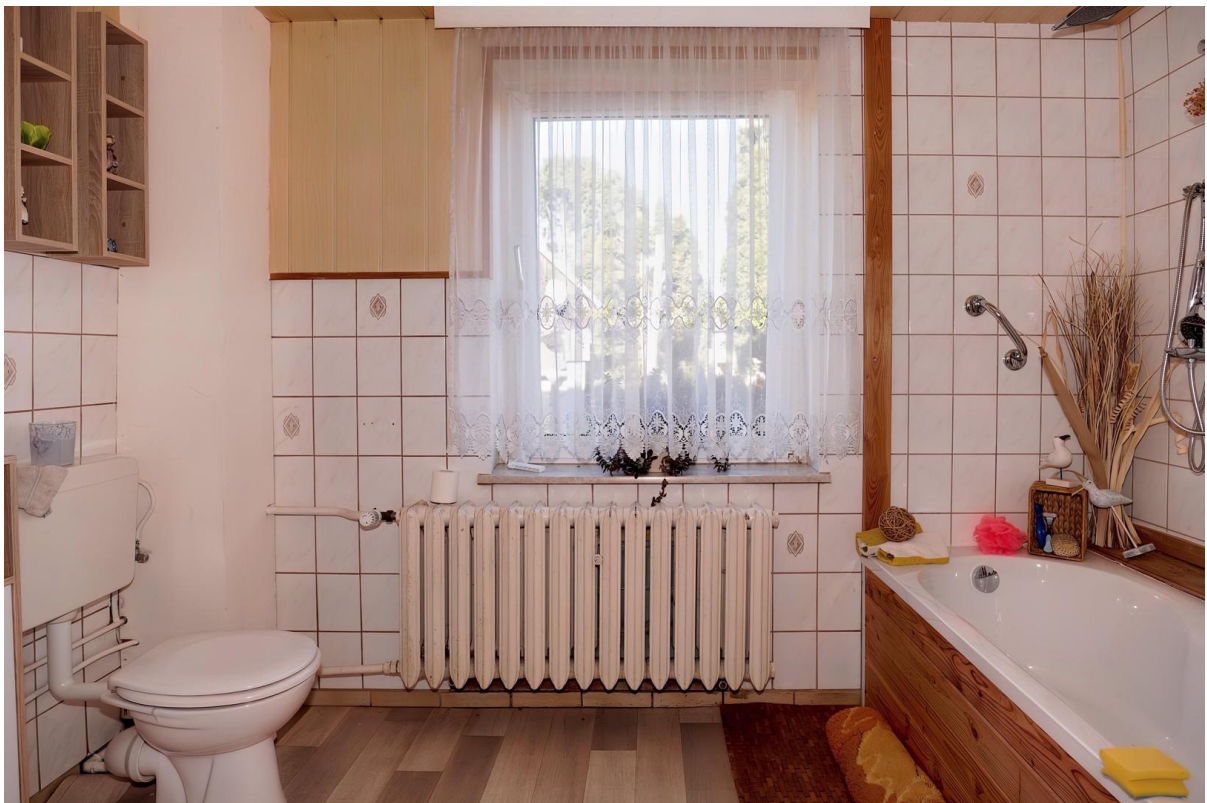
Bad mit Wanne - EG