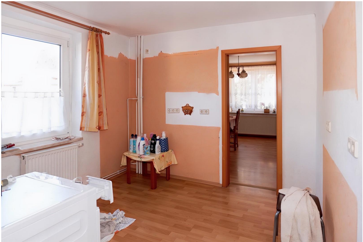
Küche mit sep. Esszimmer - EG