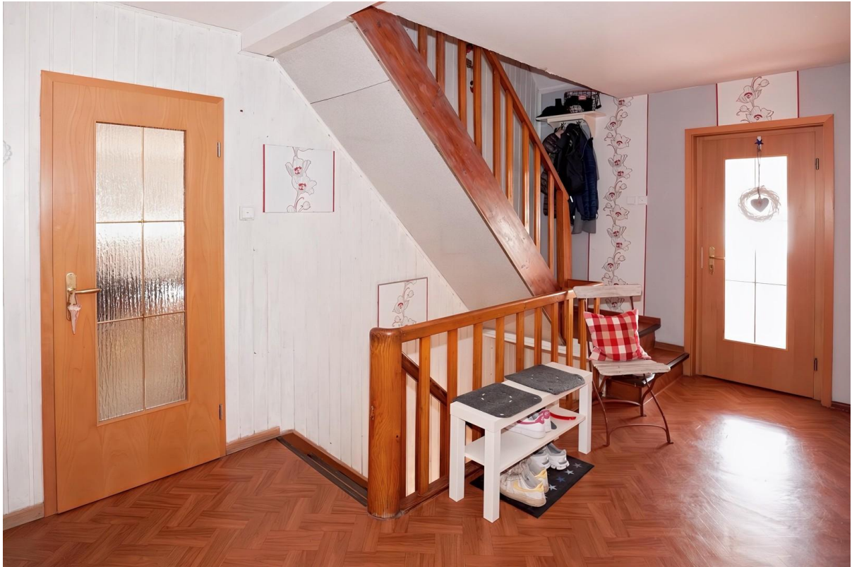
Hausflur - OG