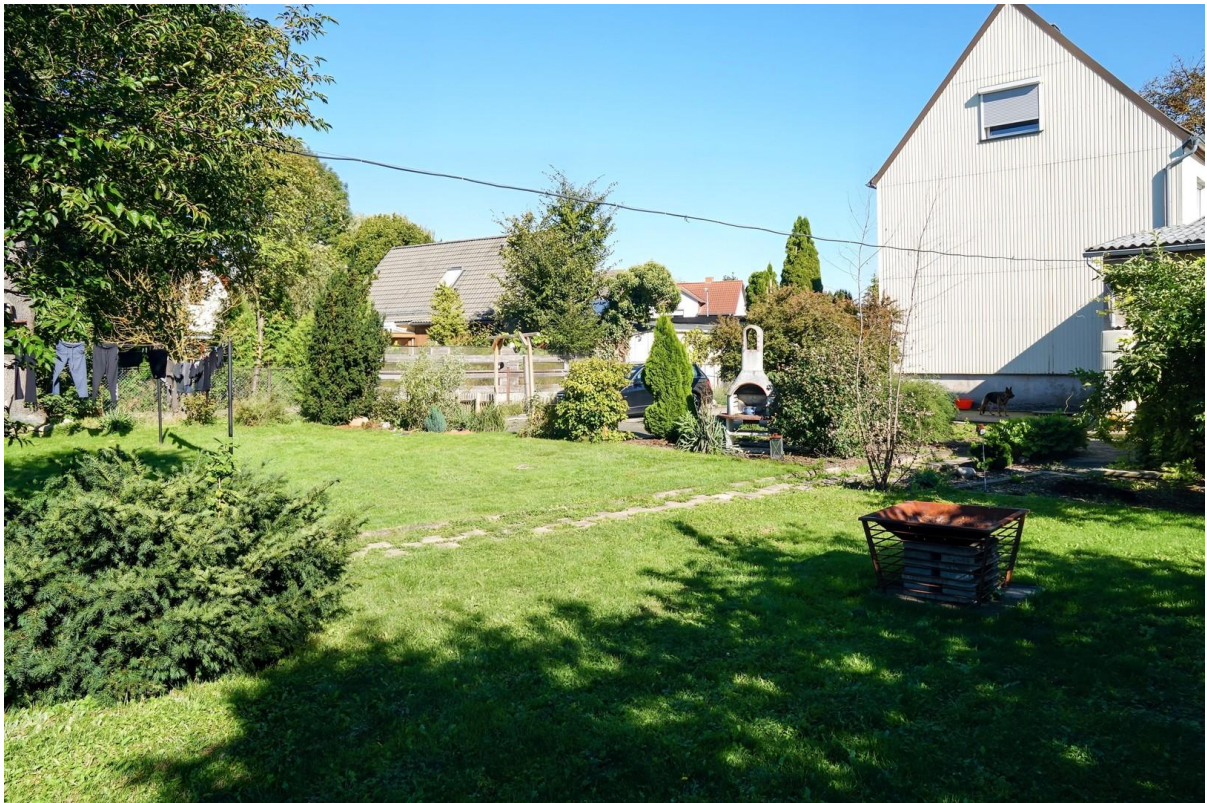
Blick zum Haus