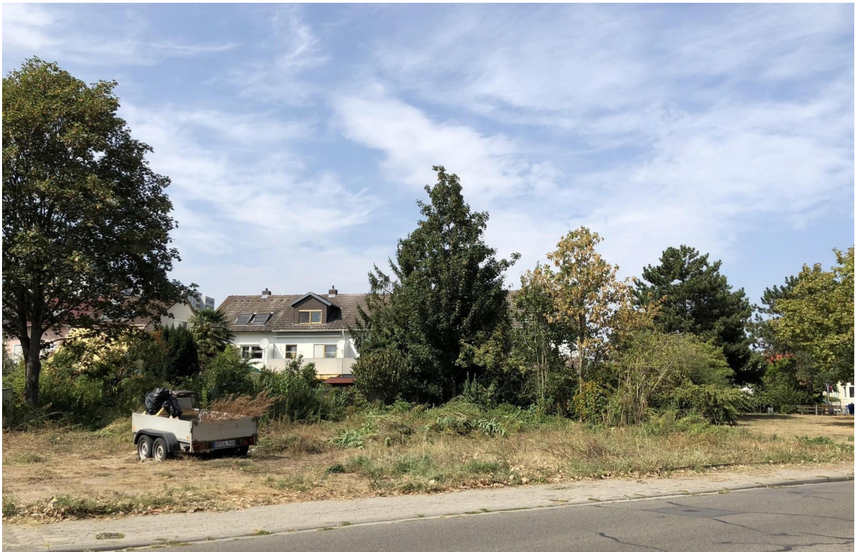
Ansicht von der Straße