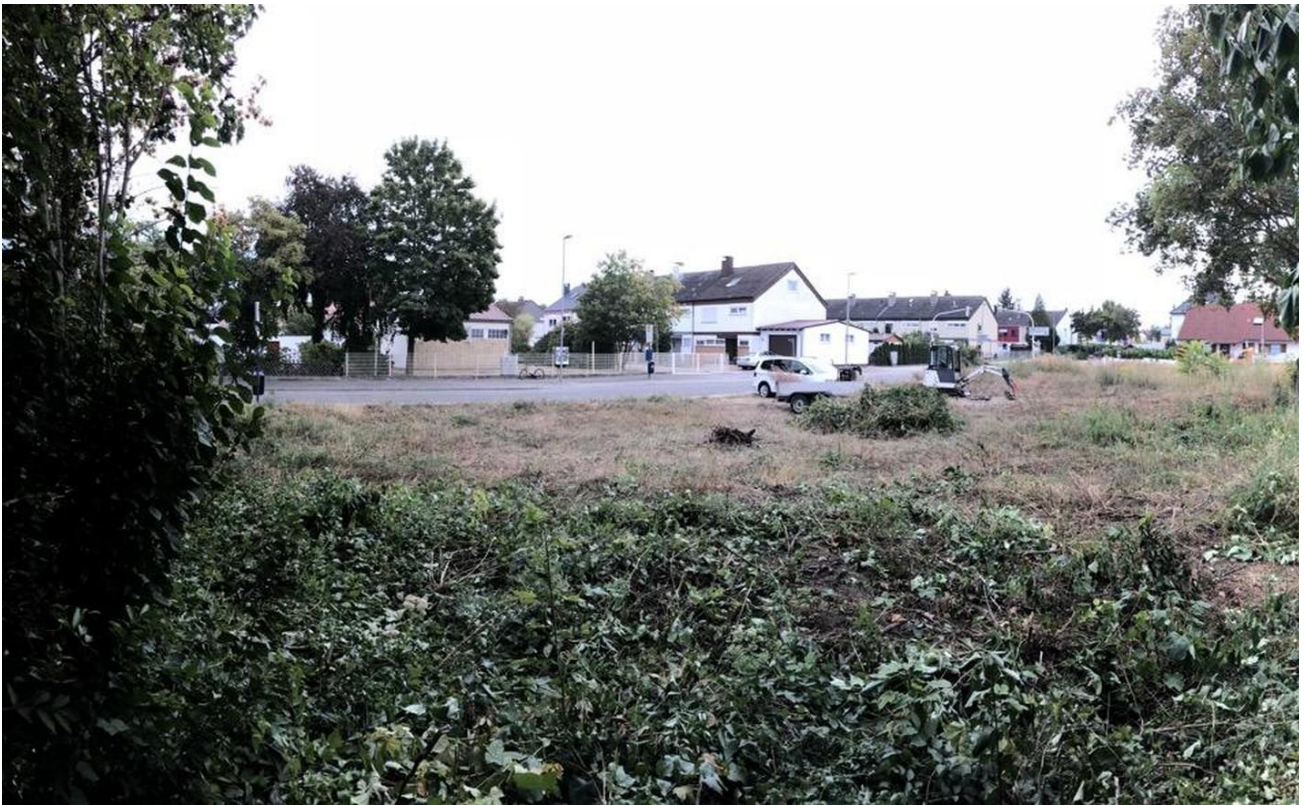
Blick aus Richtung Norden