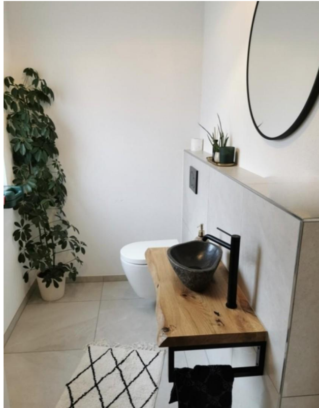
Musterhaus Gäste WC