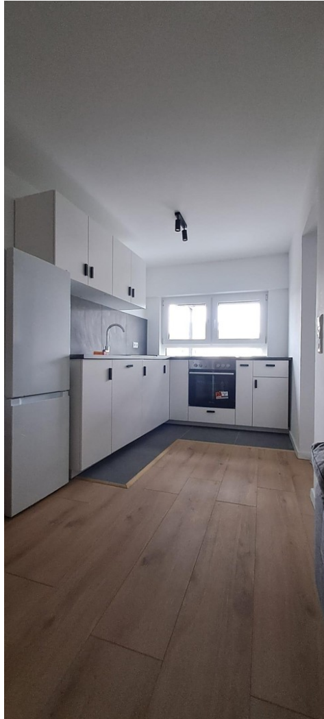
Küche (Beispiel aus gl. Haus)