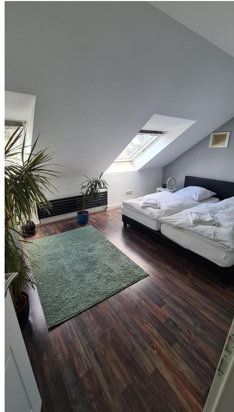
Raum 2 Dachgeschoss