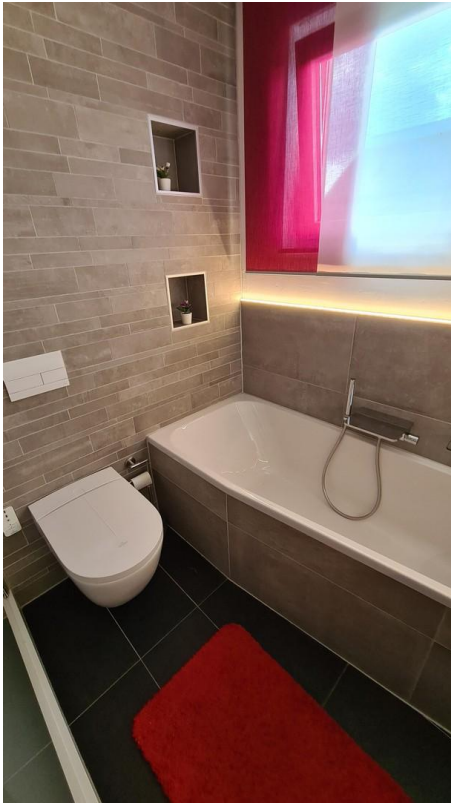
Bad OG WC & Wanne