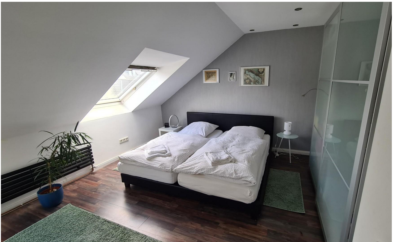
Raum 2 Dachgeschoss