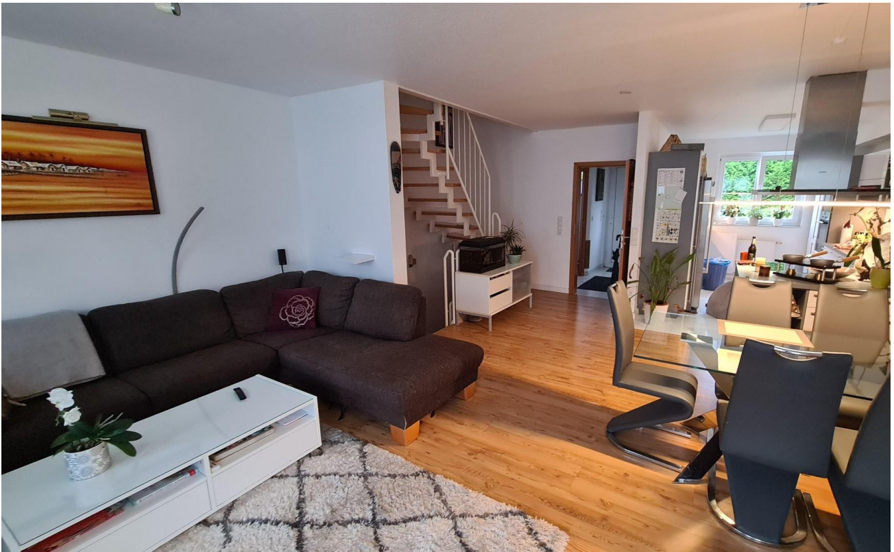
Wohnber. Sicht zur Treppe