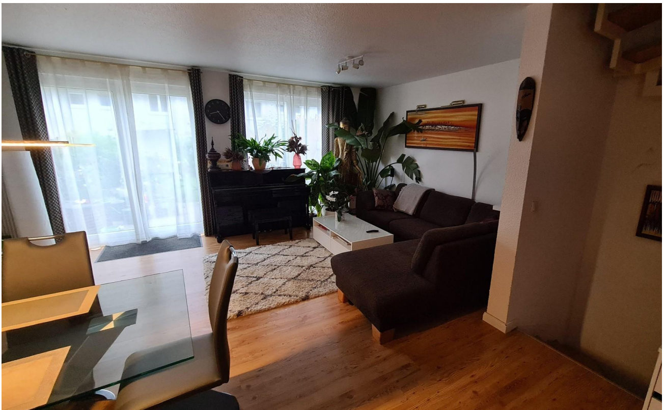
Wohnber. Sicht zur Terrasse