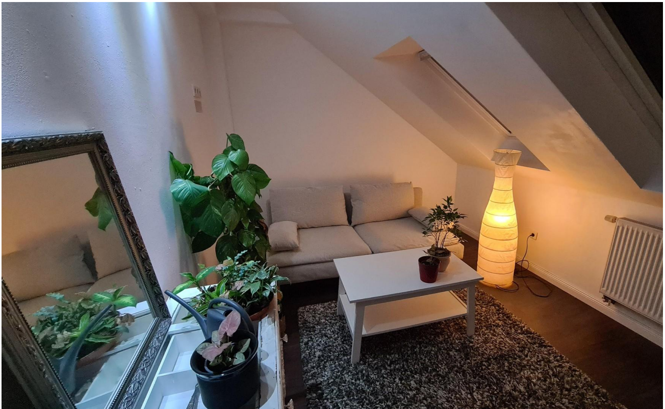
Raum 1 Dachgeschoss