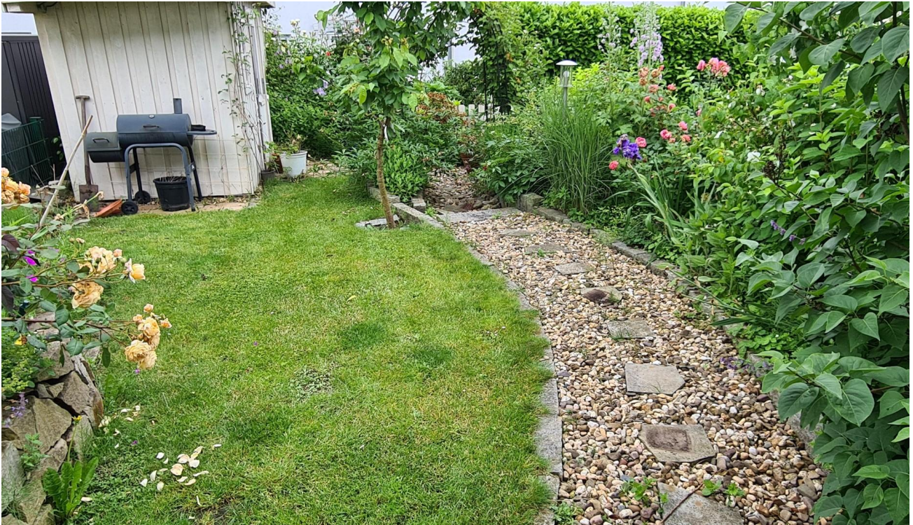
Garten mit Gerätehaus