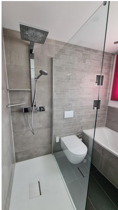
Bad OG Dusche