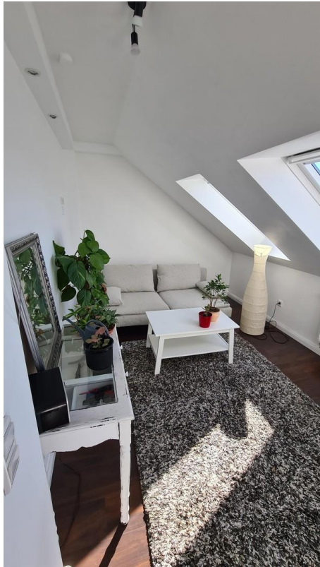
Raum 1 Dachgeschoss