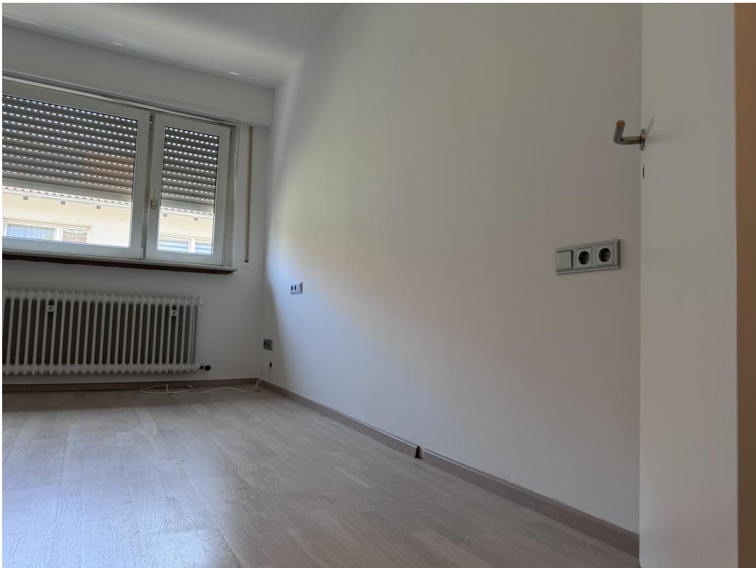
Zimmer 1 Schlafzimmer