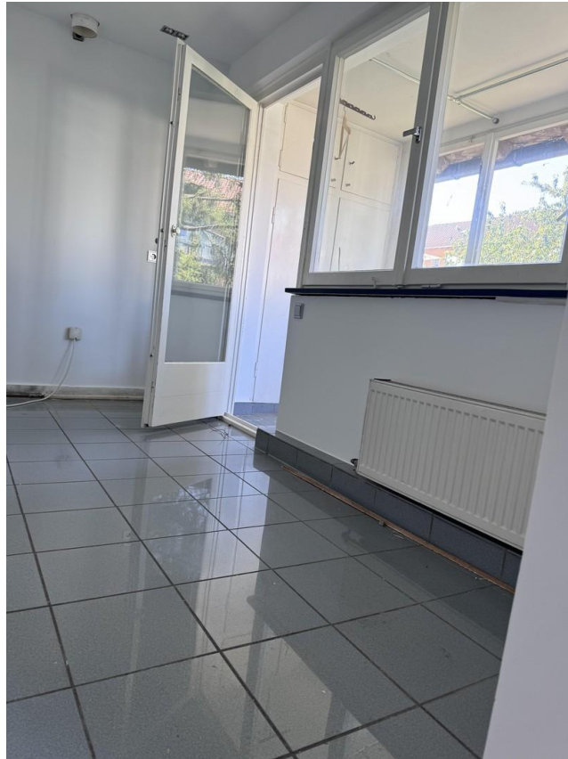
Küche mit Loggia