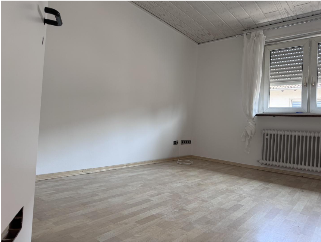
Zimmer 2 Wohnzimmer