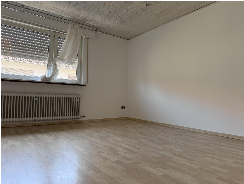
Zimmer 2 Wohnzimmer