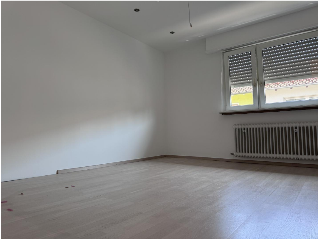
Zimmer 1 Schlafzimmer