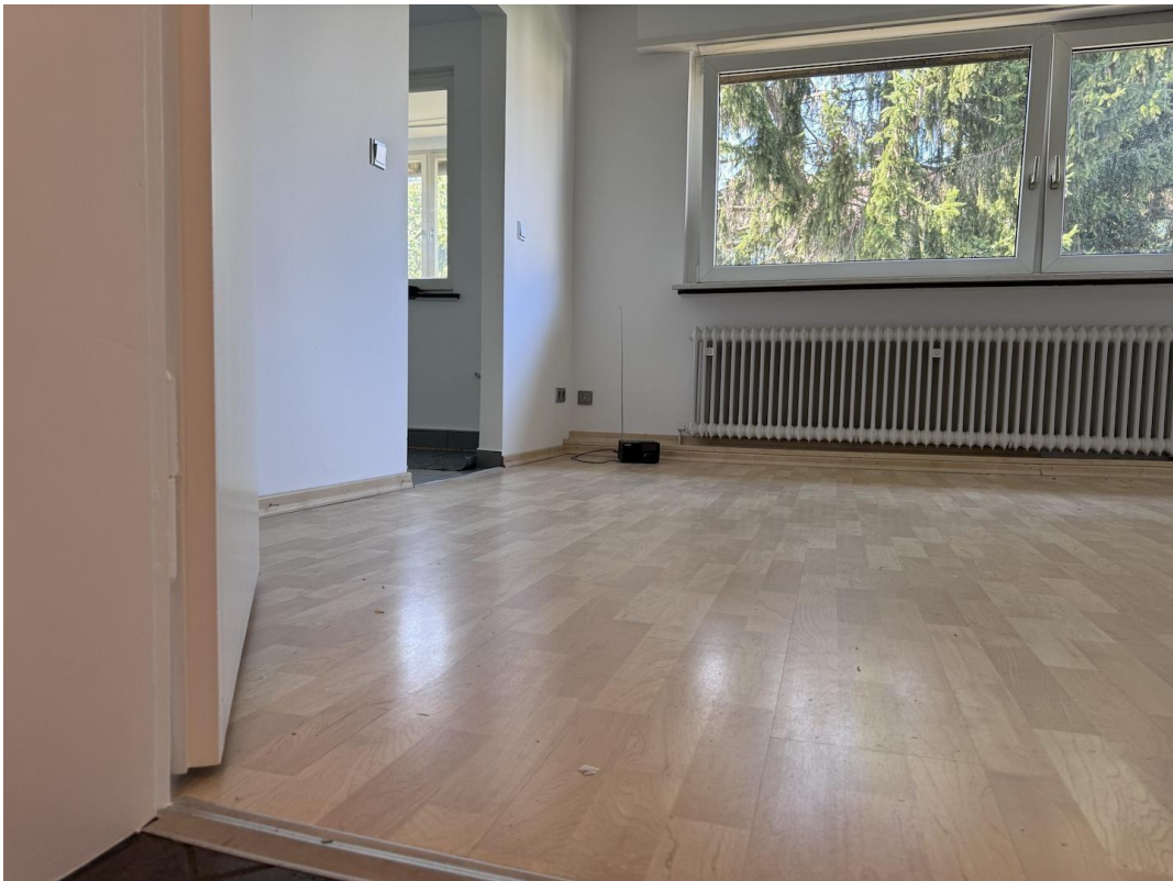
Zimmer 3 Esszimmer