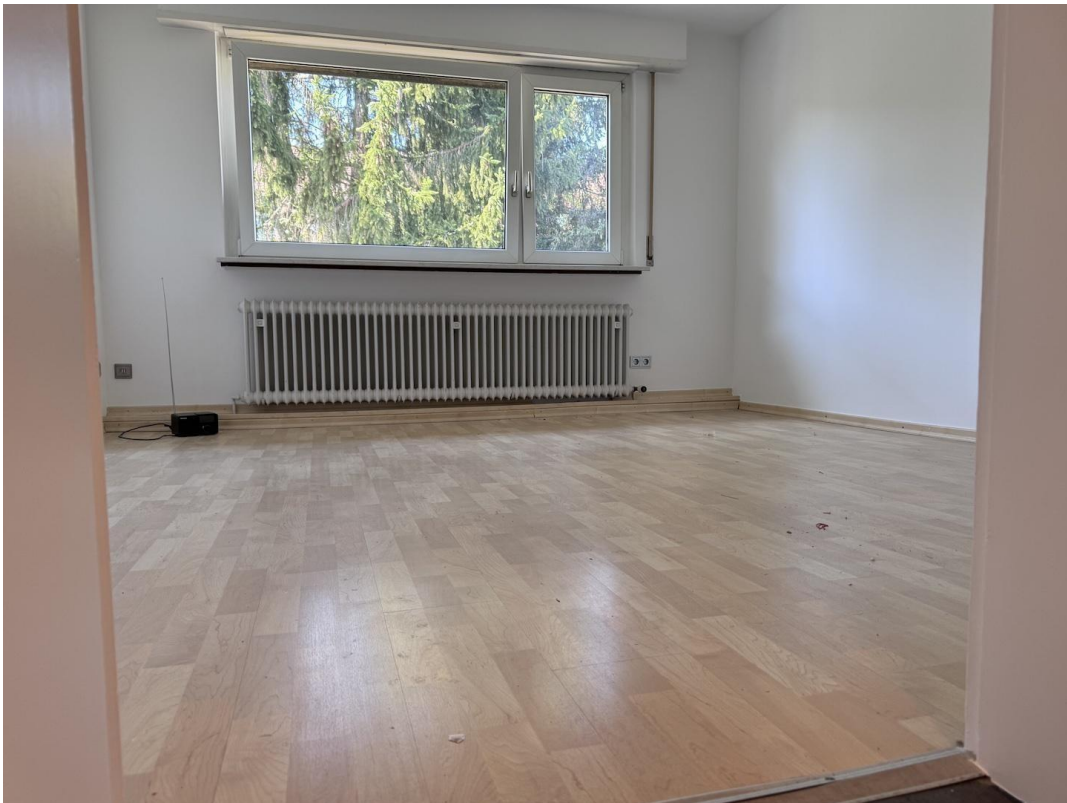
Zimmer 3 Esszimmer