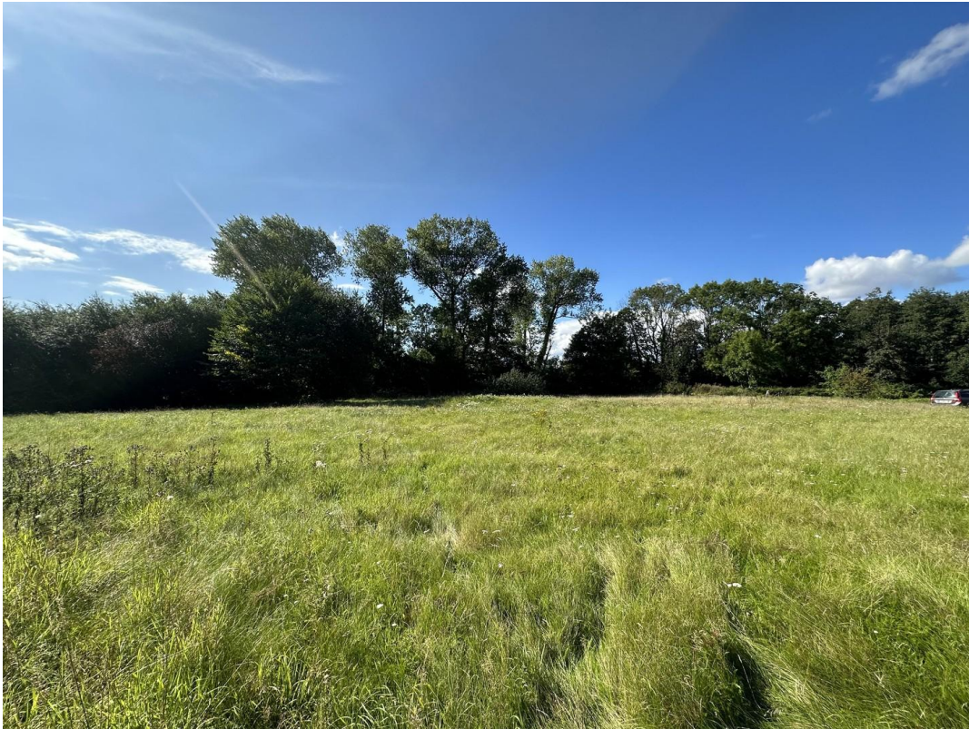
Foto Baugrundstück 2