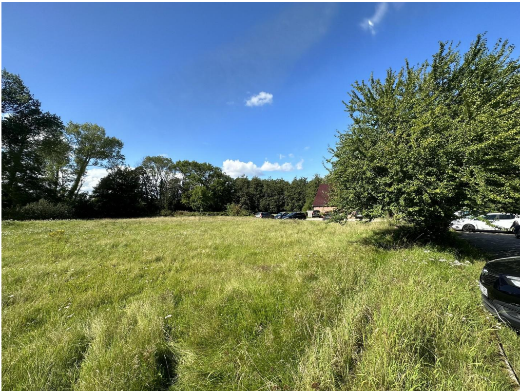
Foto Baugrundstück 3