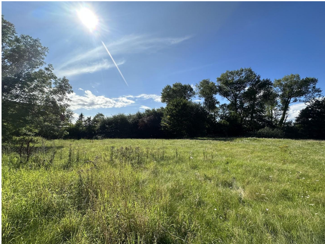
Foto Baugrundstück 1