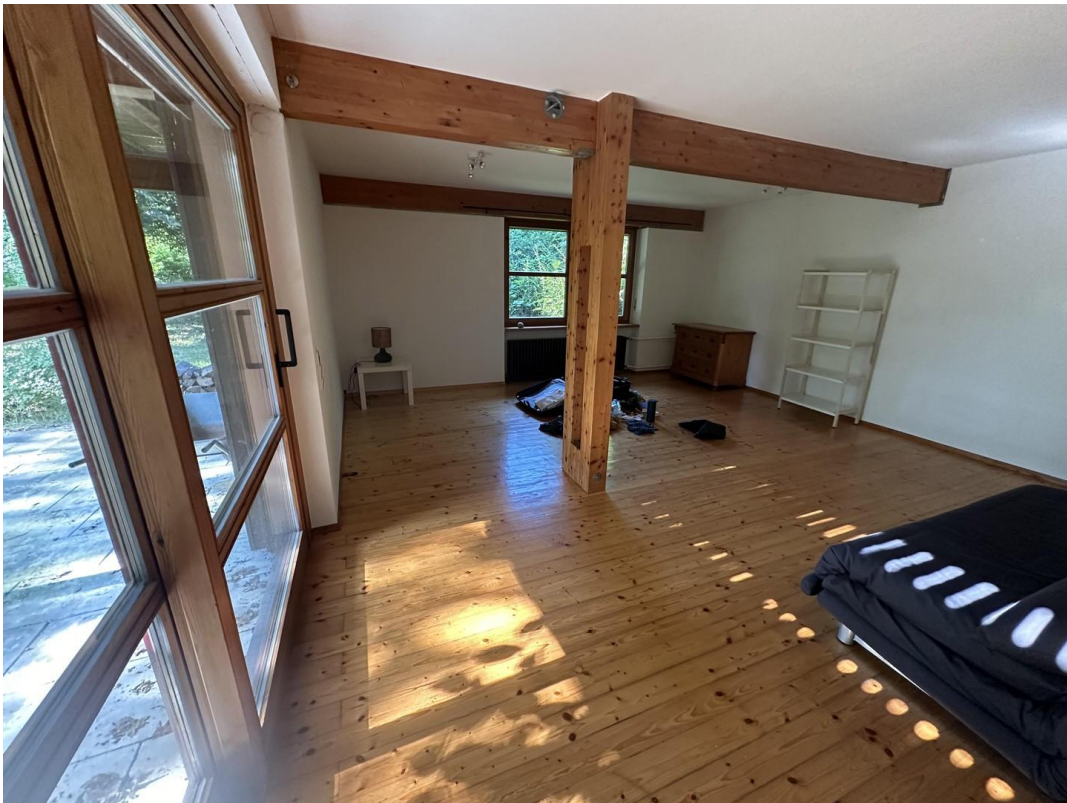
3. Schlafzimmer im UG