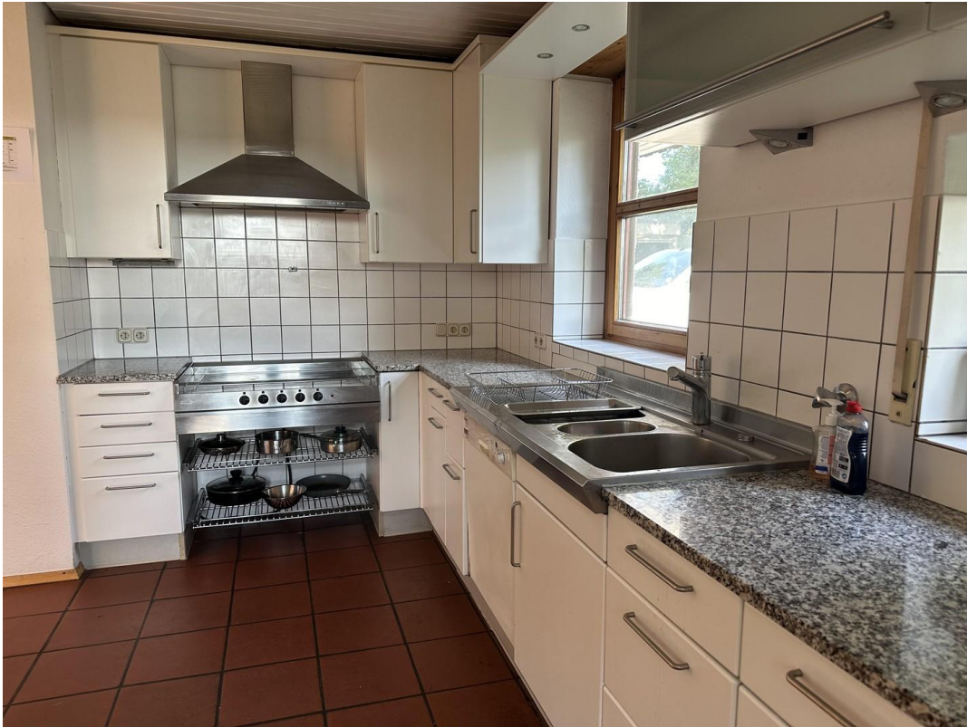
Küche mit Granit Arbeitsplatte