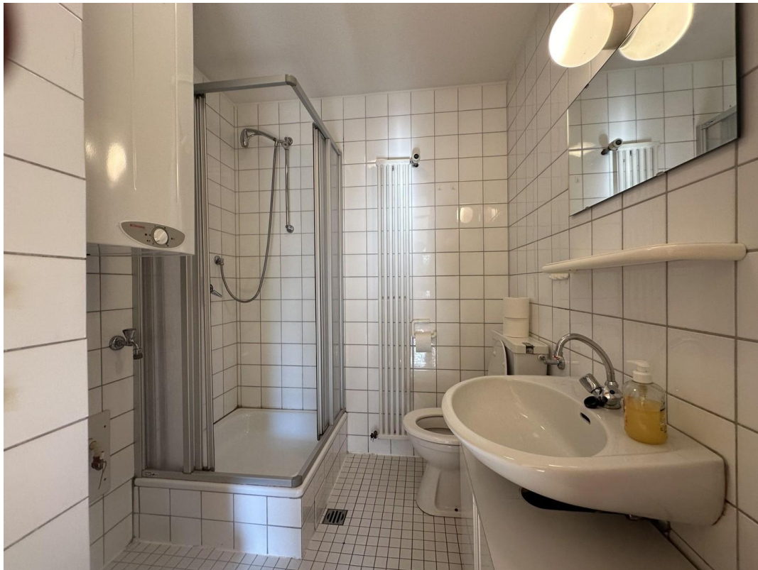
2. Badezimmer im UG