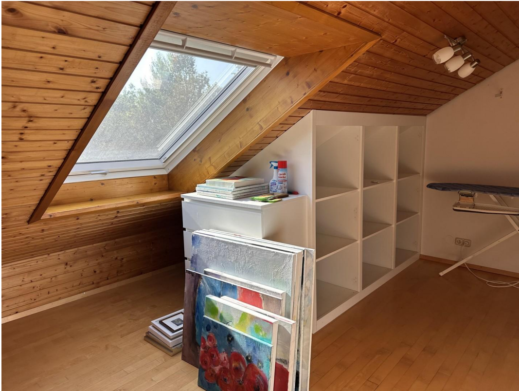
Ankleidezimmer 3. OG