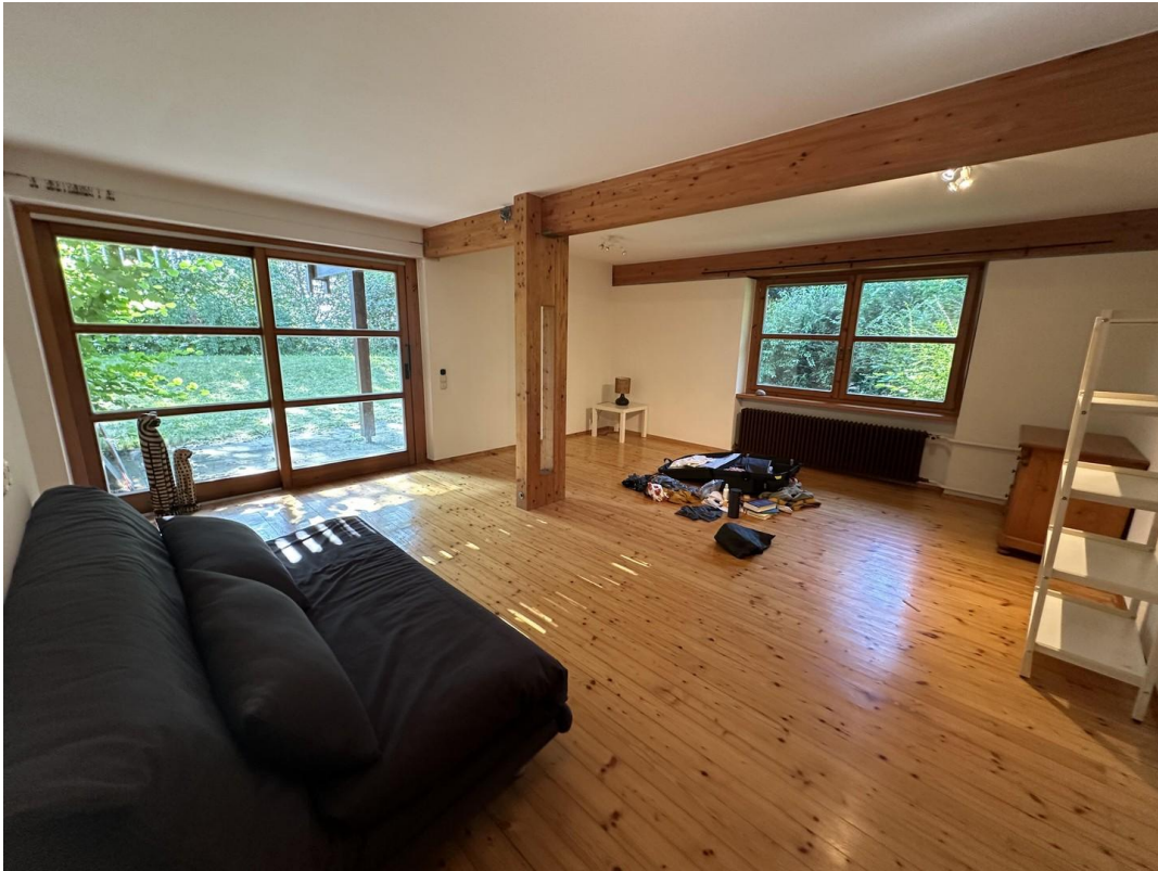
3. Schlafzimmer im UG