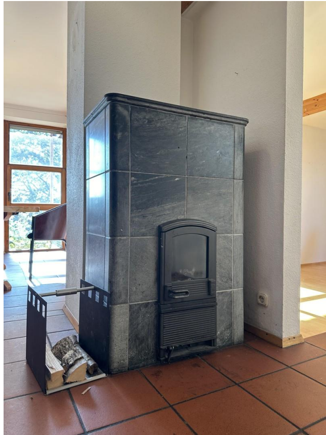
Kaminofen aus Speckstein