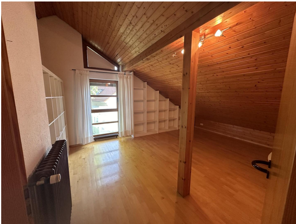
Schlafzimmer im 3. OG