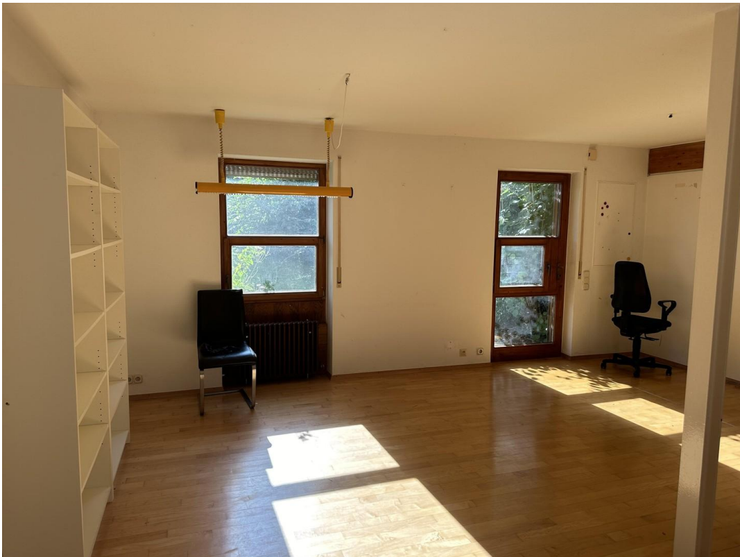
4. Schlafzimmer im UG