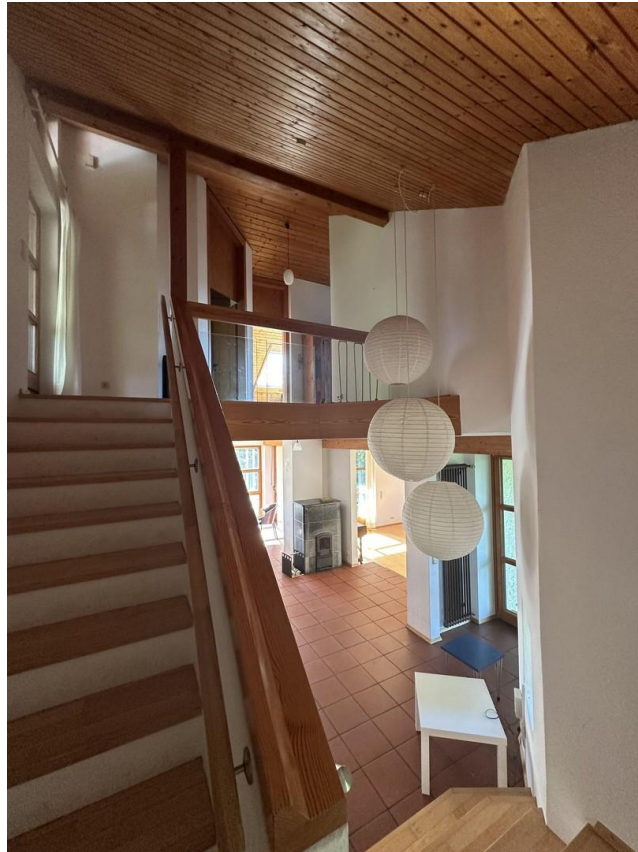
Treppenaufgang ins 3. OG