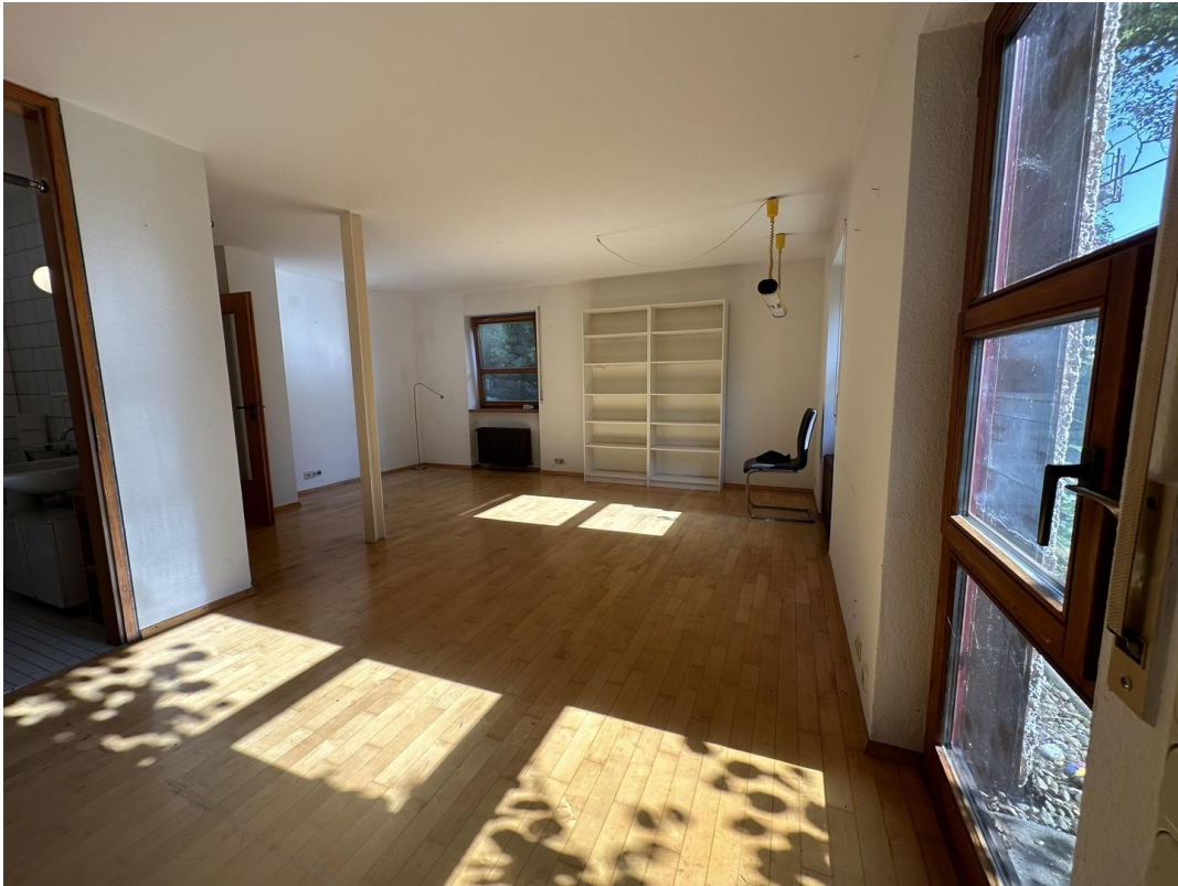
4. Schlafzimmer im UG