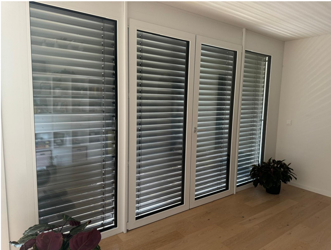
Jalousien überall elektrisch