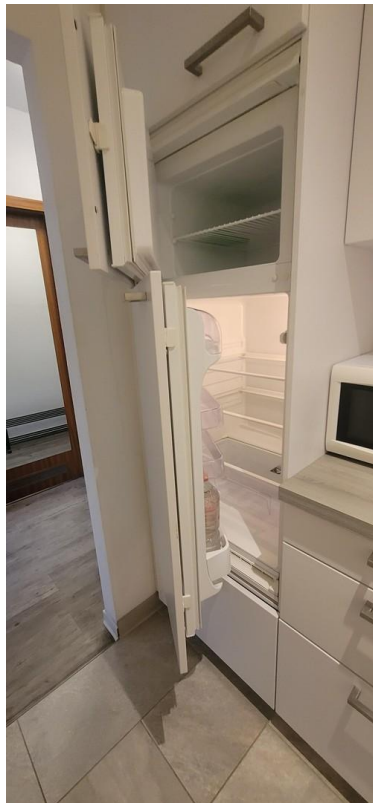
Kuehlschrank mit Gefrierfach