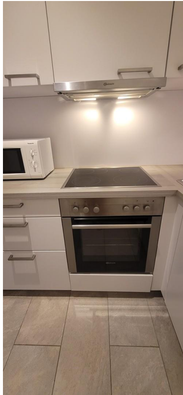
Kochen & Backen