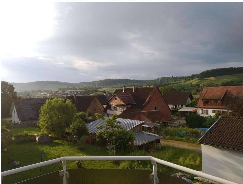
Balkon, toller Panoramablick