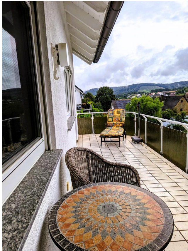
Balkon mit kleiner Überdachung