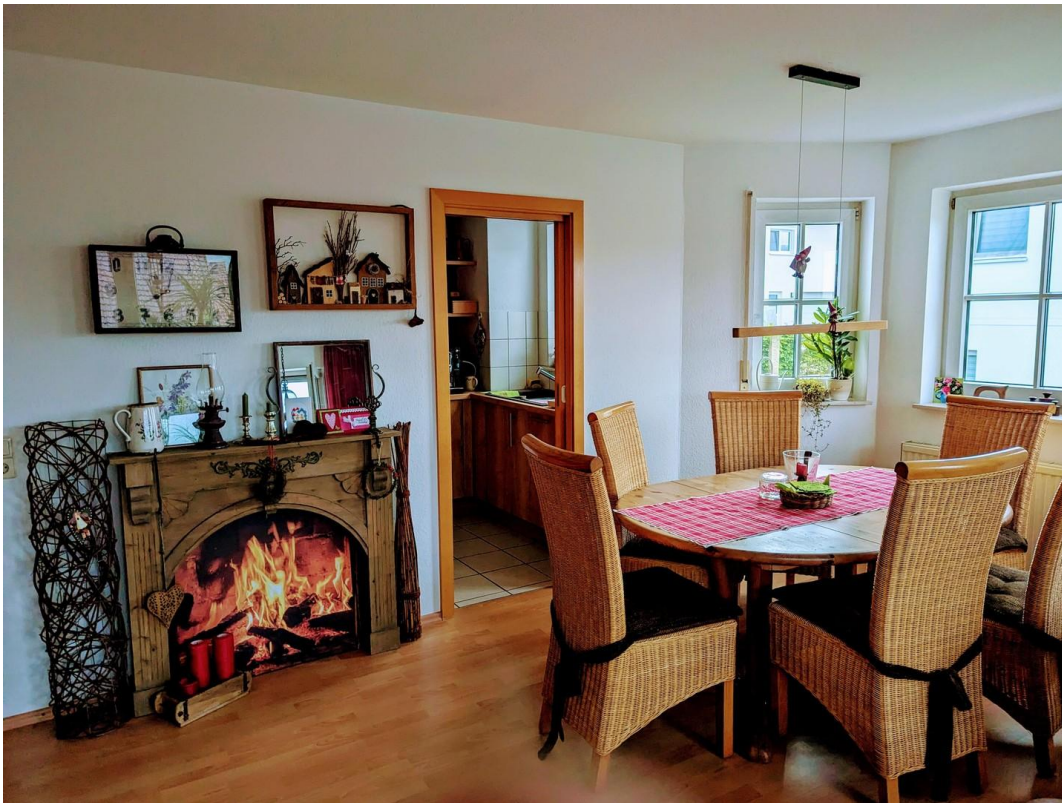
Essbereich Ausgang Küche