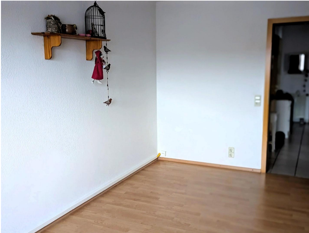
Arbeitszimmer Ausgang zum Flur