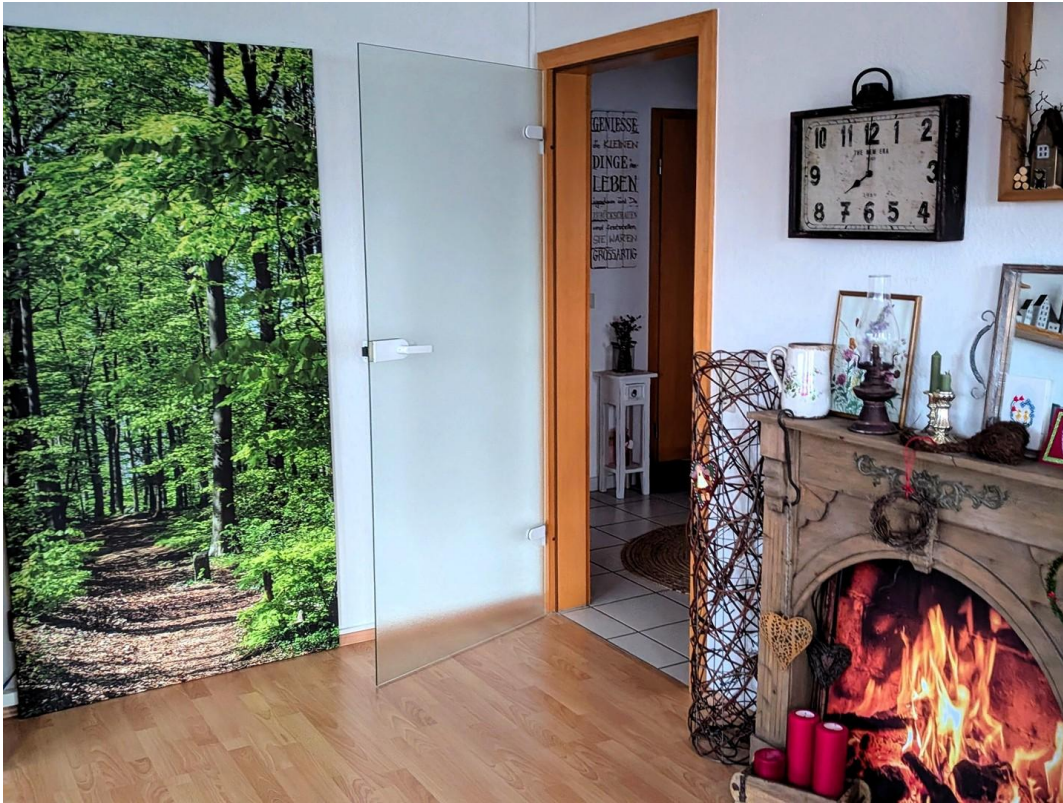
Wohnzimmer Ausgang zum Flur