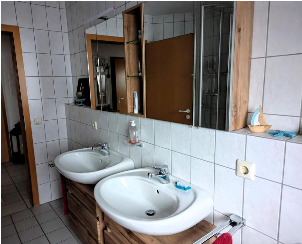
Bad mit zwei Waschbecken