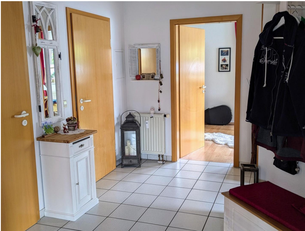
großzügiger Flur mit Garderobe