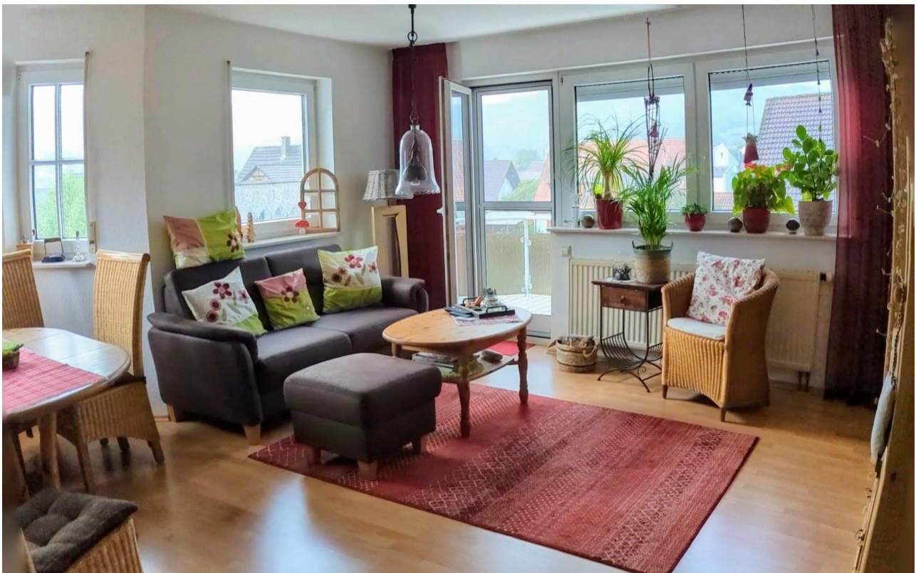
Wohnzimmer Ausgang Balkon