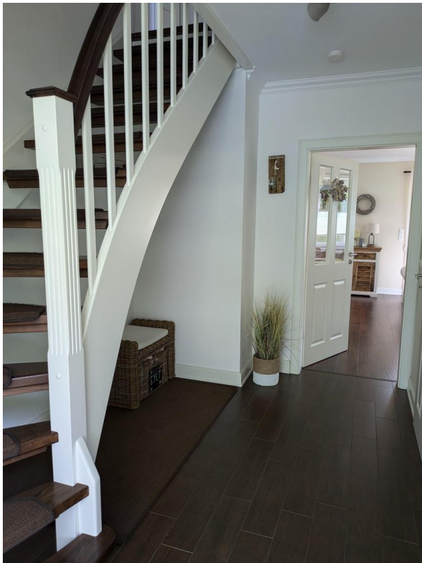
Flur und Treppenaufgang