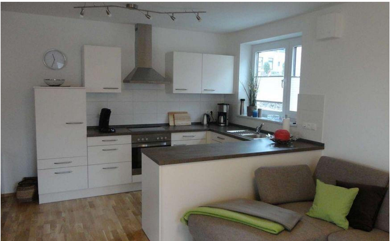
Wohn- und Essbereich