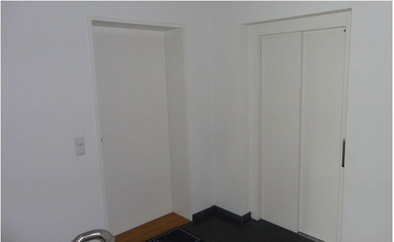
Eingangsbereich & Aufzug