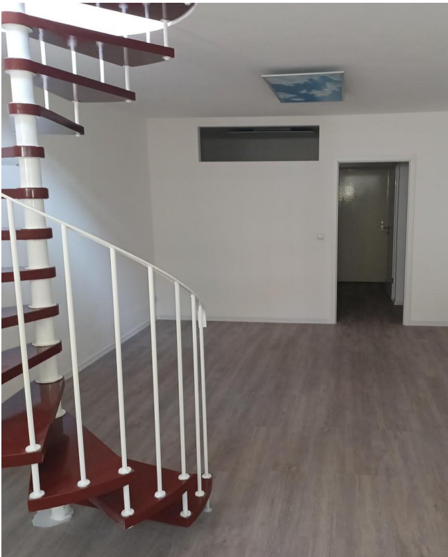
unterer Bereich 2