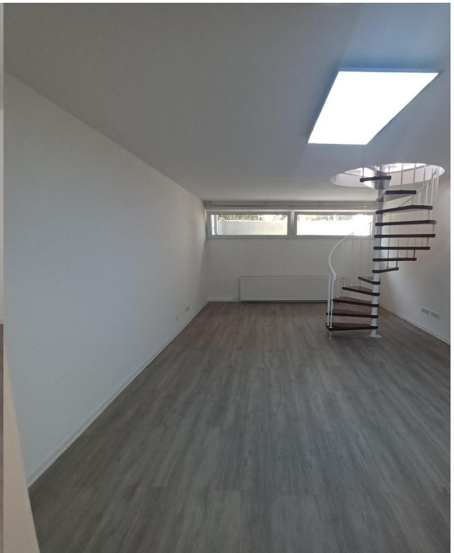
unterer Bereich 3