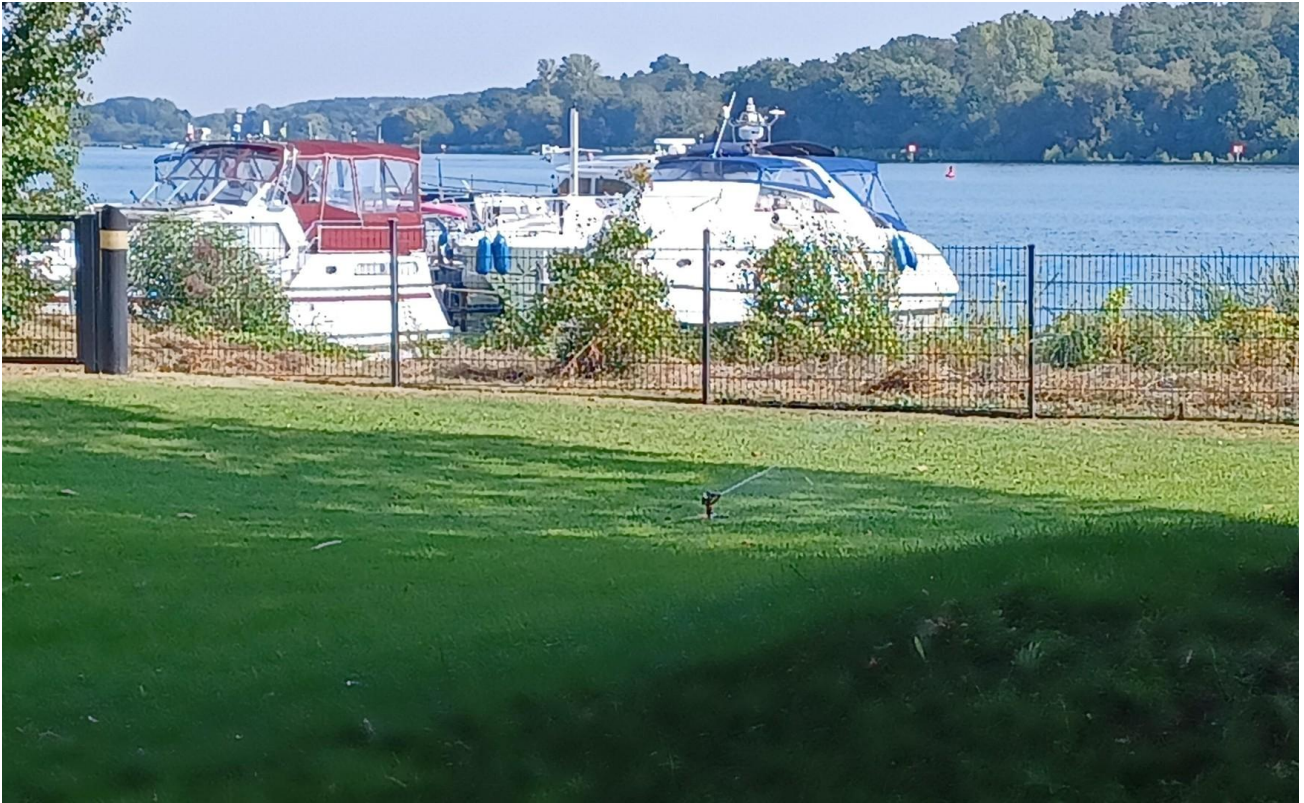
Blick vom Grundstück 2