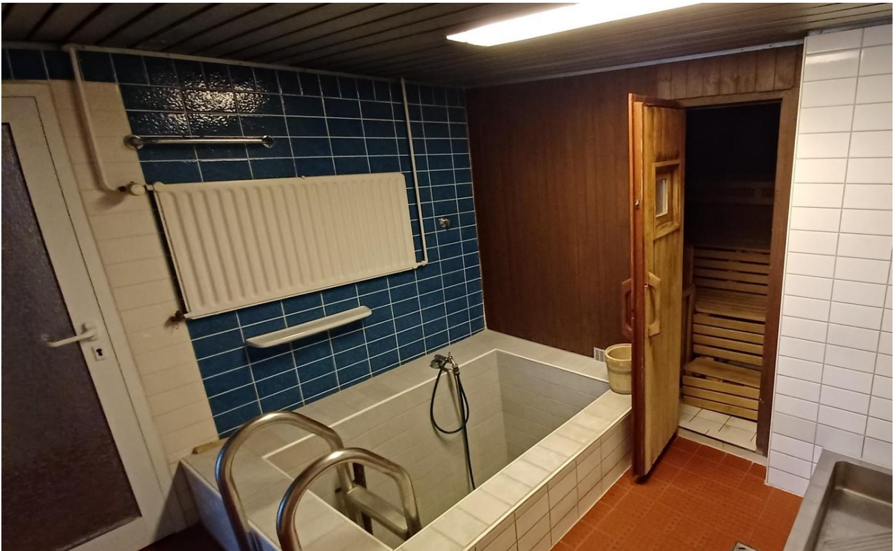
Sauna und Tauchbecken