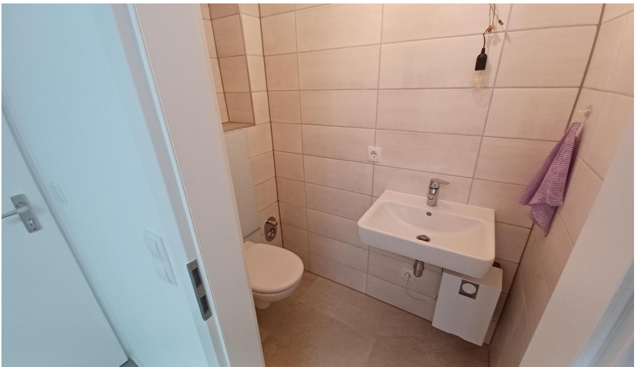
WC unterer Bereich