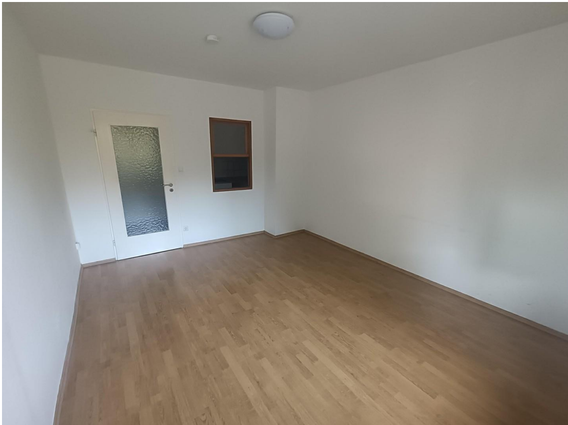
Wohnzimmer mit Druchreiche