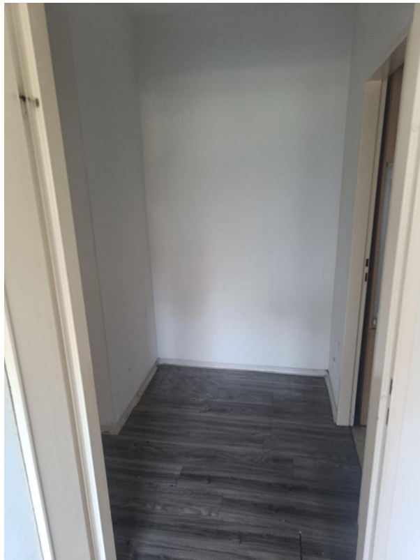
Abstellplatz im Flur