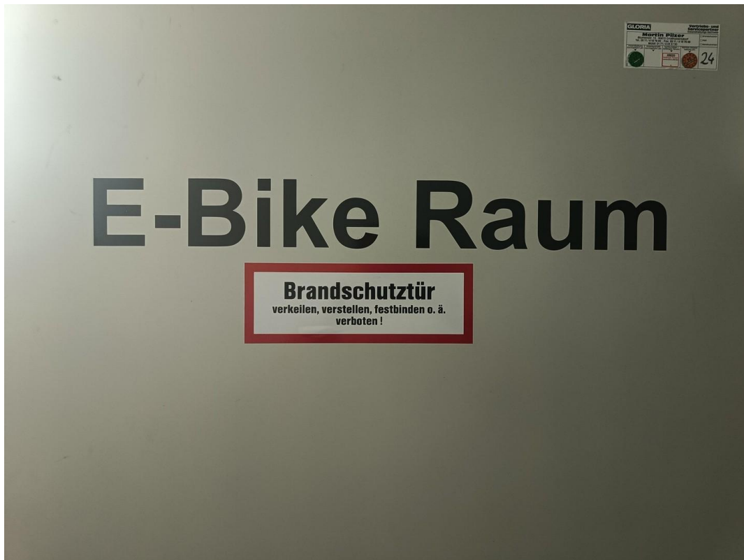
Gesonderter Raum für E-Bikes