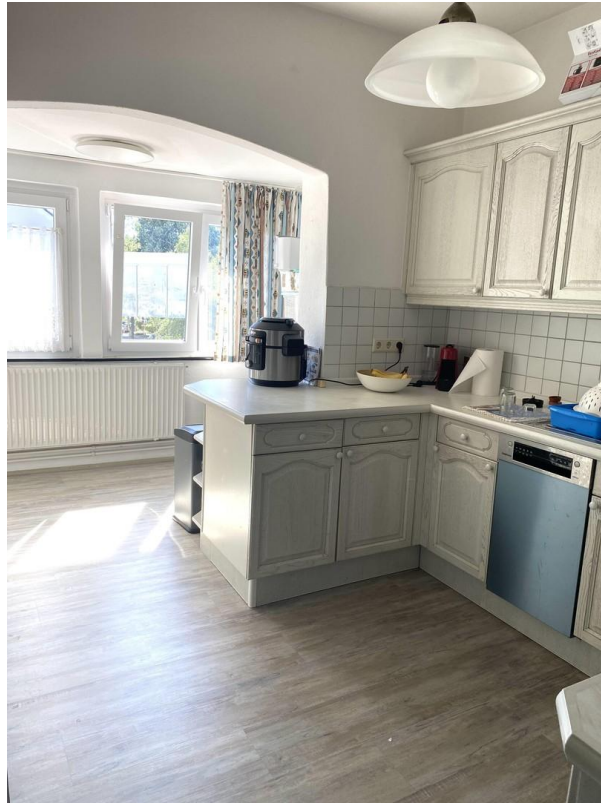
Einbauküche mit viel Platz