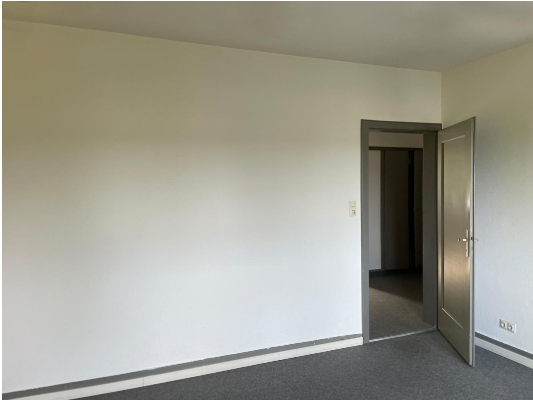
Büro D 2