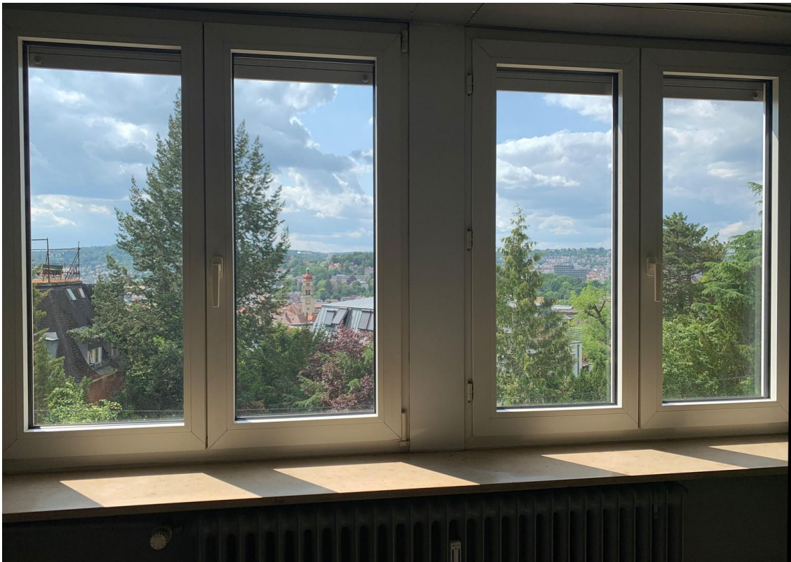
Ausblick Büro D