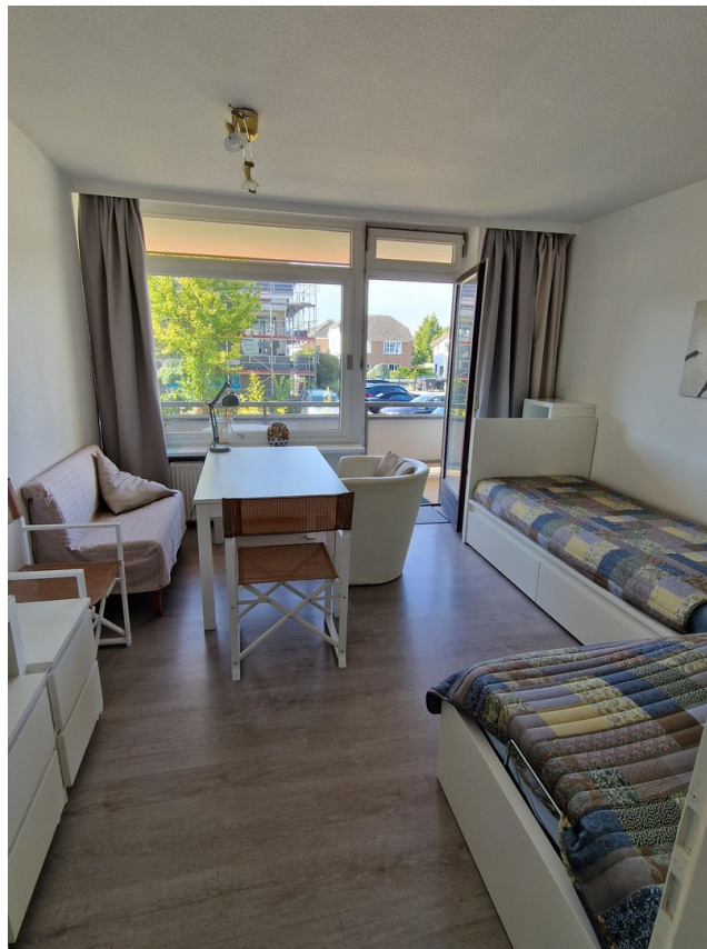
Wohnzimmer mit Balkon