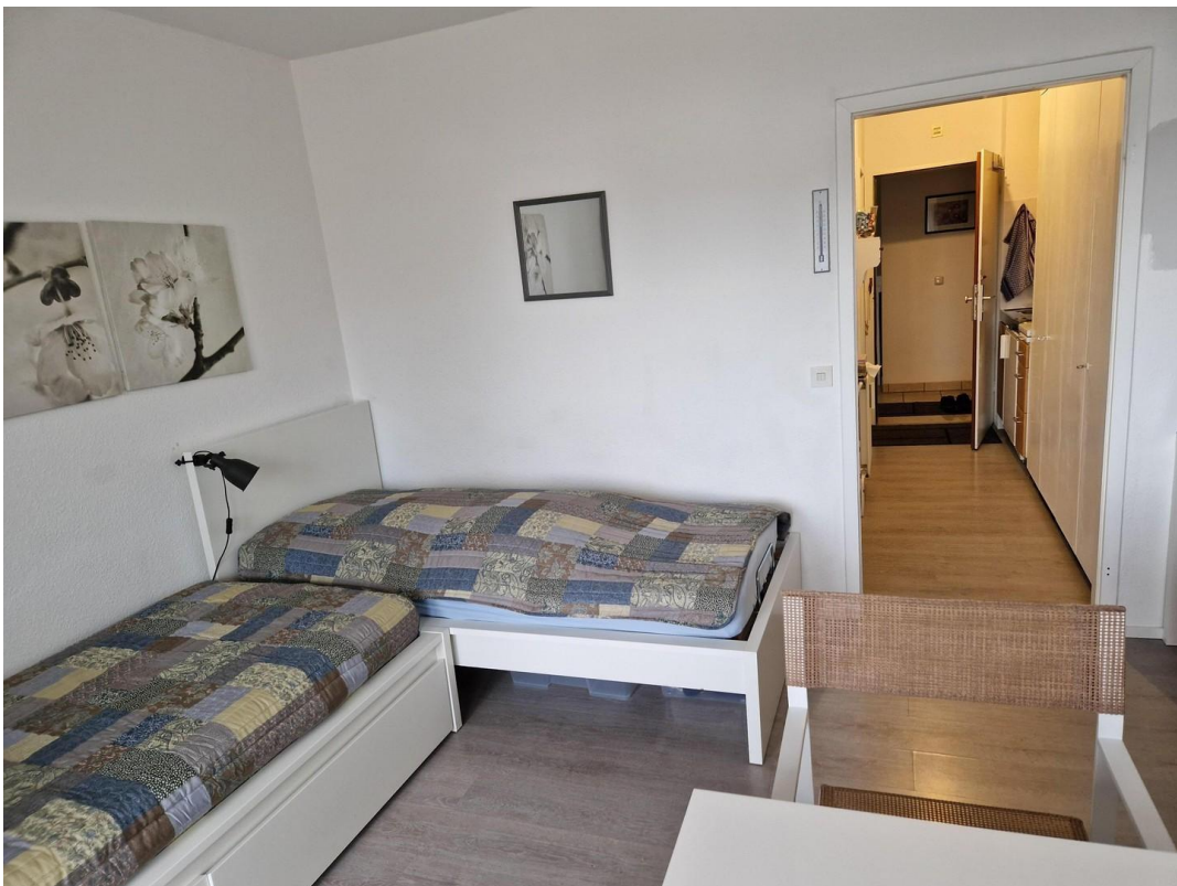
Blick vom Wohnzimmer zum Flur