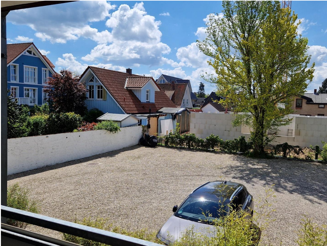
Blick vom SW Balkon