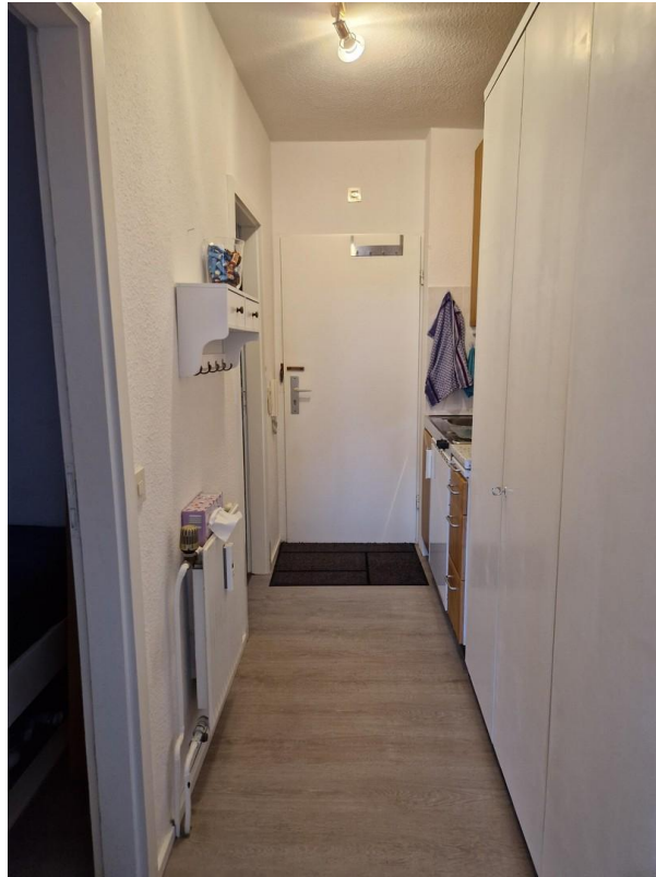
Flur mit Einbauschränk