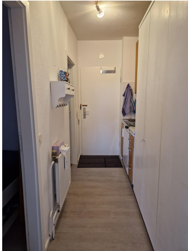
Flur mit Einbauschränk