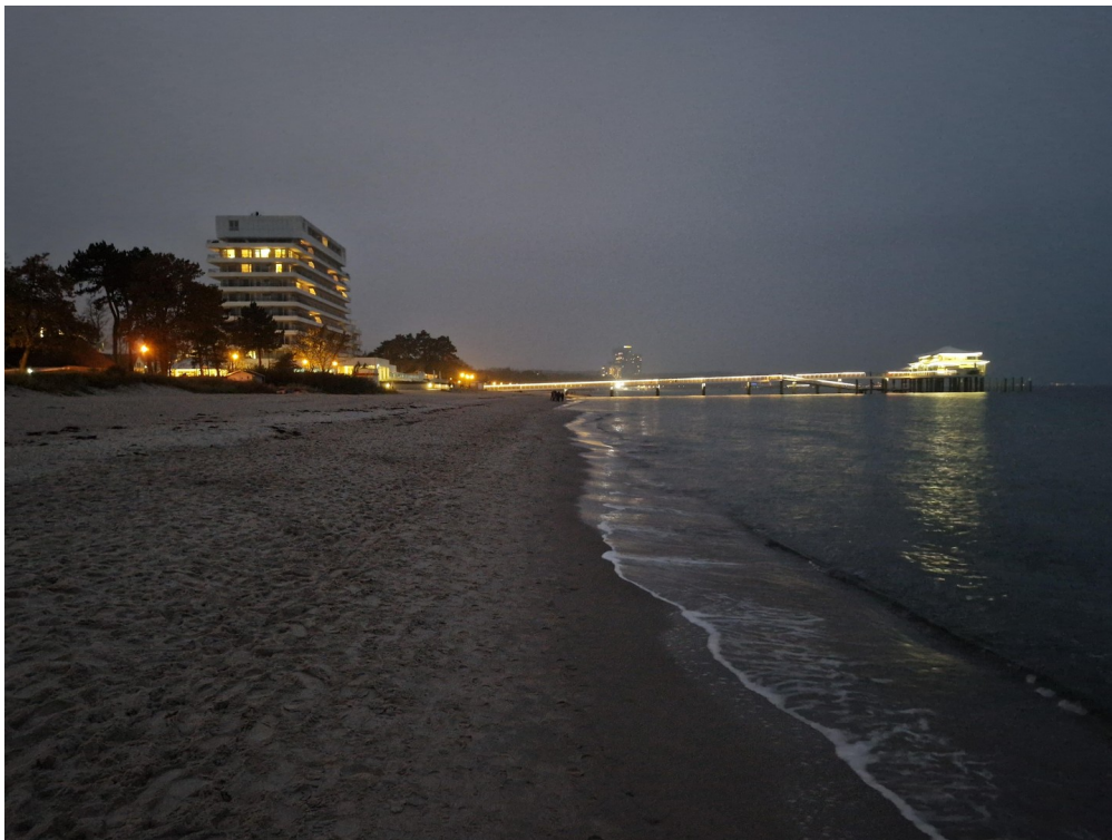
Weihnachten in Timmendorf?