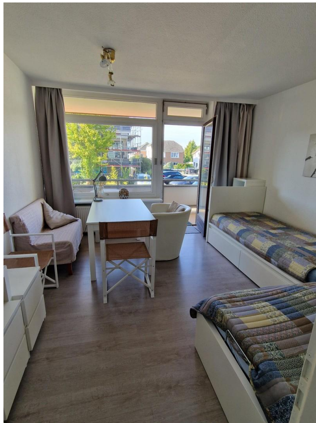
Wohnzimmer mit Balkon