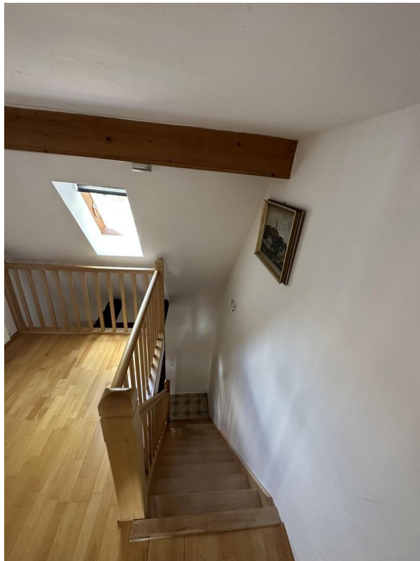
Treppe und Empore OG