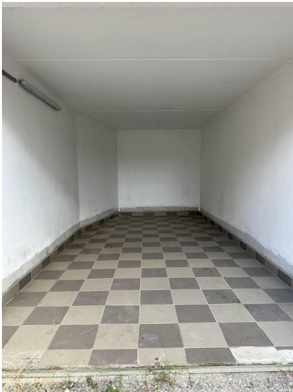
Garage in Nebengebäude