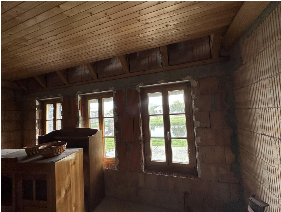
Murg-Blick aus Nebengebäude