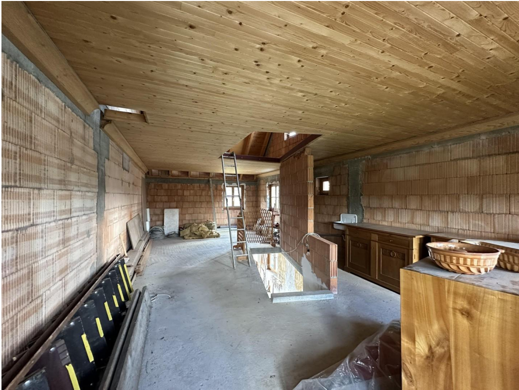
Teileigentum in Nebengebäude