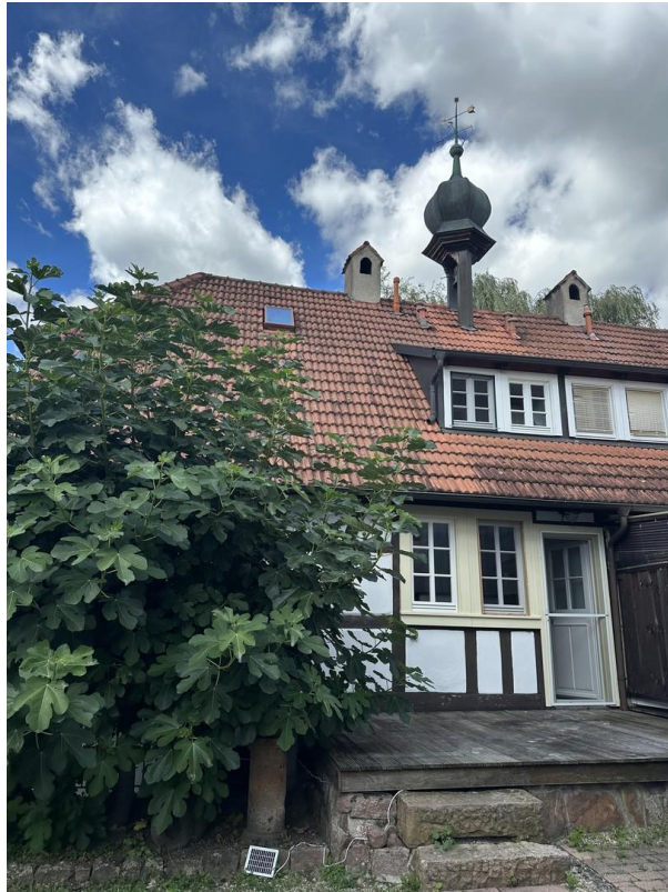
Haus Hinteransicht + Terrasse