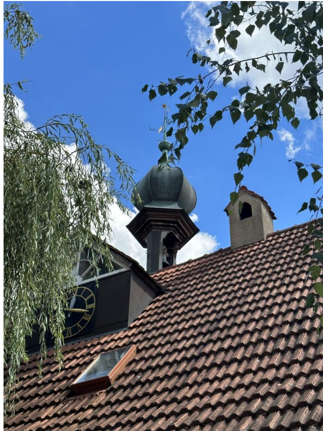
Turm und Uhr