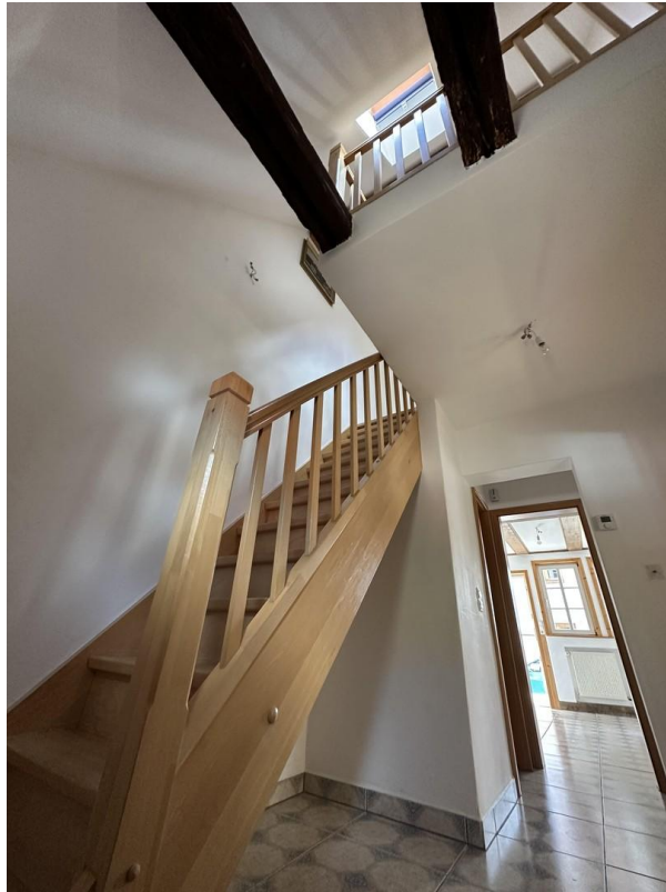
Treppenaufgang EG in OG