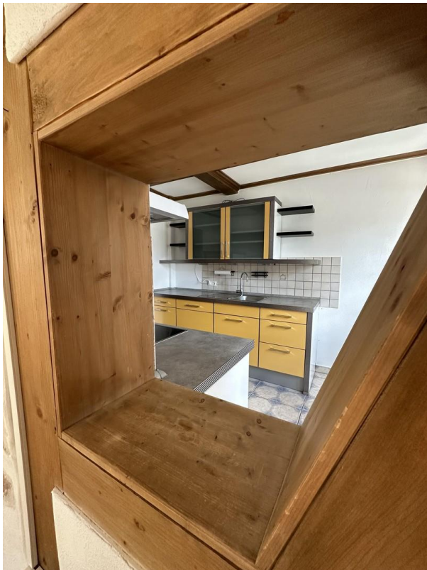
Durchreiche aus Wohn-Esszimmer