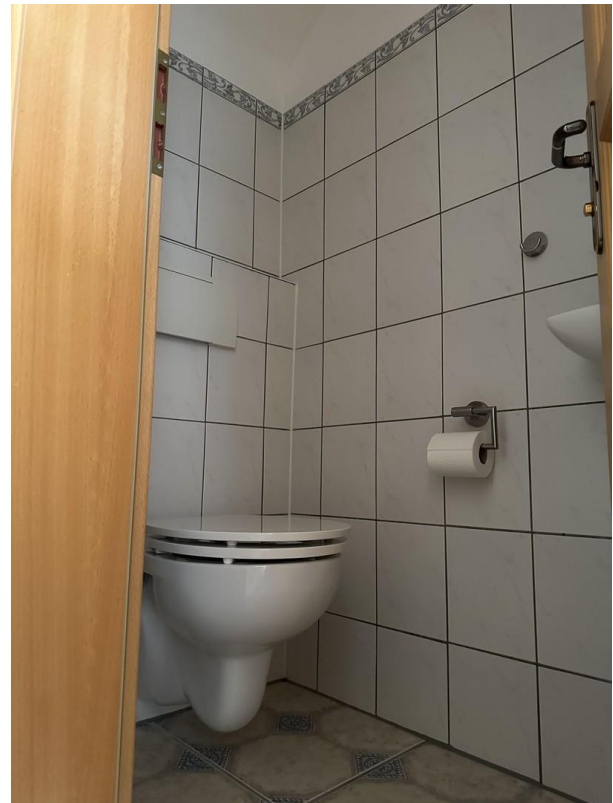
Gäste WC EG