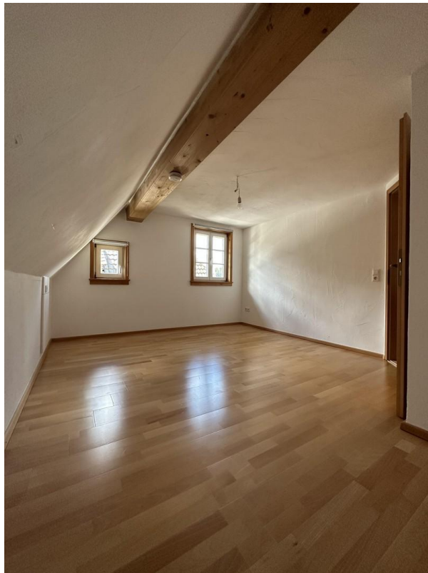
Schlafzimmer I OG