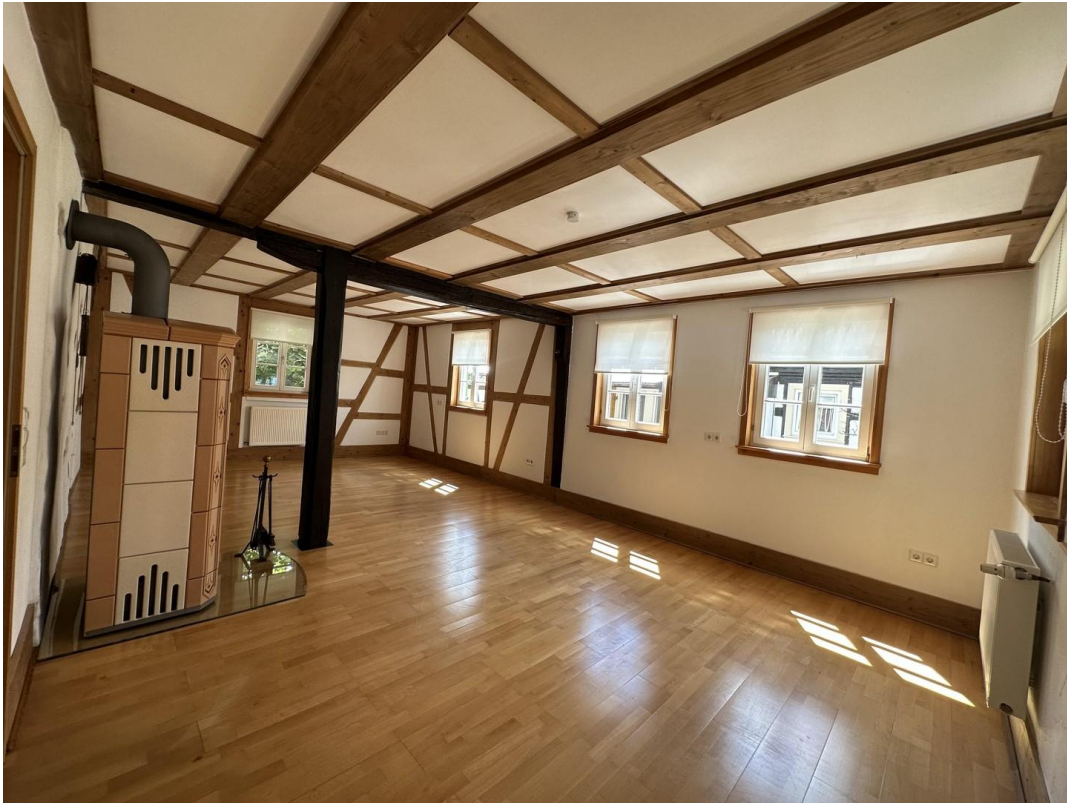
Wohn- und Esszimmer