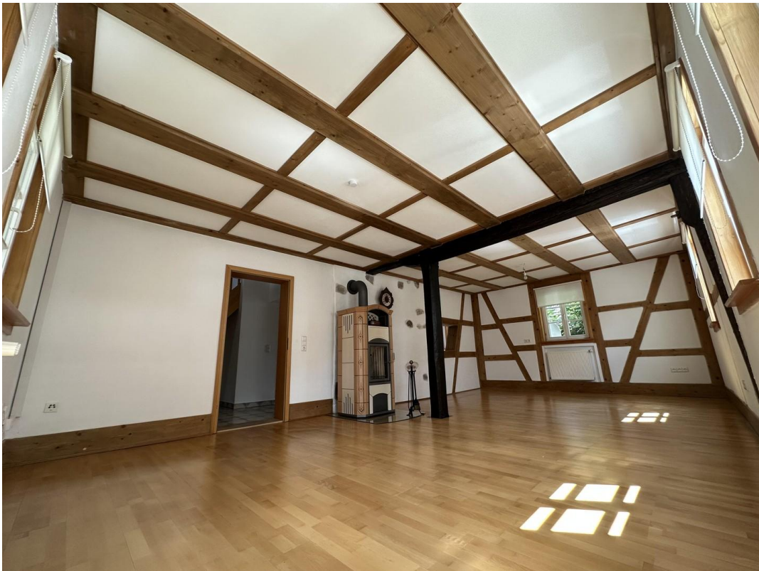
Wohn- und Esszimmer