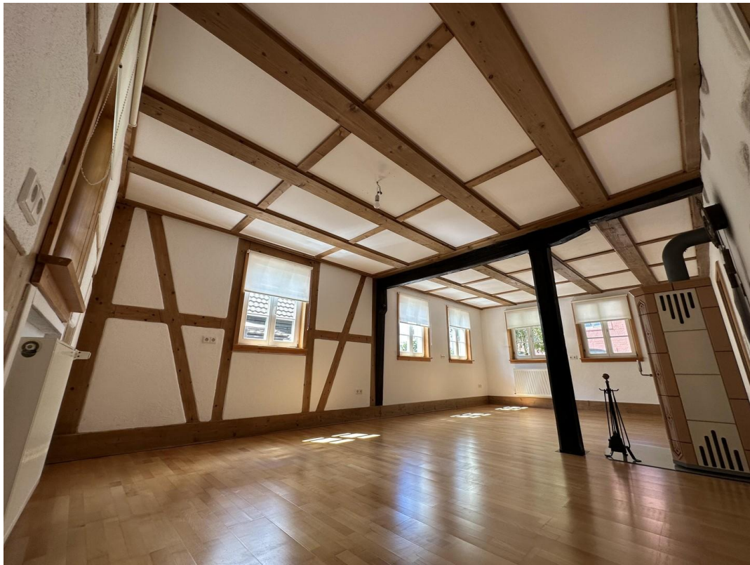
Wohn- und Esszimmer