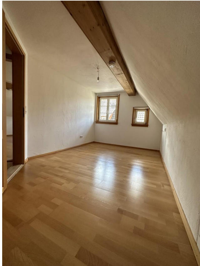
Schlafzimmer II OG