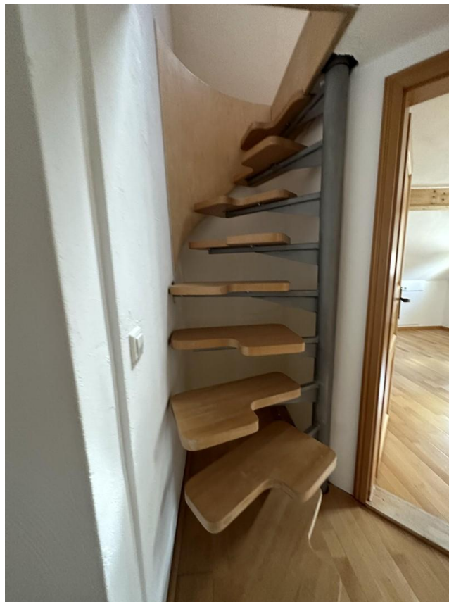
Wendeltreppe OG in DG