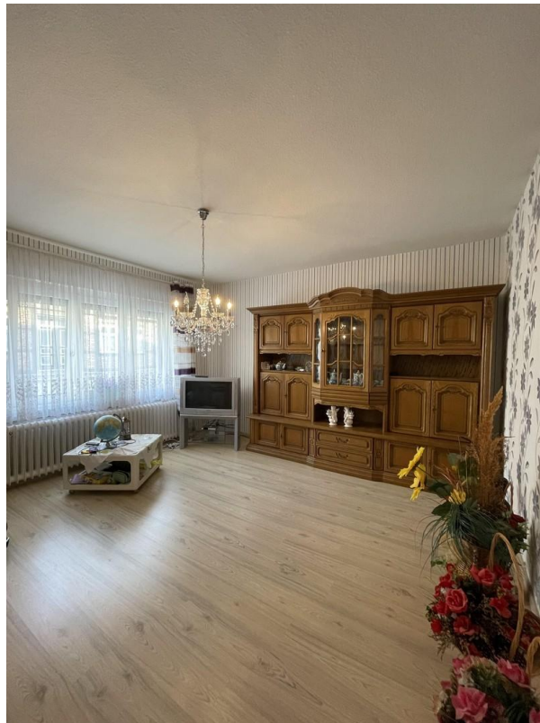
Wohnzimmer 1 unten links