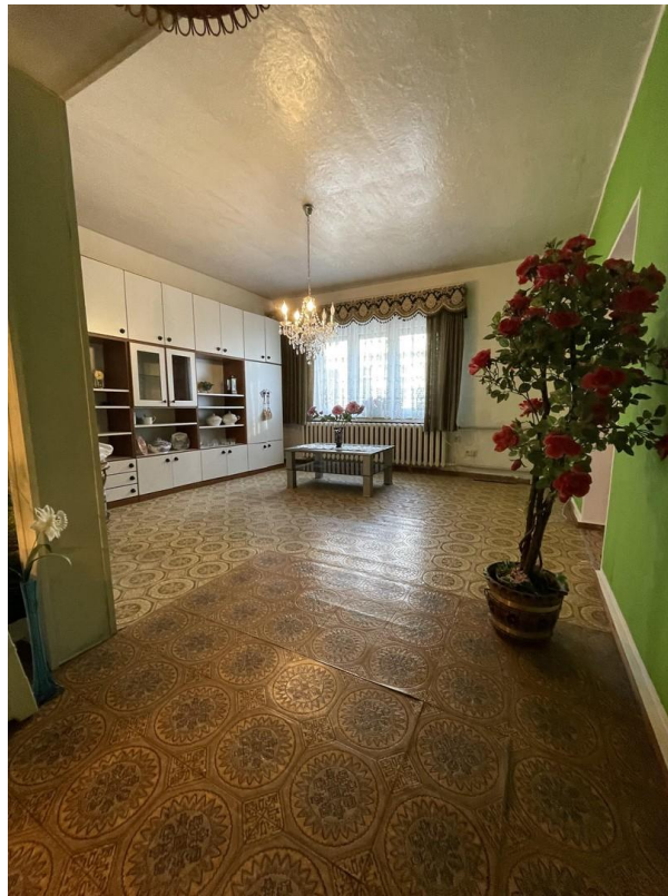
Wohnzimmer 2 unten rechts