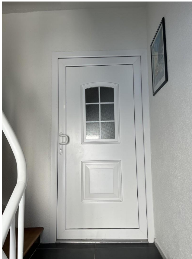
Wohnungseingang 1. OG