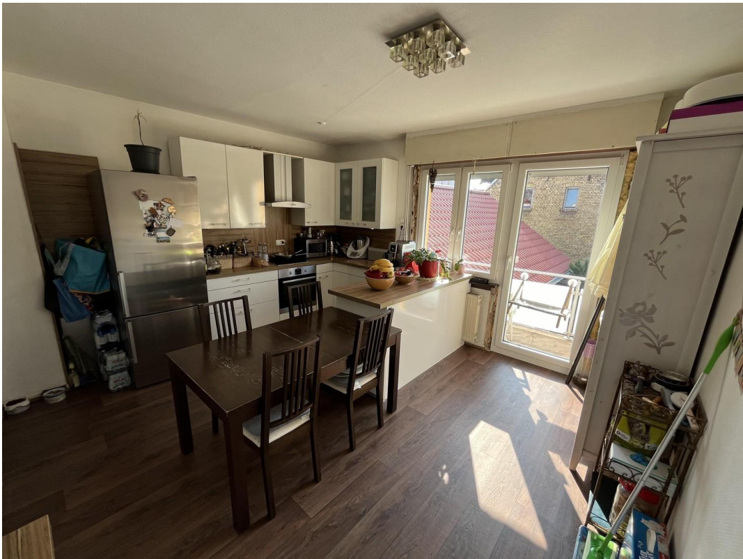
Zugang zum Balkon