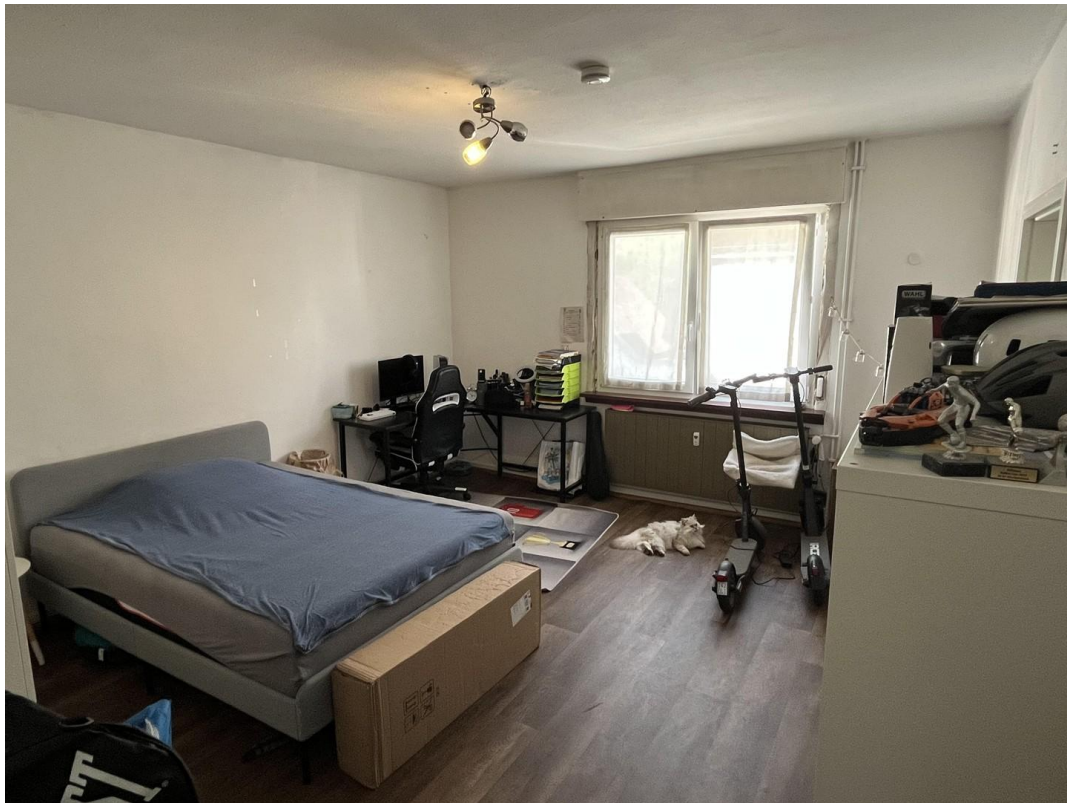
Kind oder Büro