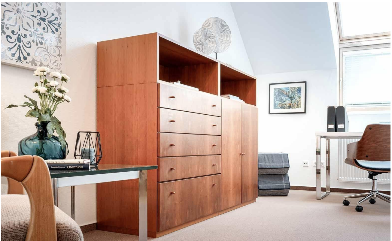
Arbeiten oder Familie