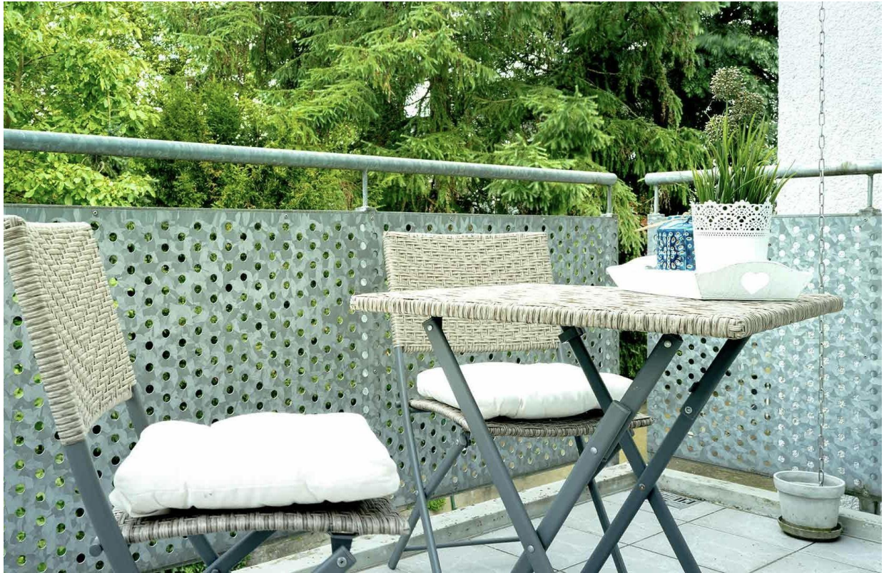
Balkon mit Blick ins Grüne