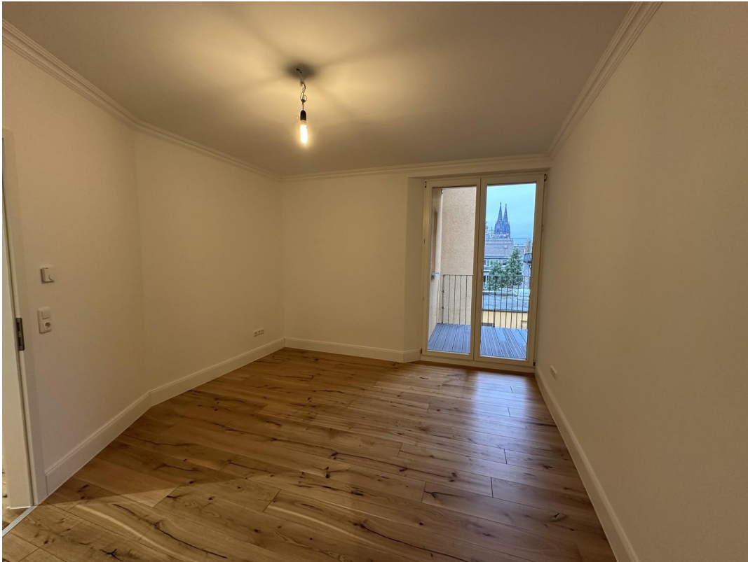
Schlafzimmer 1 mit Domblick