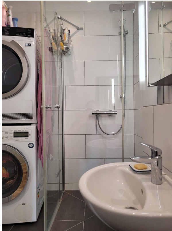
Duschbad mit WM und Trockner