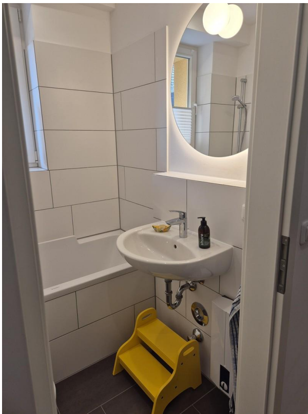
Wannenbad mit Fenster