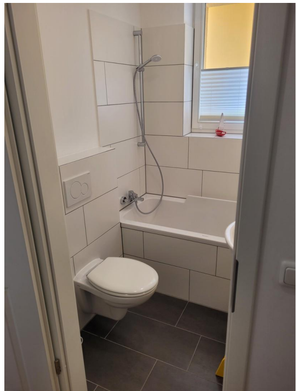
Wannenbad mit Fenster