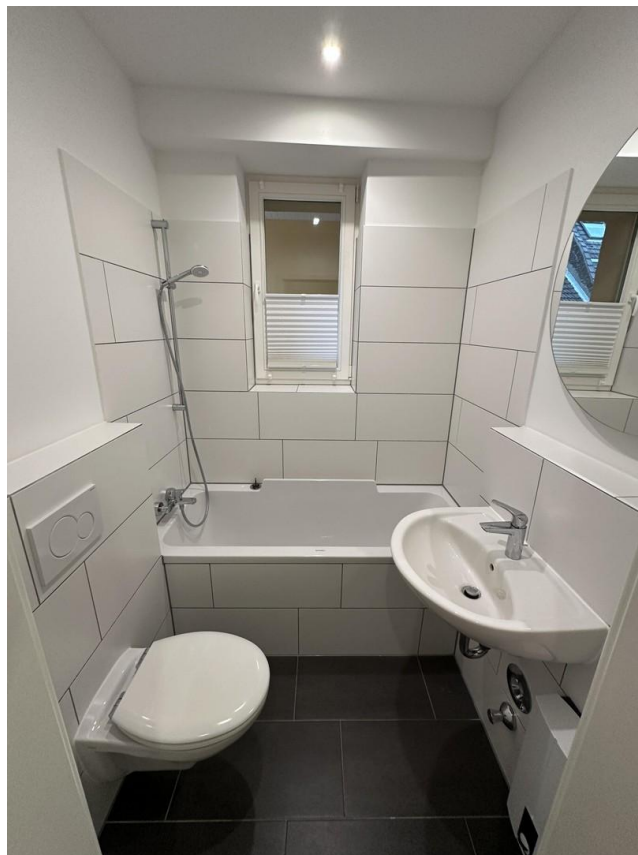
Wannenbad / Gästebad