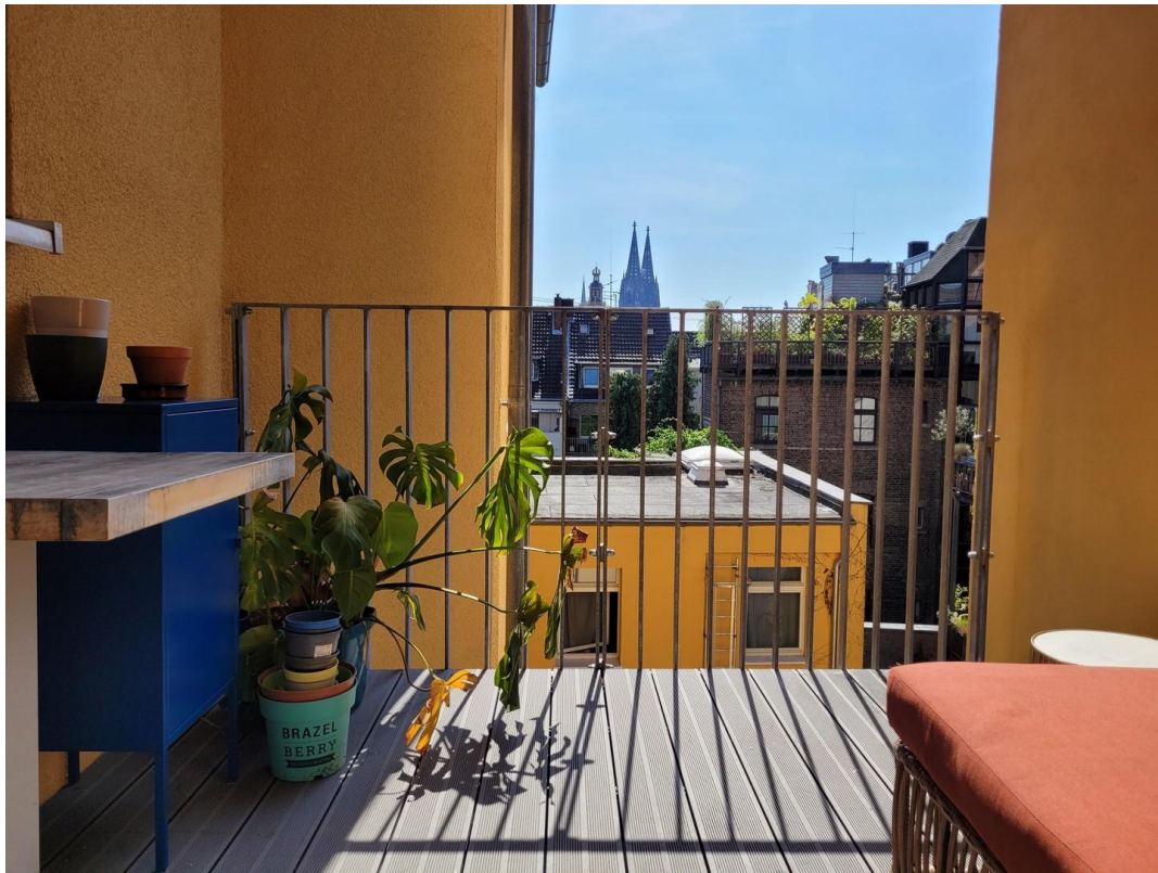
Balkon Schlafzimmer 1