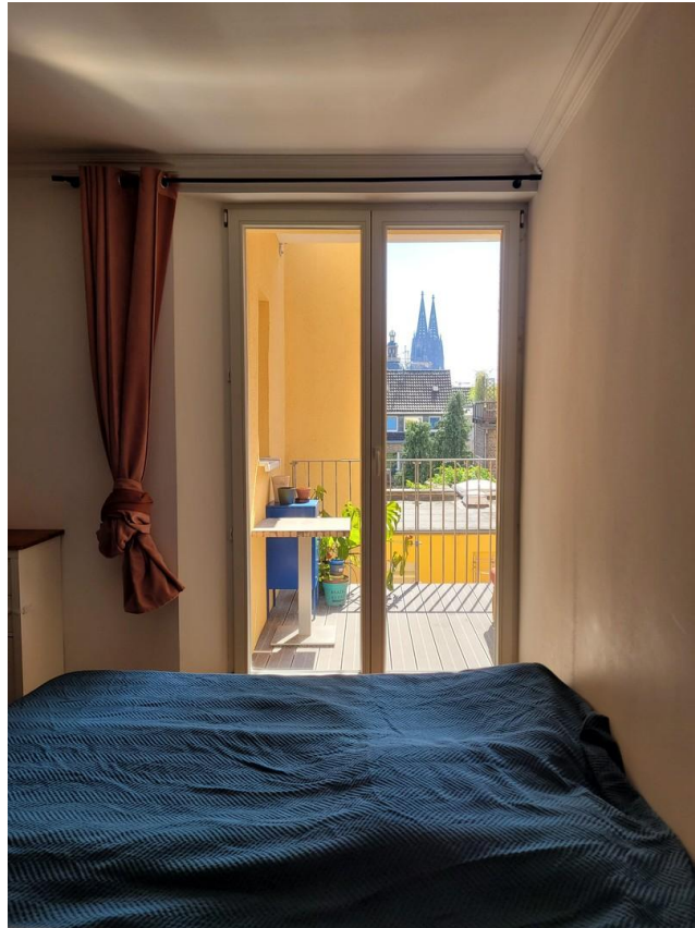
Schlafzimmer mit Domblick