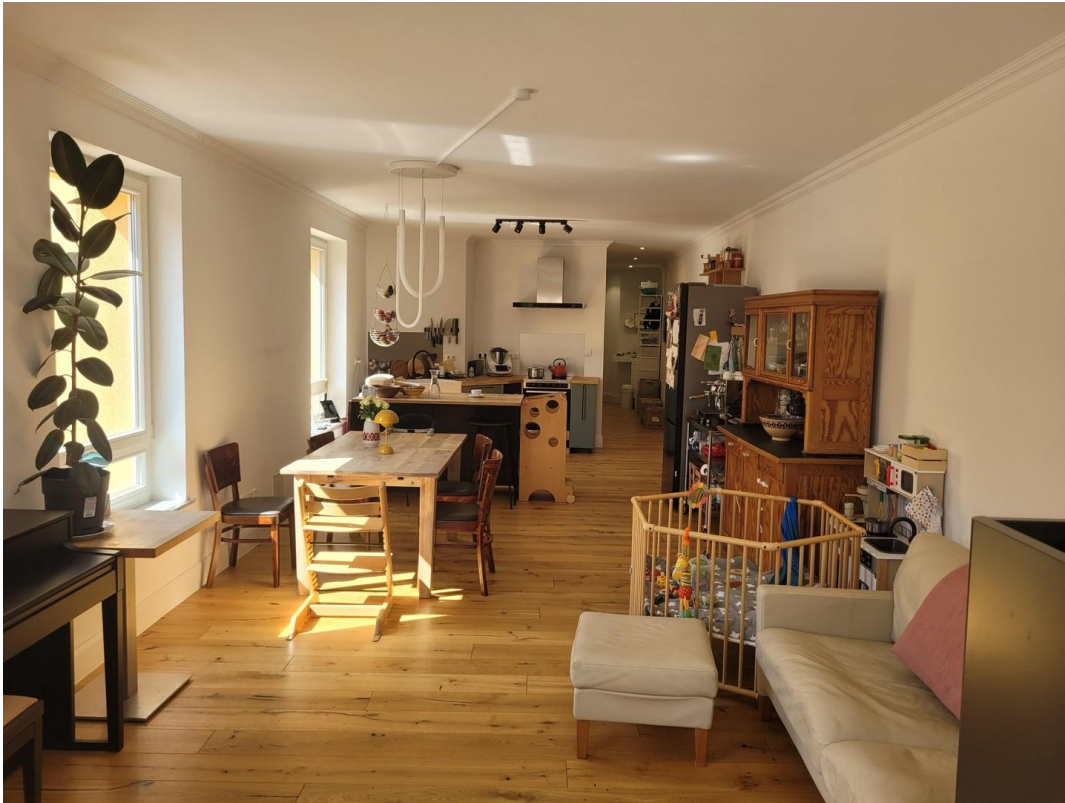
Wohnzimmer mit Küchenbereich