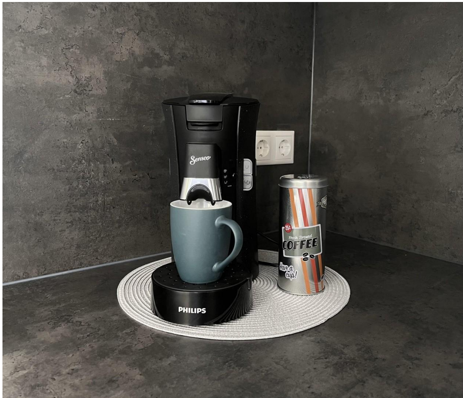
Genießen Sie ihre Kaffee