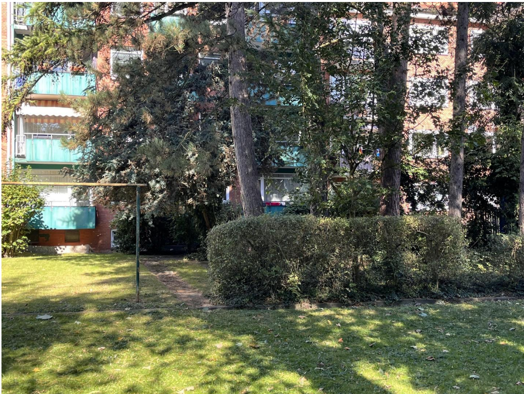
schöner, ruhiger Garten