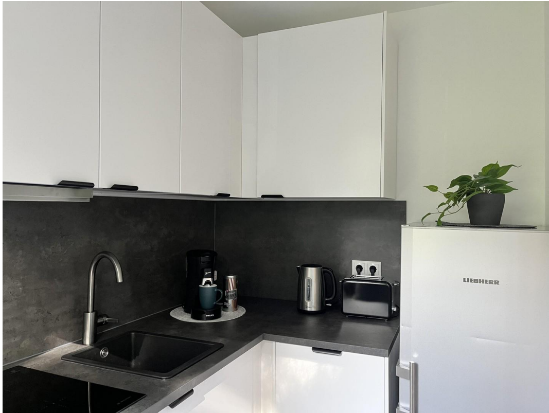
moderne, neue Einbauküche