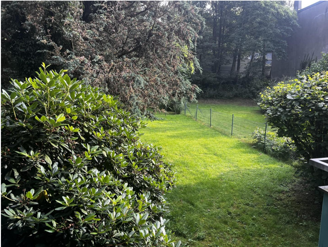
Blick aus der Küche