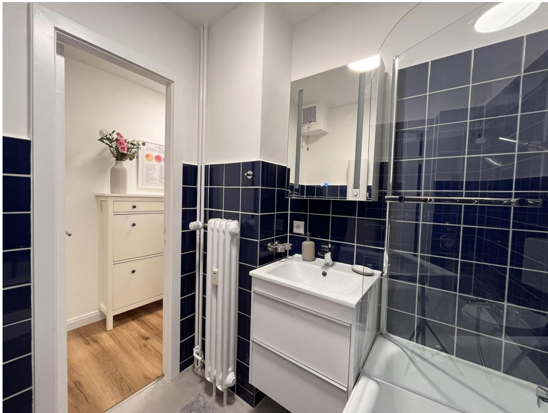
Blick aus dem Bad