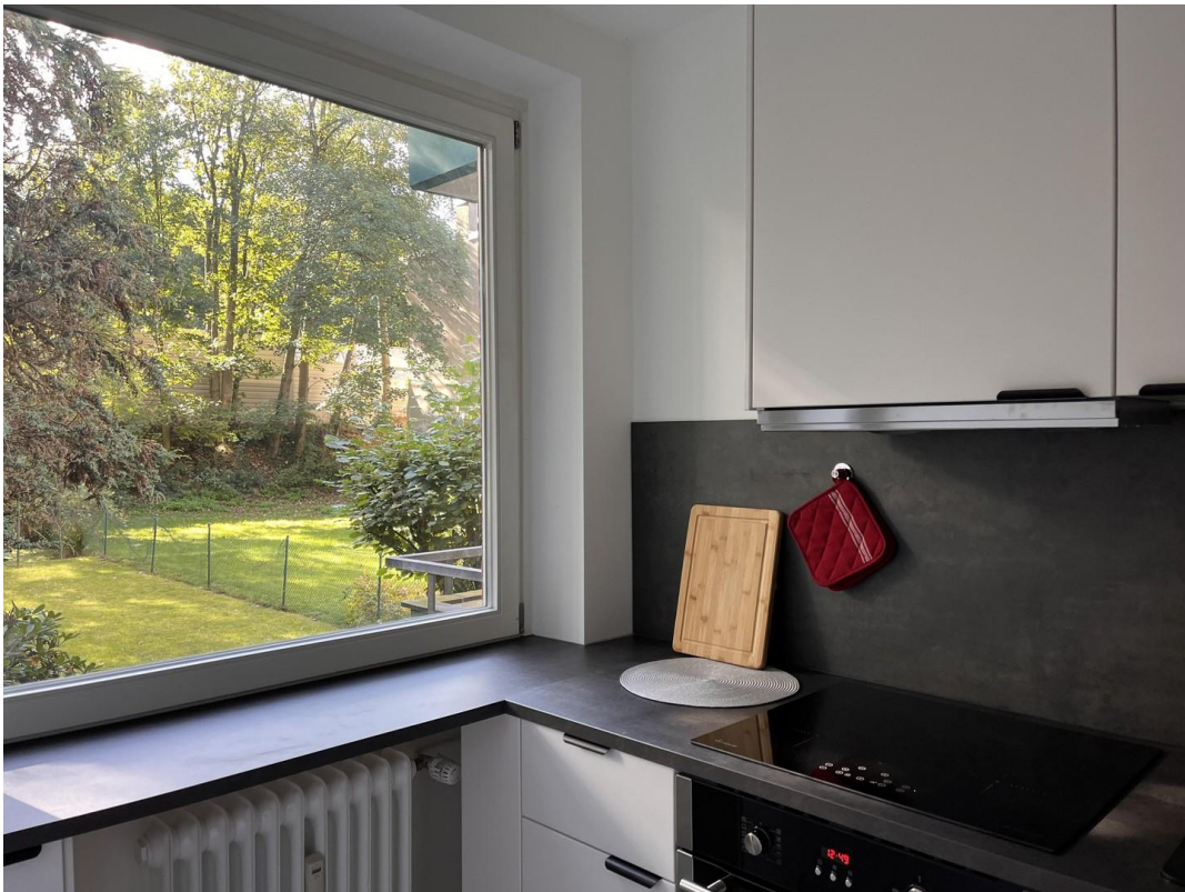
moderne, neue Einbauküche