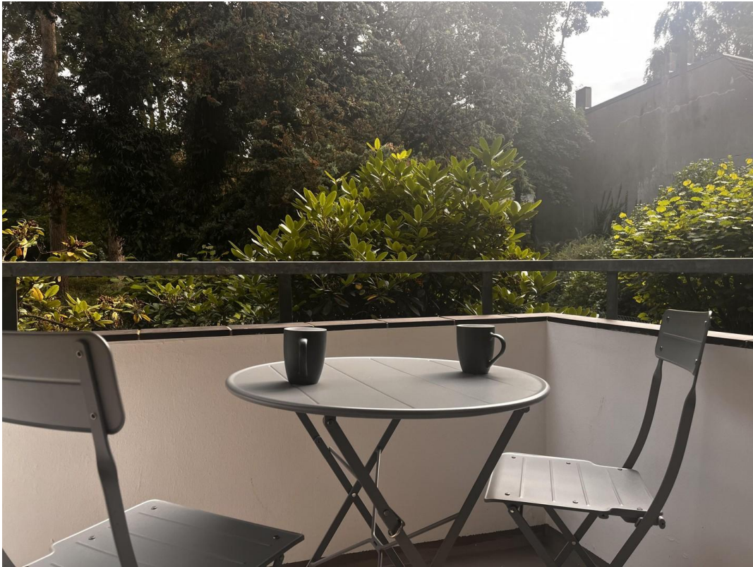
Balkon mit Blick ins Grüne