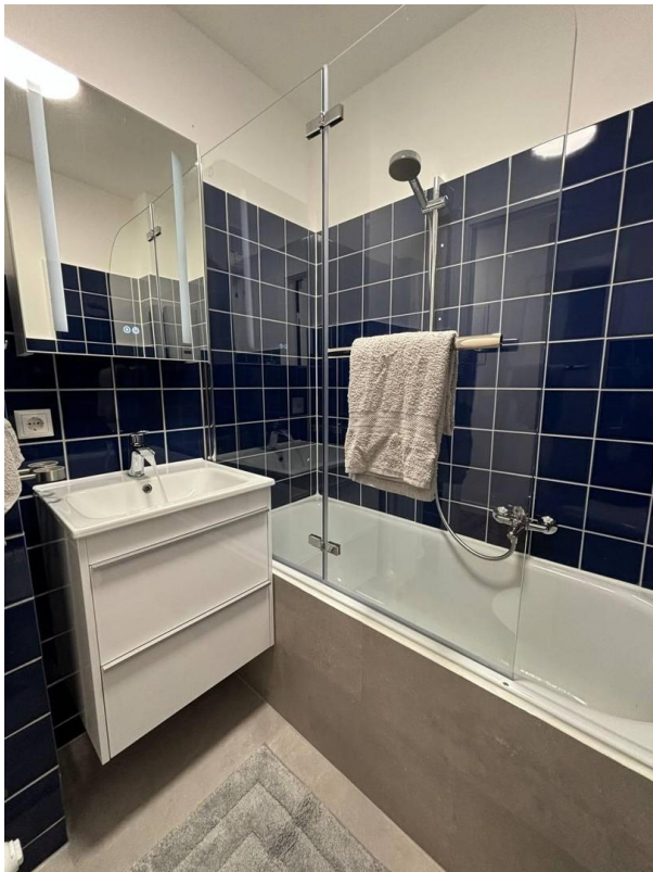
kleines, gemütliches Vollbad