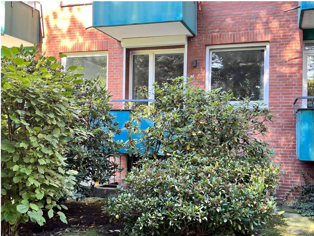
Blick auf den Balkon