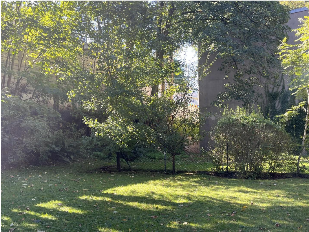
schöner, ruhiger Garten