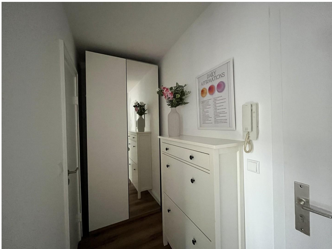
Flur mit Schrank