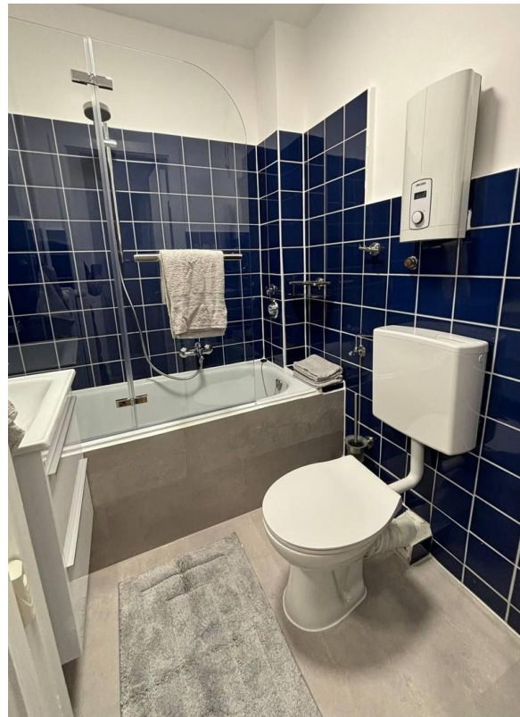
kleines, gemütliches Vollbad