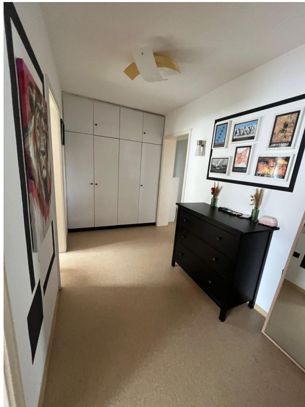
Flur mit Einbauschränk