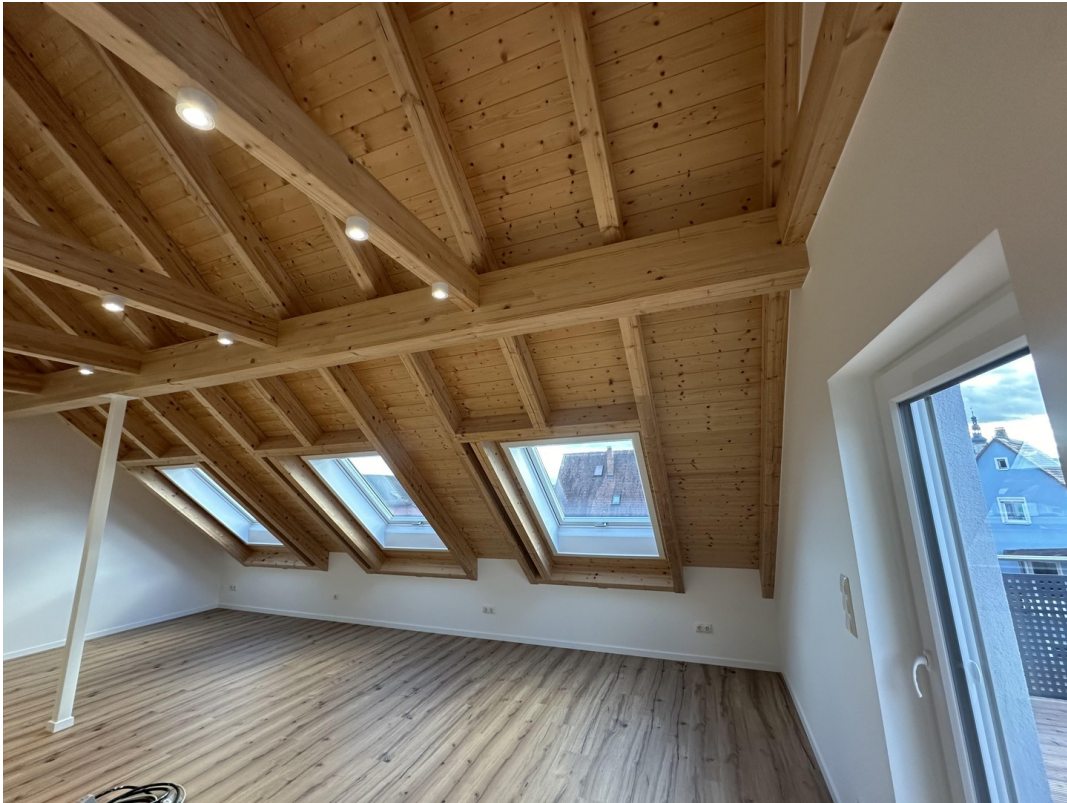
Wohn - Küche