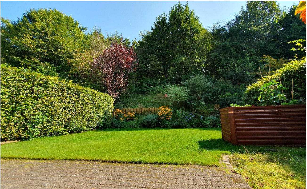
Garten mit Hochbeet