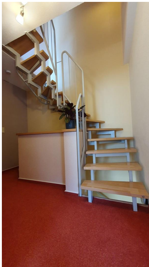
Treppe ins Dachstudio