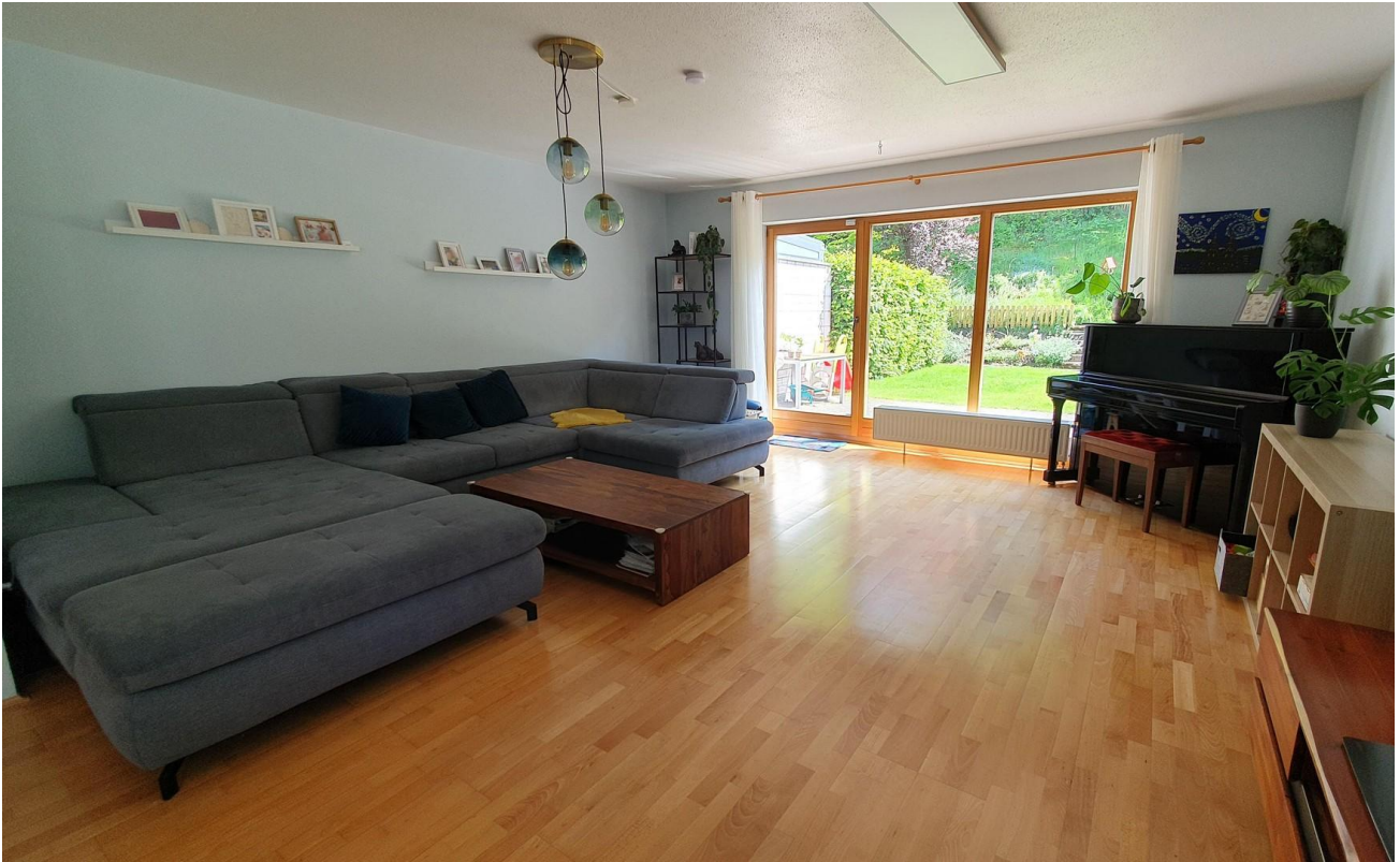
Wohnzimmer mit Gartenzugang