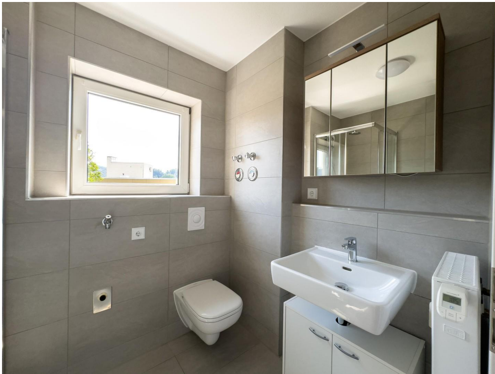
Bad mit Waschmaschine