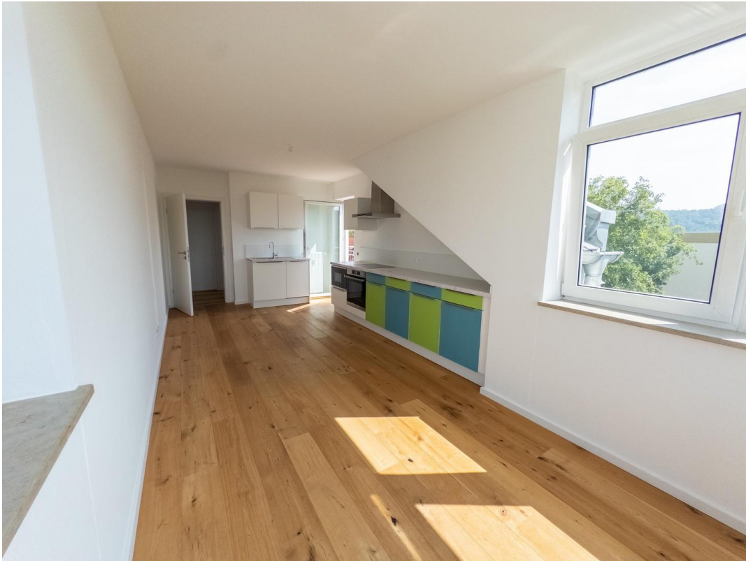
Wohn - und Essbereich