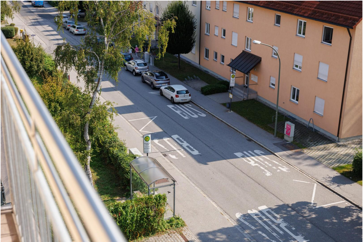
Bushaltestelle vor der Haustür