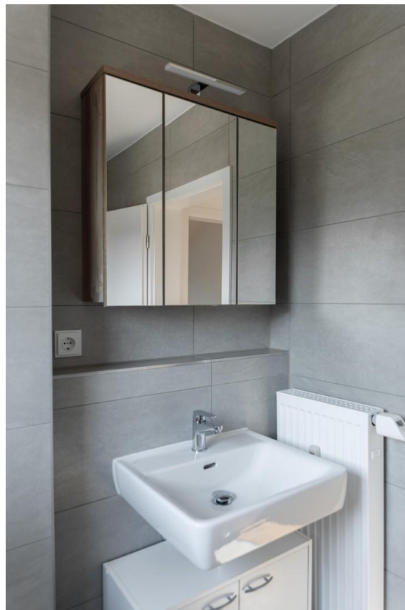
Bad mit Spiegelschrank