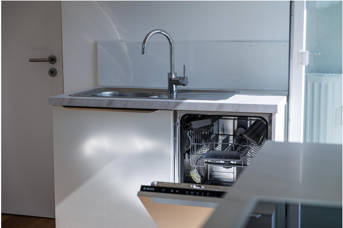
Küche mit Geschirrspüler