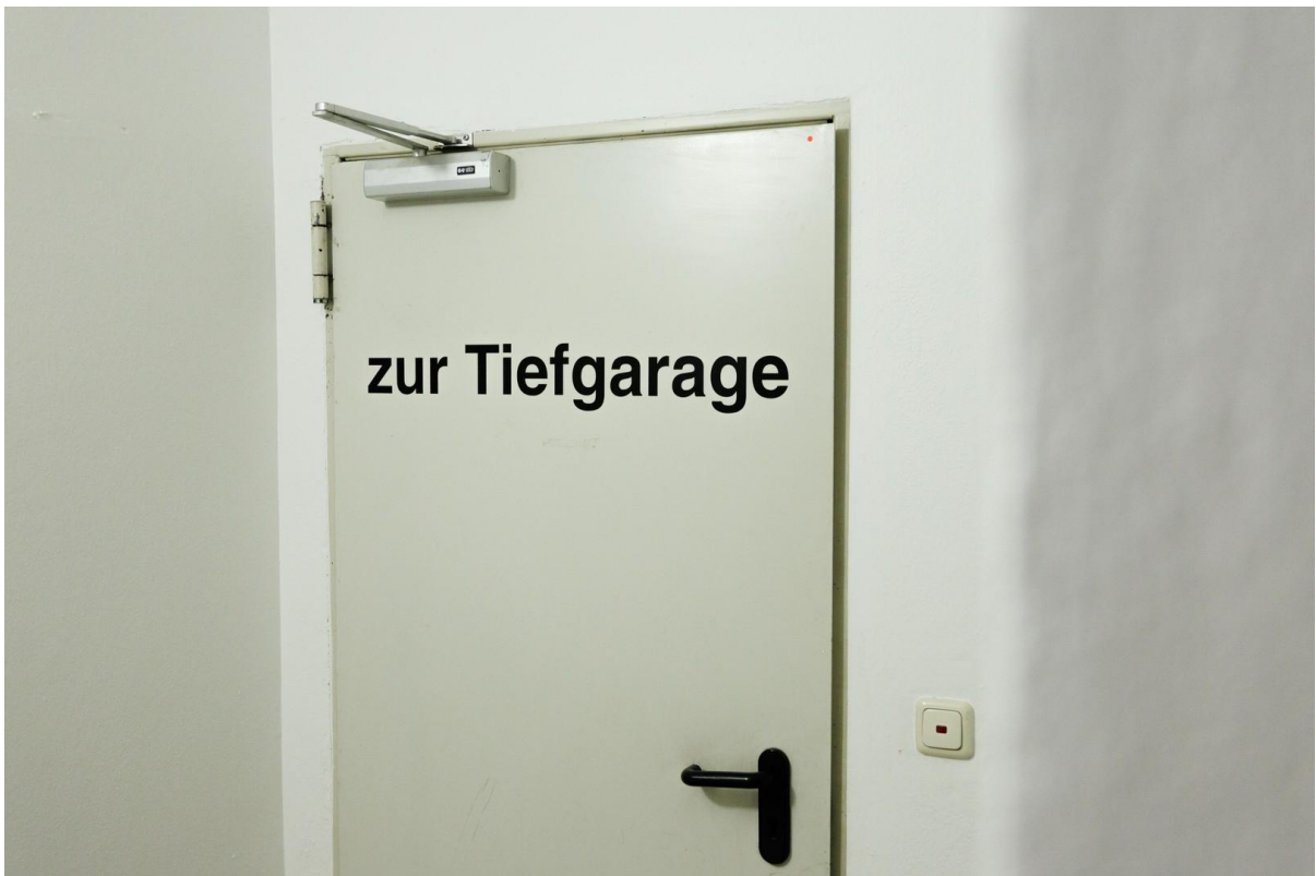
Tiefgarage mit Aufzug