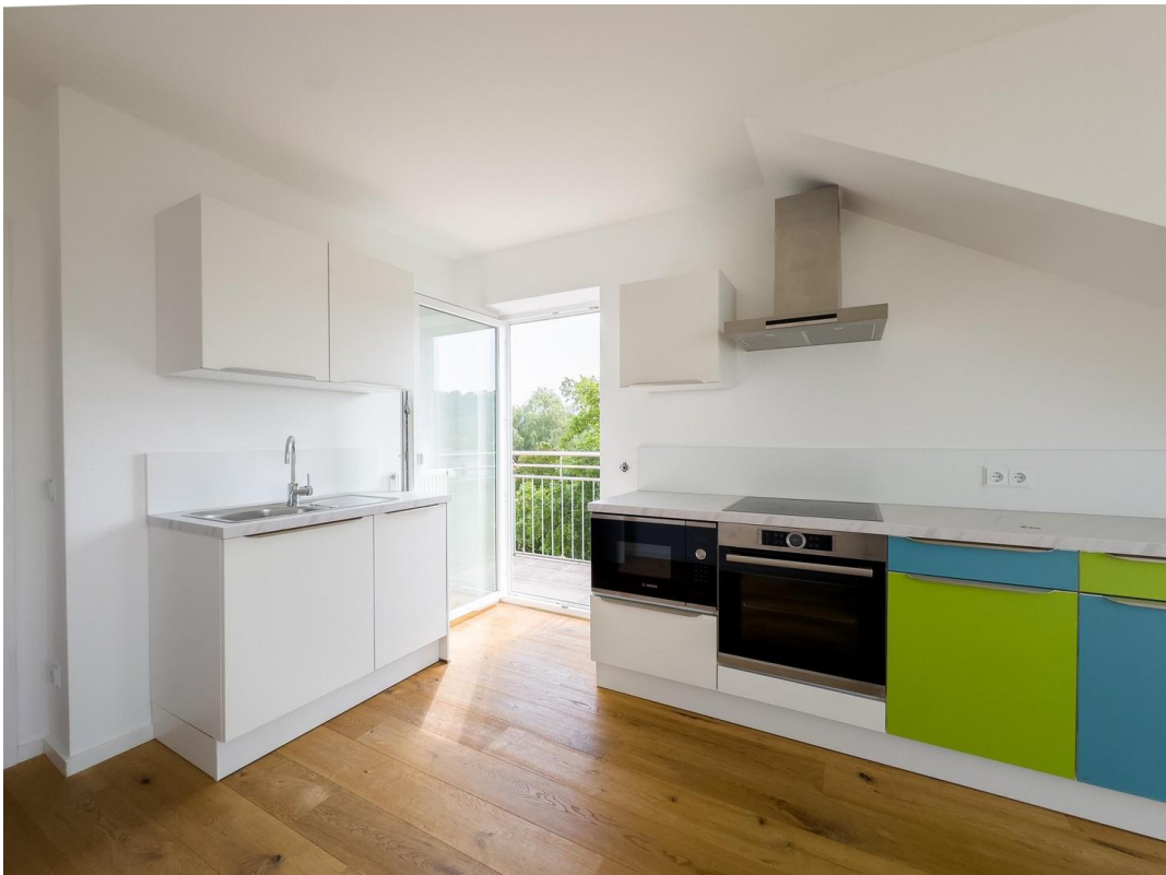
Küche mit Balkonzugang