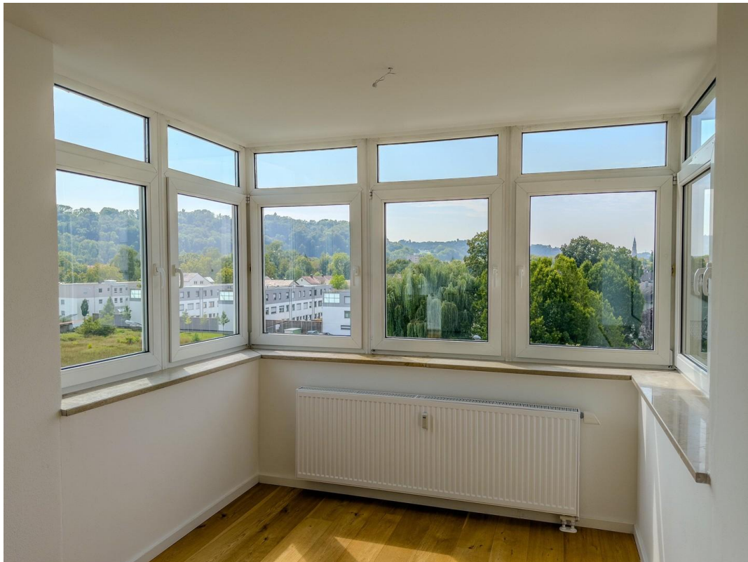
Loggia im Wohn/Essbereich