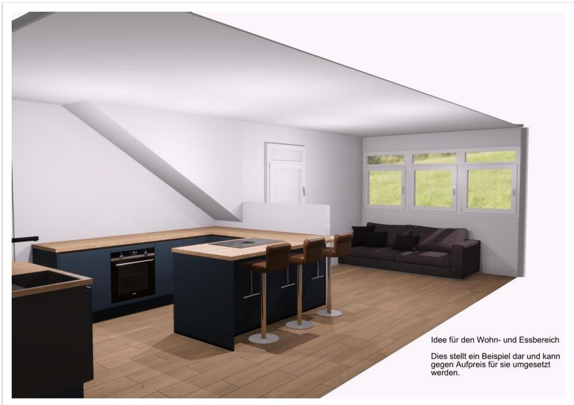
Idee für den Wohn- und Essbereich Dies stellt ein Beispiel dar und kann gegen Aufpreis für sie umgesetzt werden.