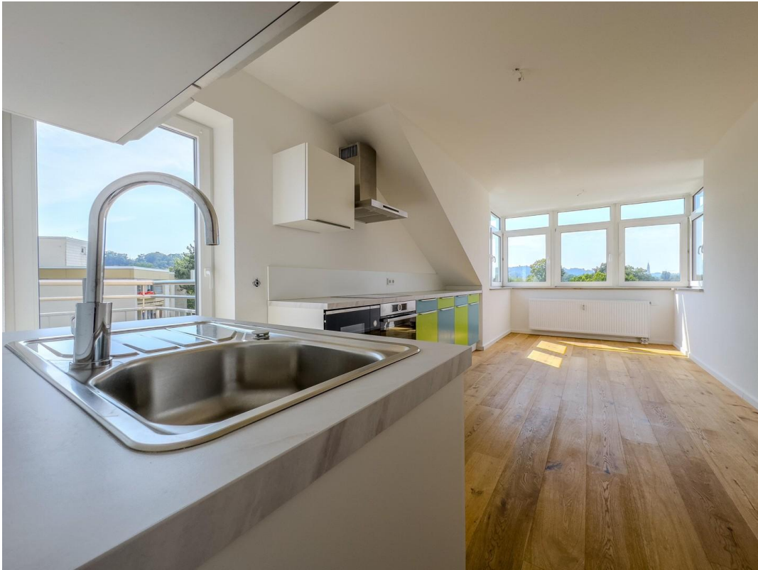
Wohn - und Essbereich