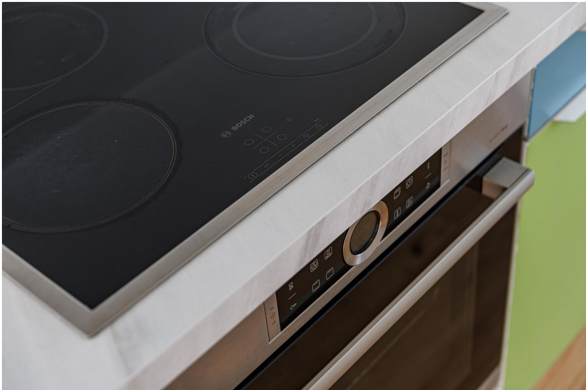
Küche mit Backofen und Mikro