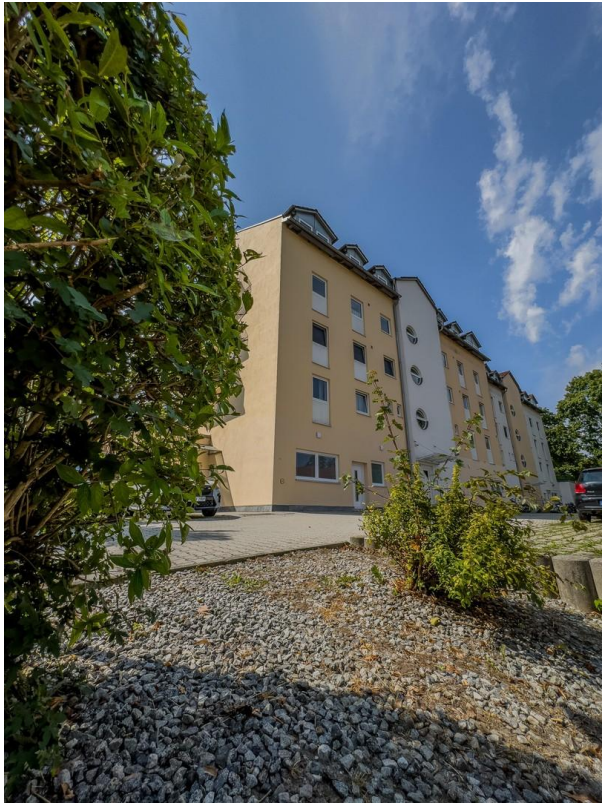
Wohnanlage mit Tiefgarage