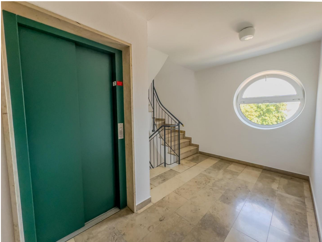
Aufzug mit Hausgang