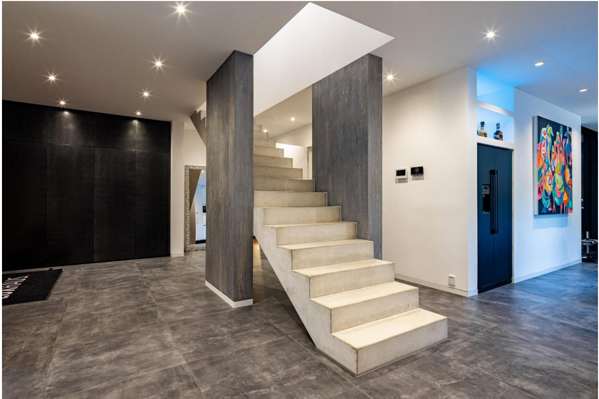
Flur / Treppe