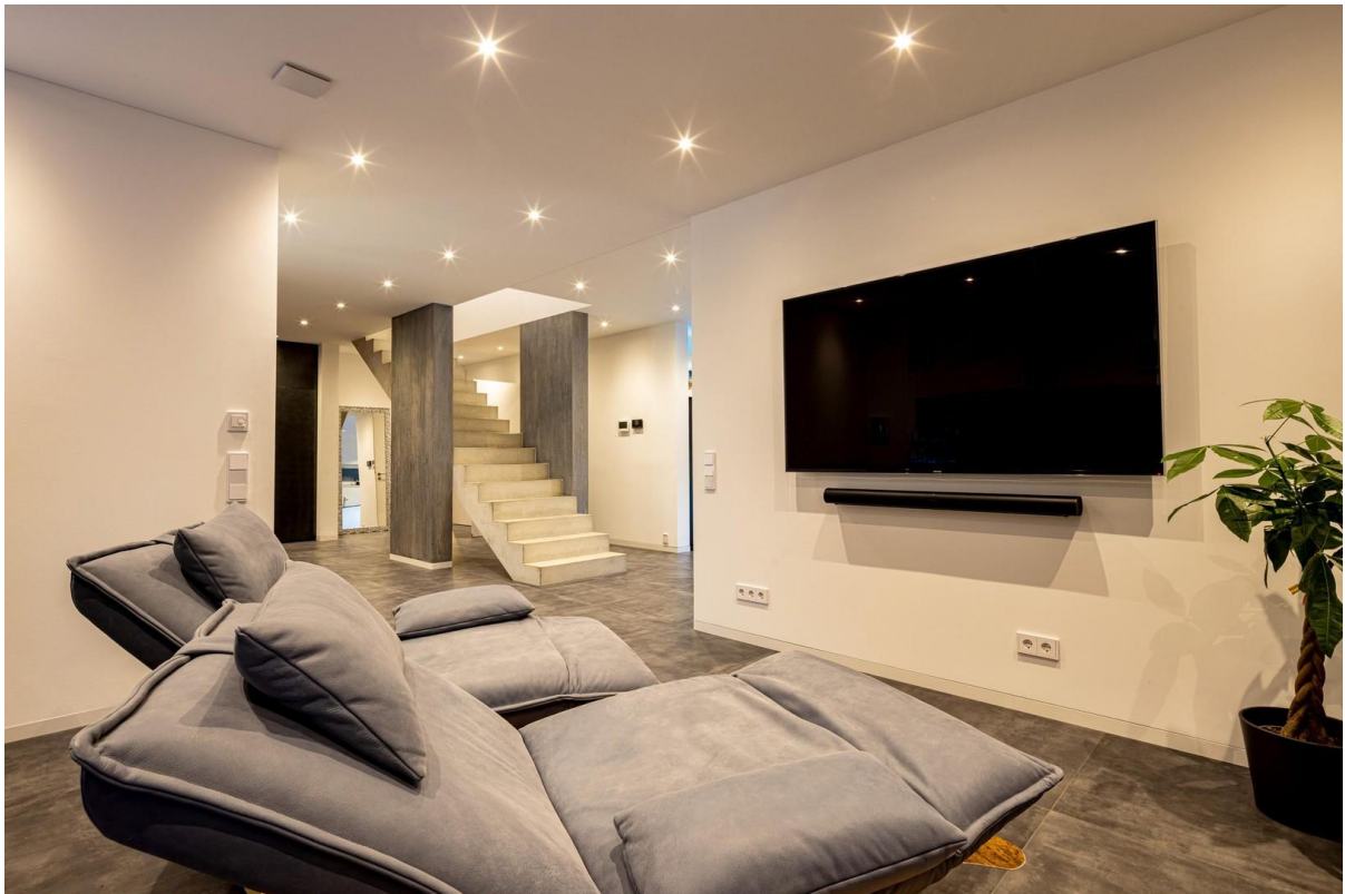
Wohnzimmer / Bar