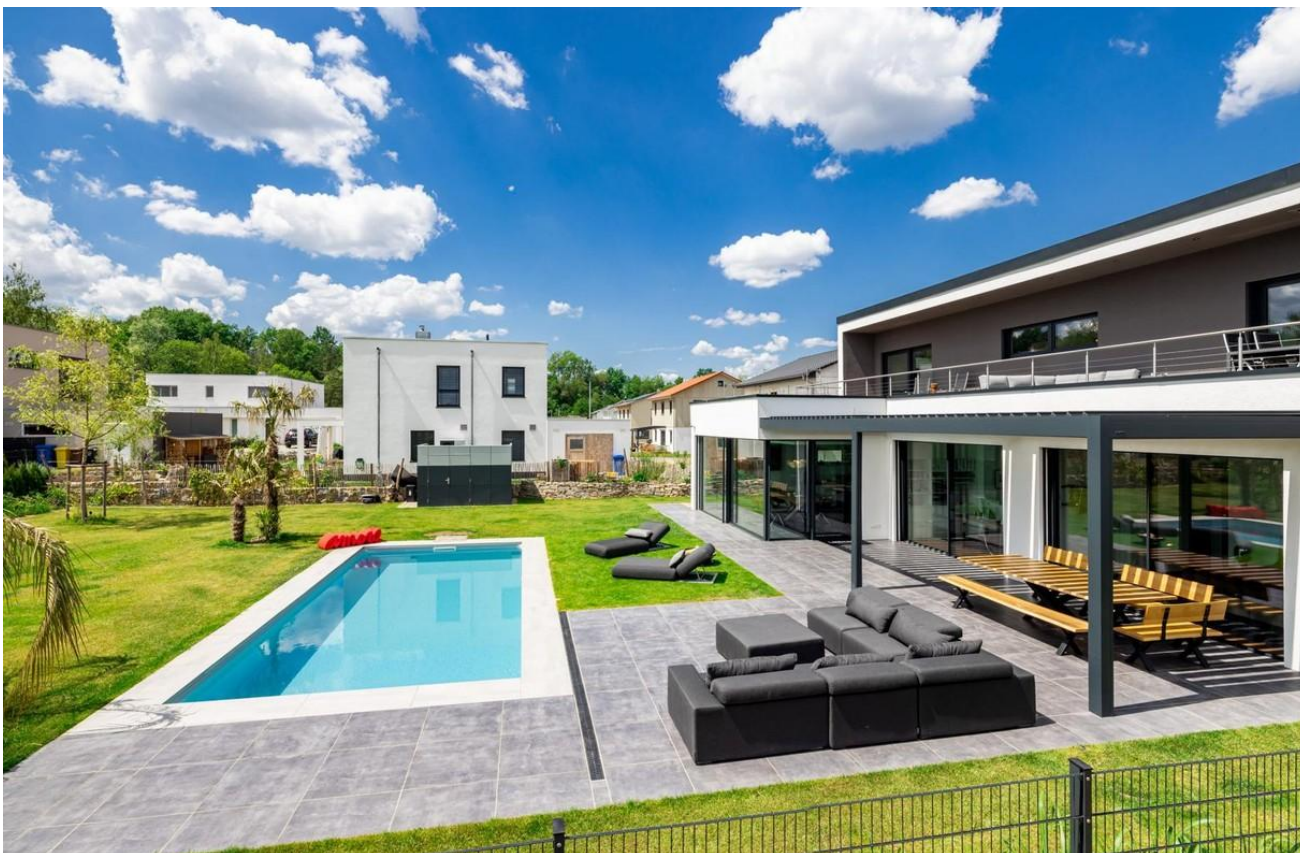
Haus mit Pool