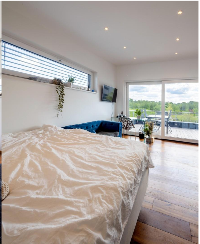
Kinderzimmer mit Dachterrasse