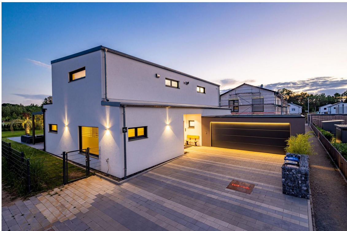
Garage / Eingang