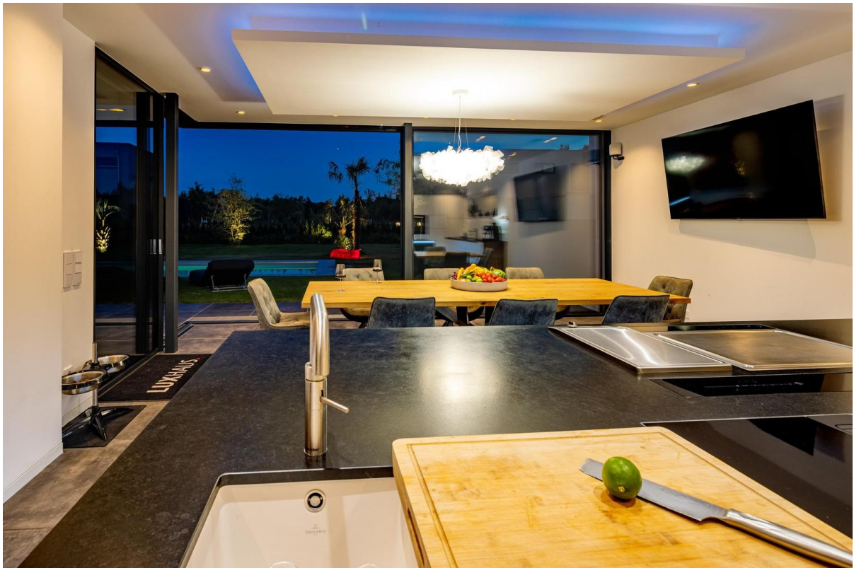
Küche / Essen