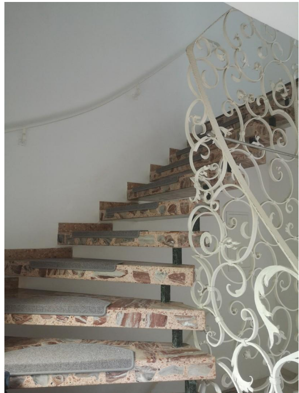
Treppe zum OG