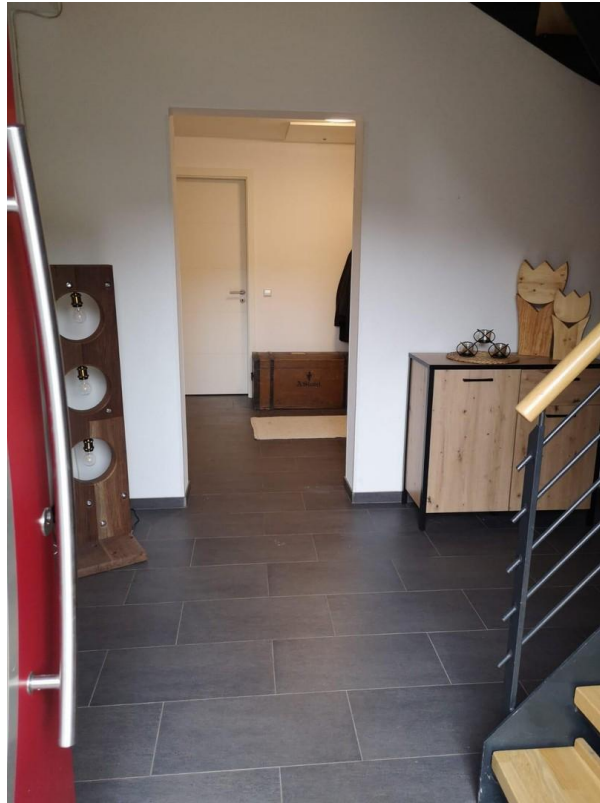
Flurbereich zur EG Wohnung