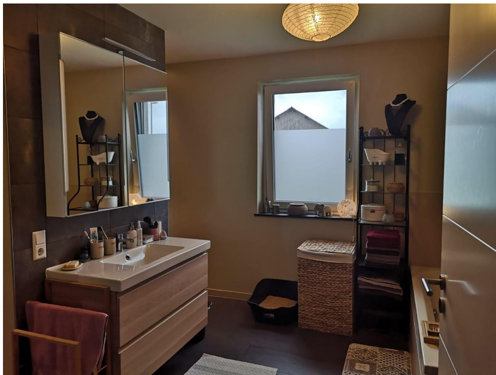
Bad versteckte Dusche+WC