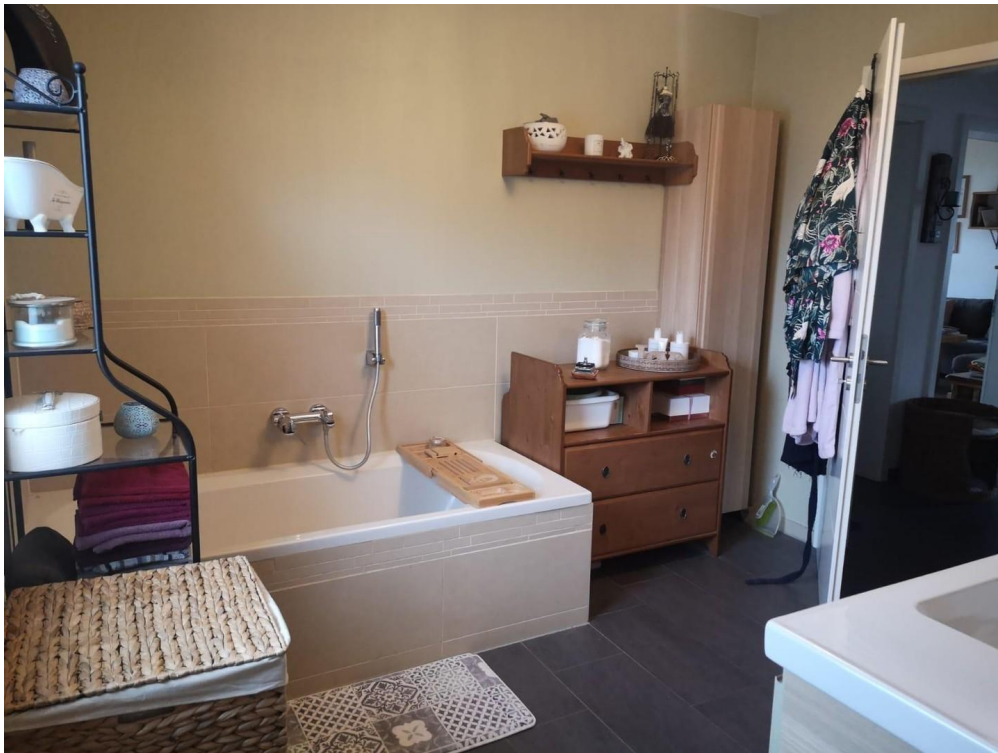
Bad - Badewanne