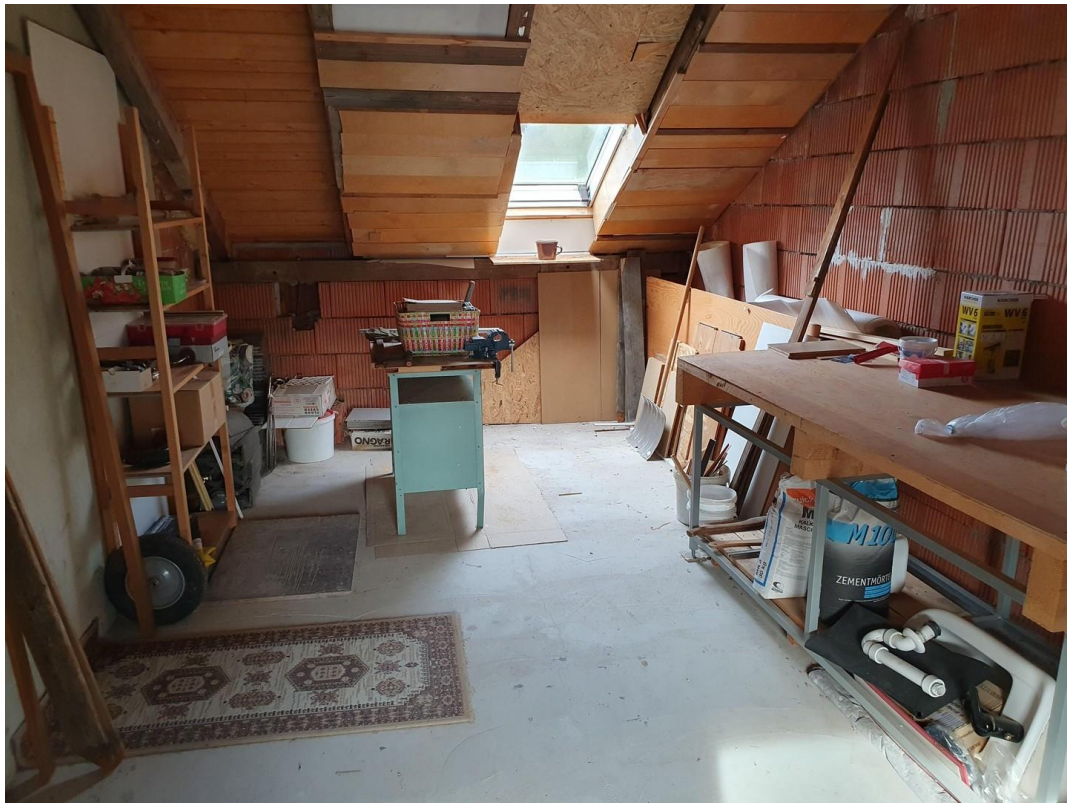
Dachboden / Speicher OG