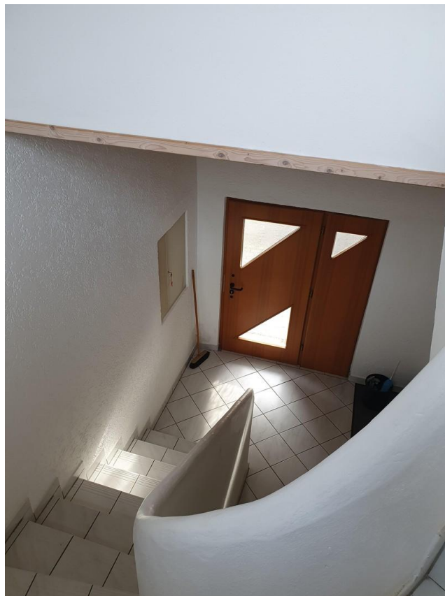
Haustüre der OG/DG Wohnung