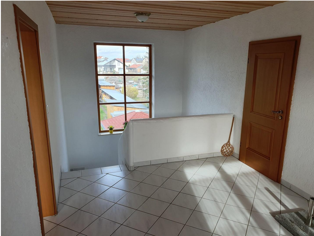
Treppe ins EG zur Haustüre