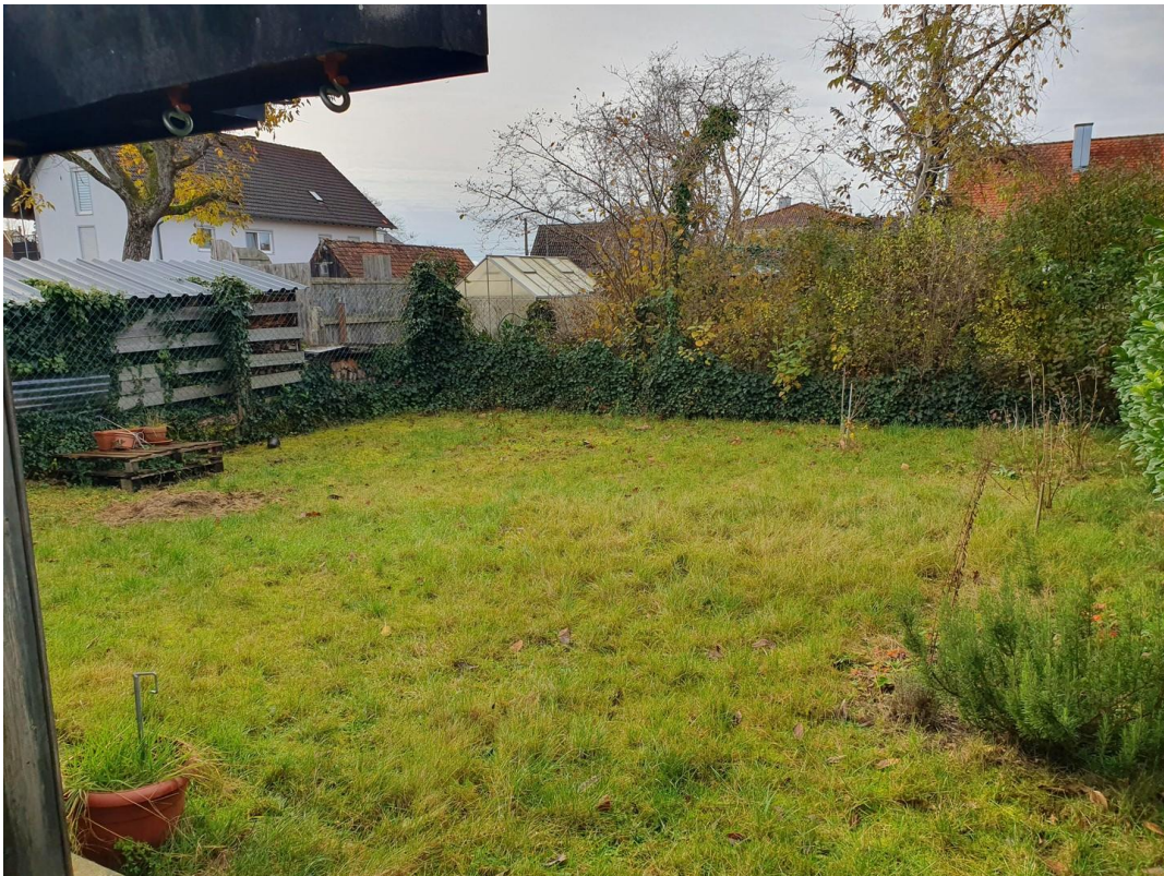
Garten der OG/DG Wohnung