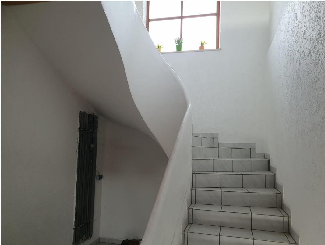
Treppenaufgang von der Haustür