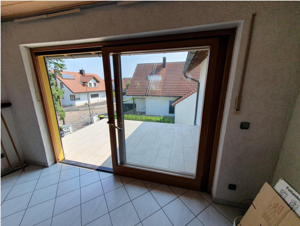
Panoramafenster Küche, Balkon