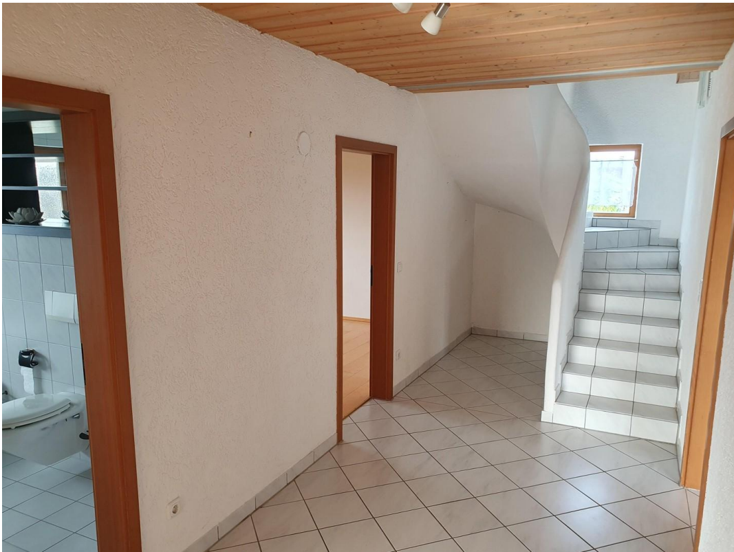
Flur OG mit Treppe ins DG