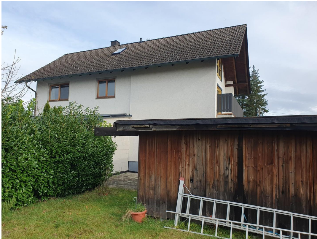
Carport/Haus vom Garten aus