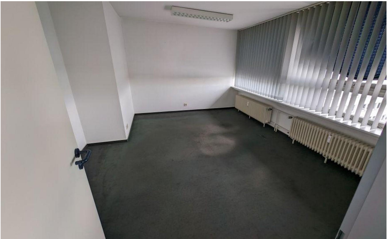
Büro vorne links