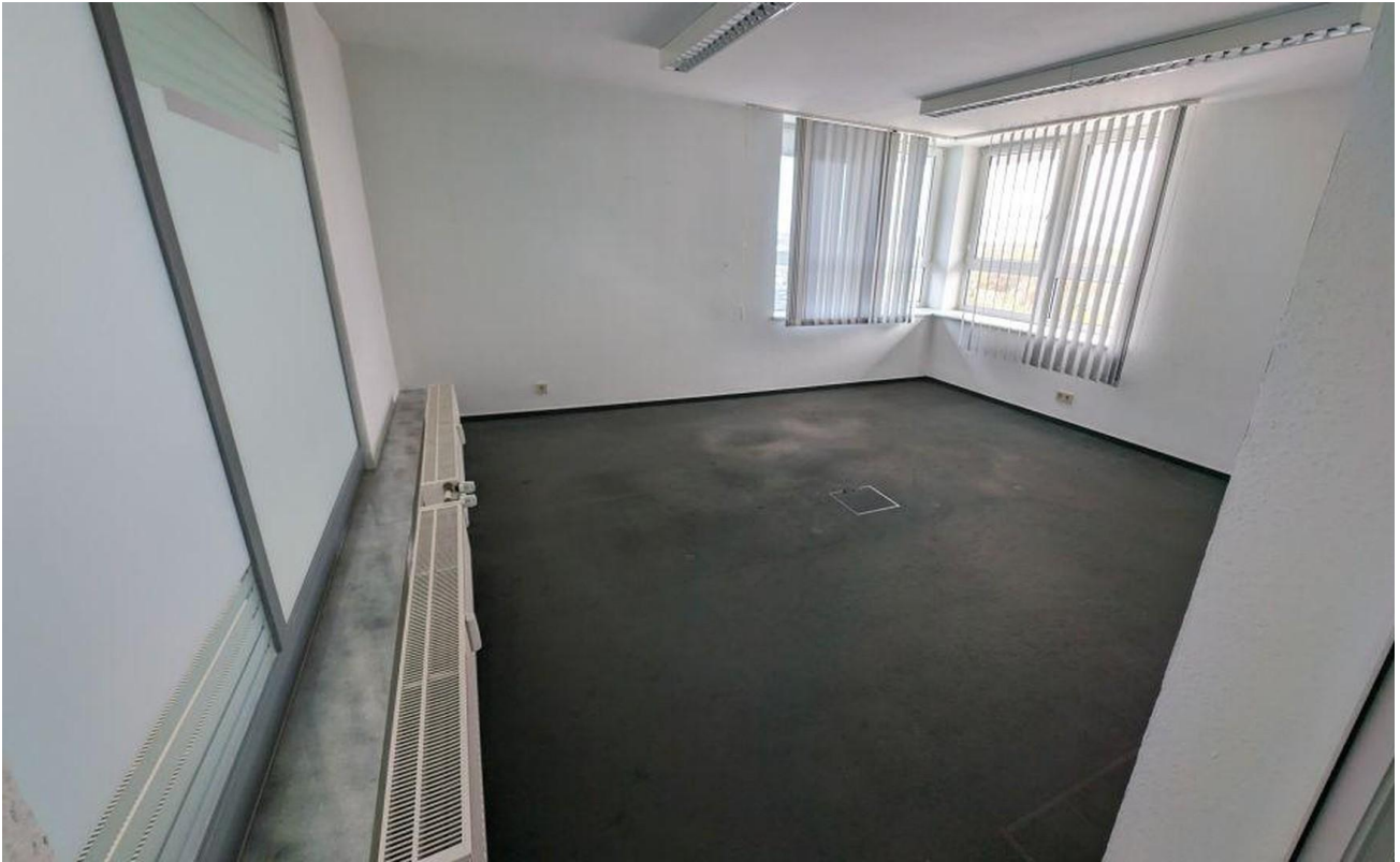
Büro hinten rechts