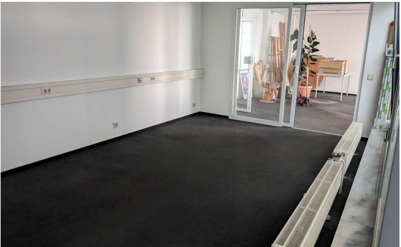
Plotter- und Serverraum