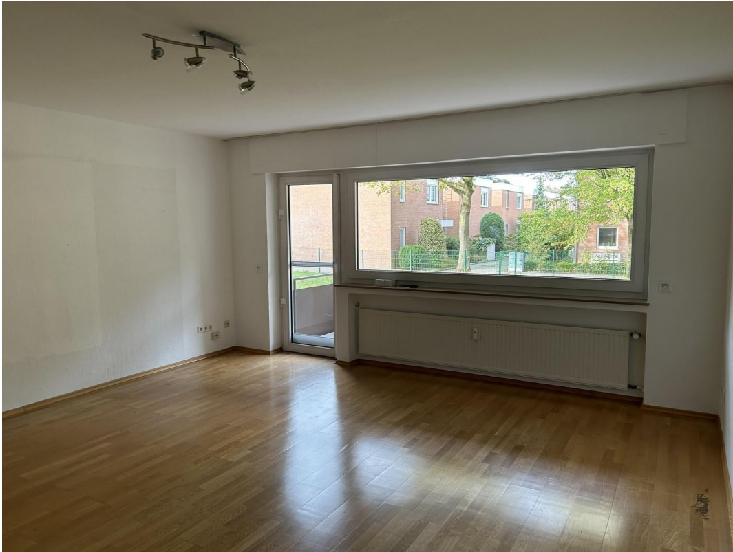
Wohnzimmer mit großem Balkon