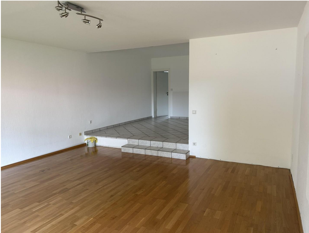
Wohnzimmer mit Esszimmer