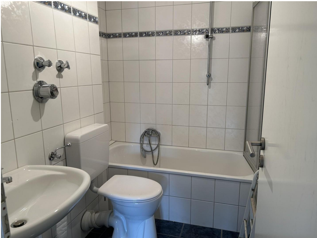
Bad mit Badewanne