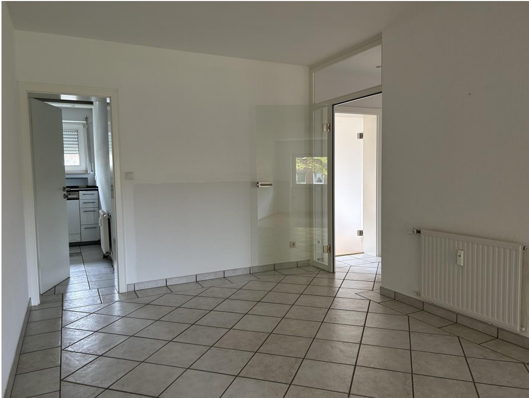
Esszimmer mit Zugang zur Küche