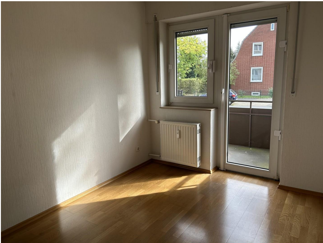
Kinderzimmer mit Nordbalkon