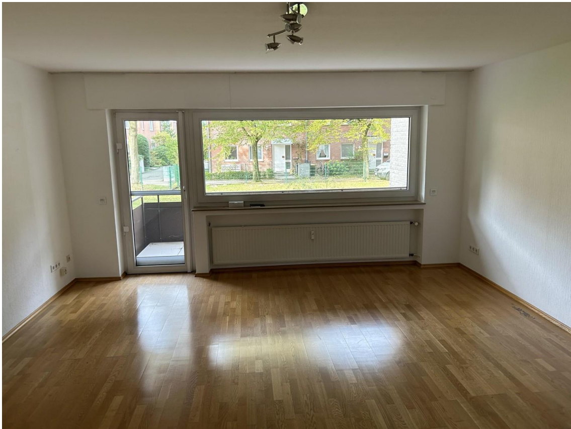
Südbalkon mit Markise