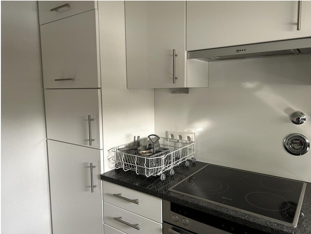
Einbauküche mit E-Geräten