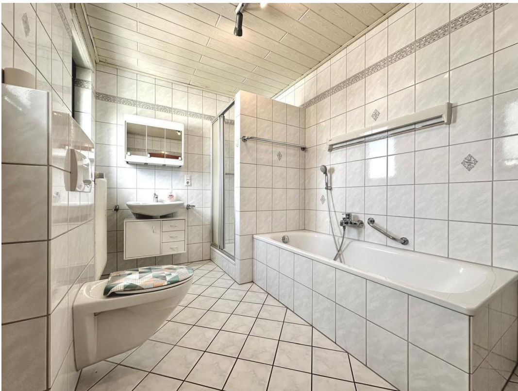
Bad 2 oben