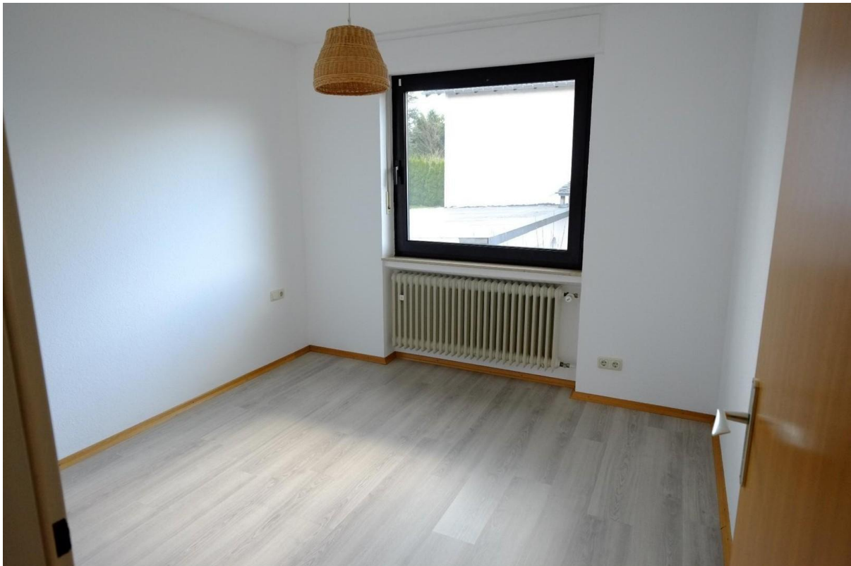
Schlafzimmer 2 oben