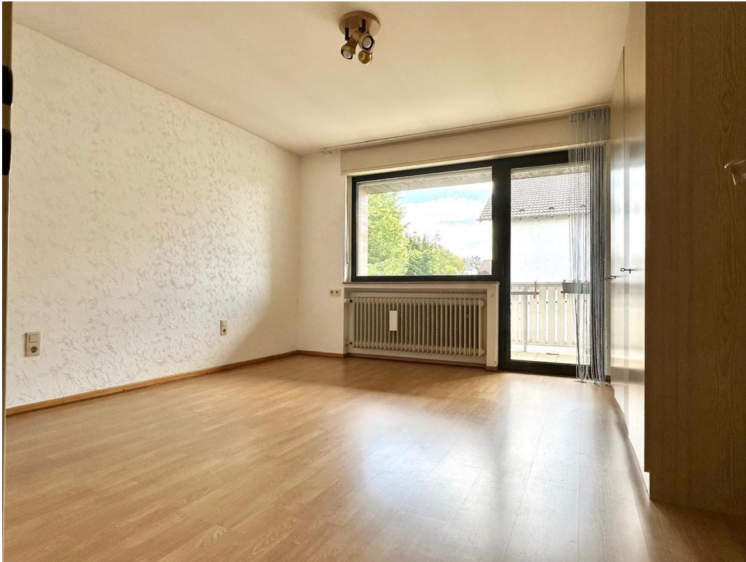
Schlafzimmer 2 oben