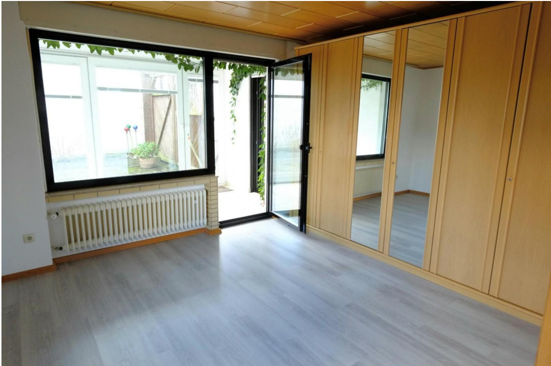
Schlafzimmer unten, Ansicht 2