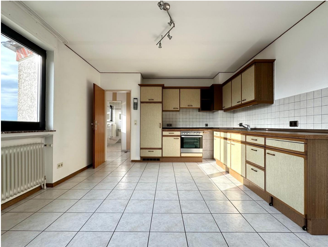
Wohnküche 2 oben