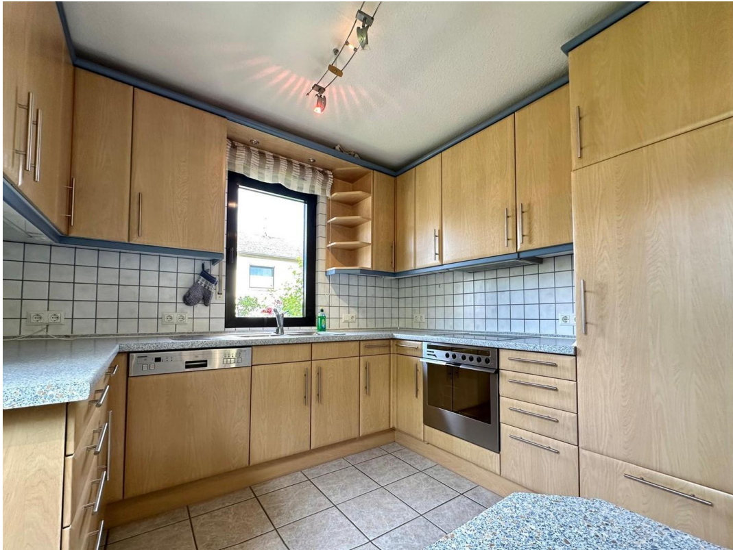
Küche 1 unten