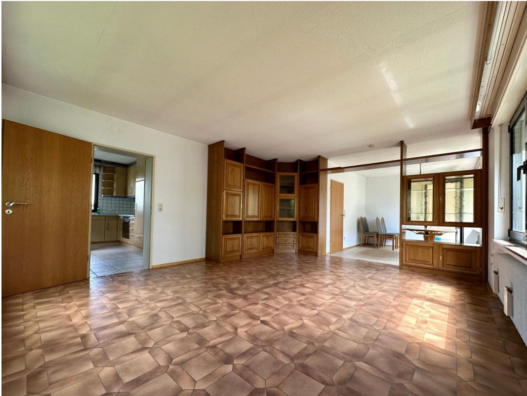
Wohn- und Esszimmer unten