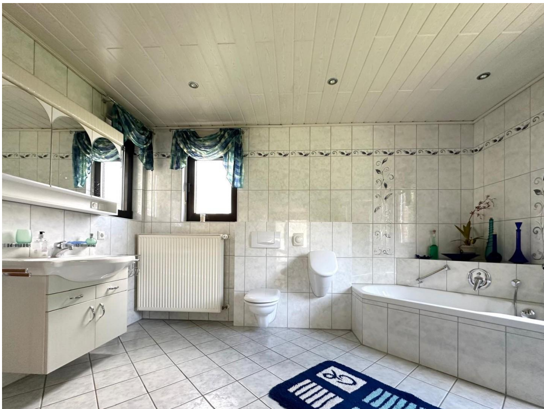
Bad 1 unten