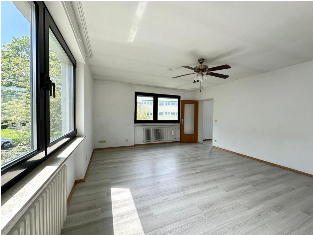
Wohnzimmer oben, Ansicht 2