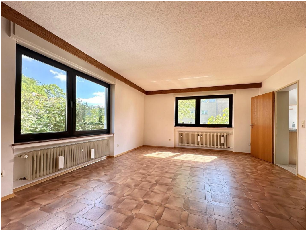
Wohnzimmer unten, Ansicht 2