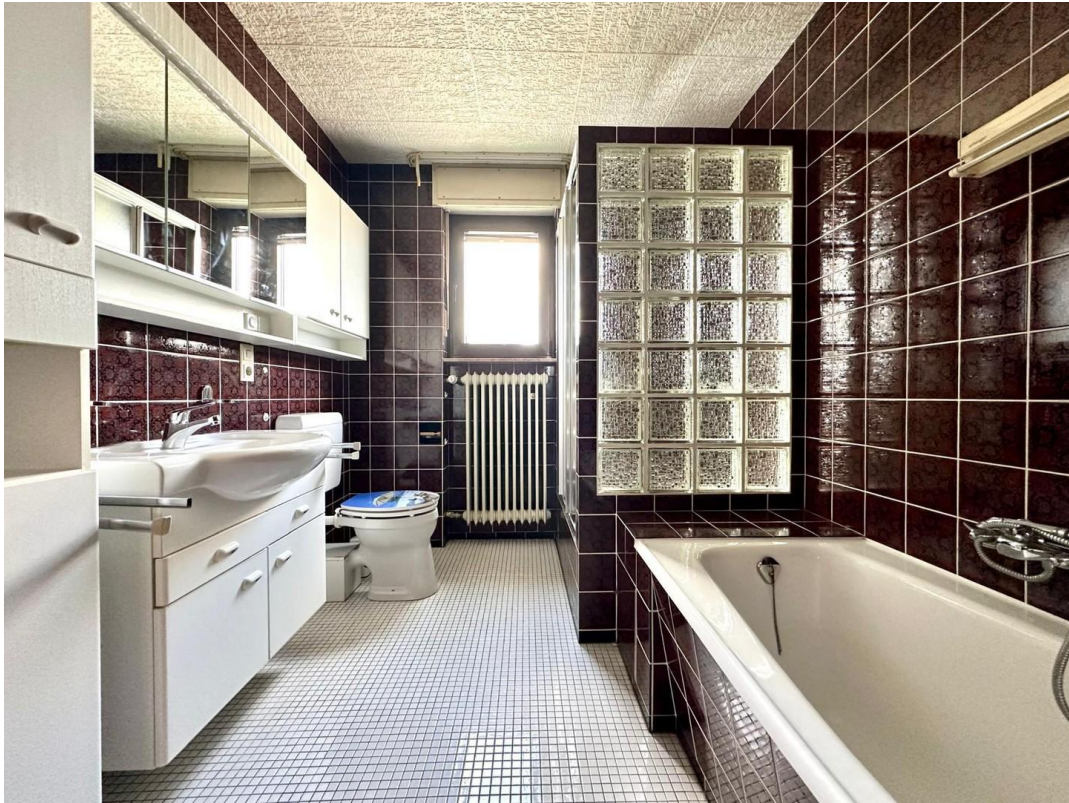
Bad 3 oben