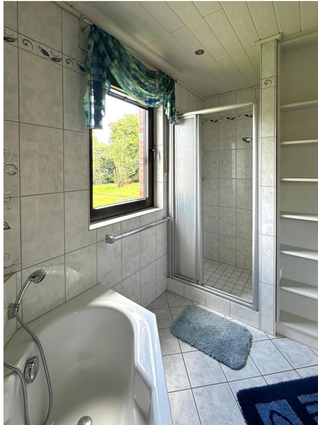
Bad 1 unten, Ansicht 2