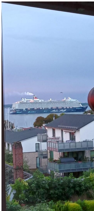
Ausblick Wohnzimmer 2