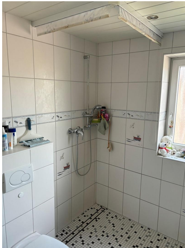
Bad 3 Dusche