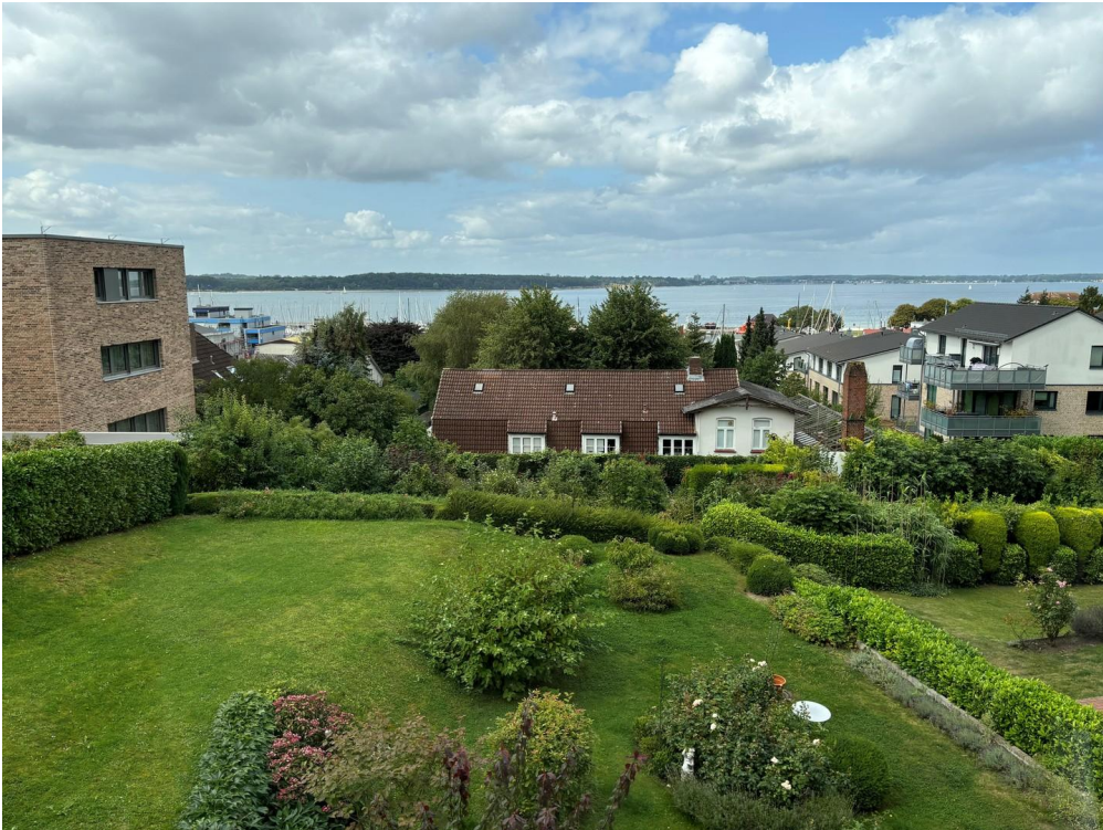
Ausblick Wohnzimmer 1