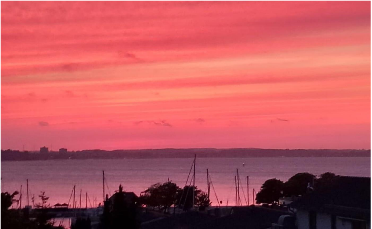
Ausblick Wohnzimmer 3